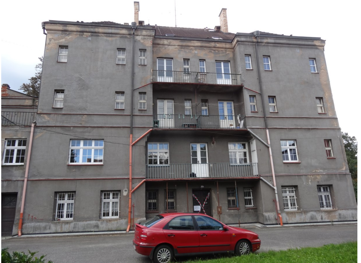
Budova bytového domu - Pohled od severu