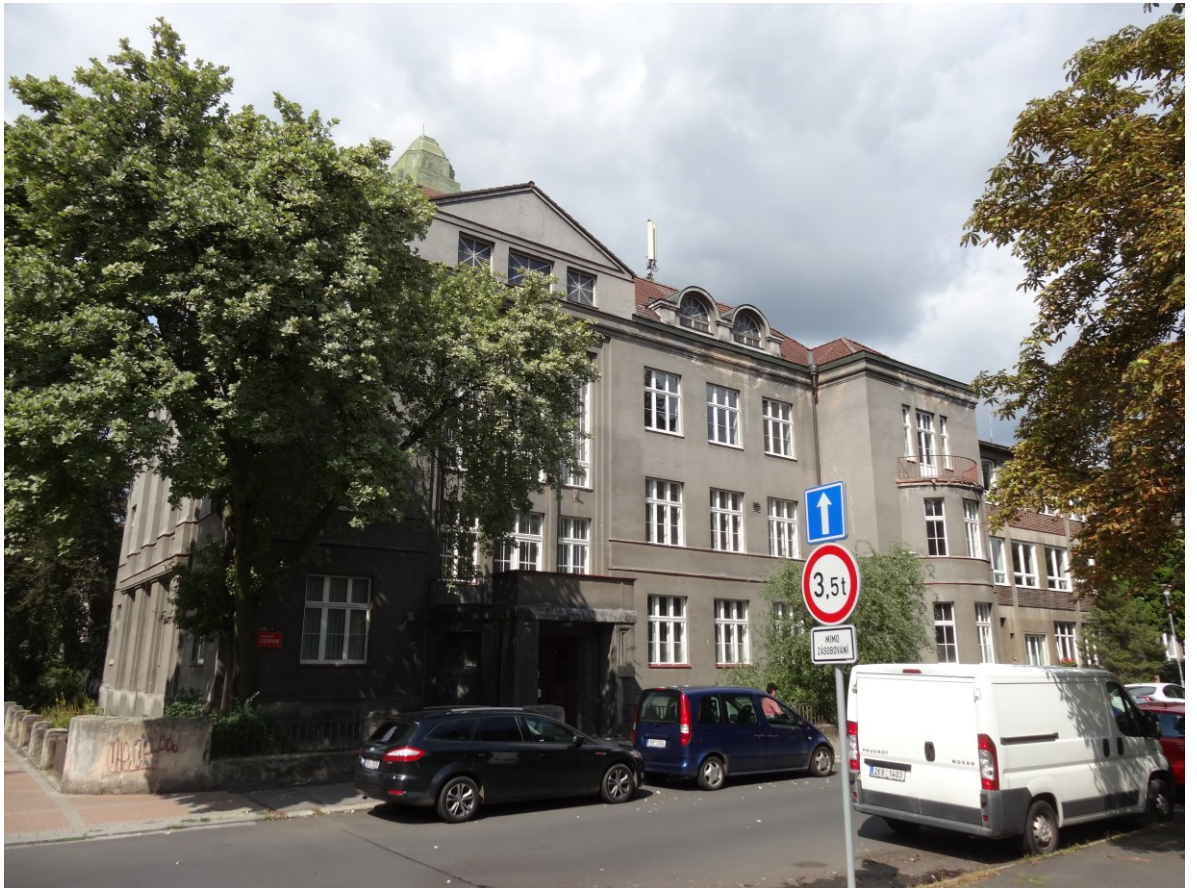
Budova školy - Pohled od jihovýchodu