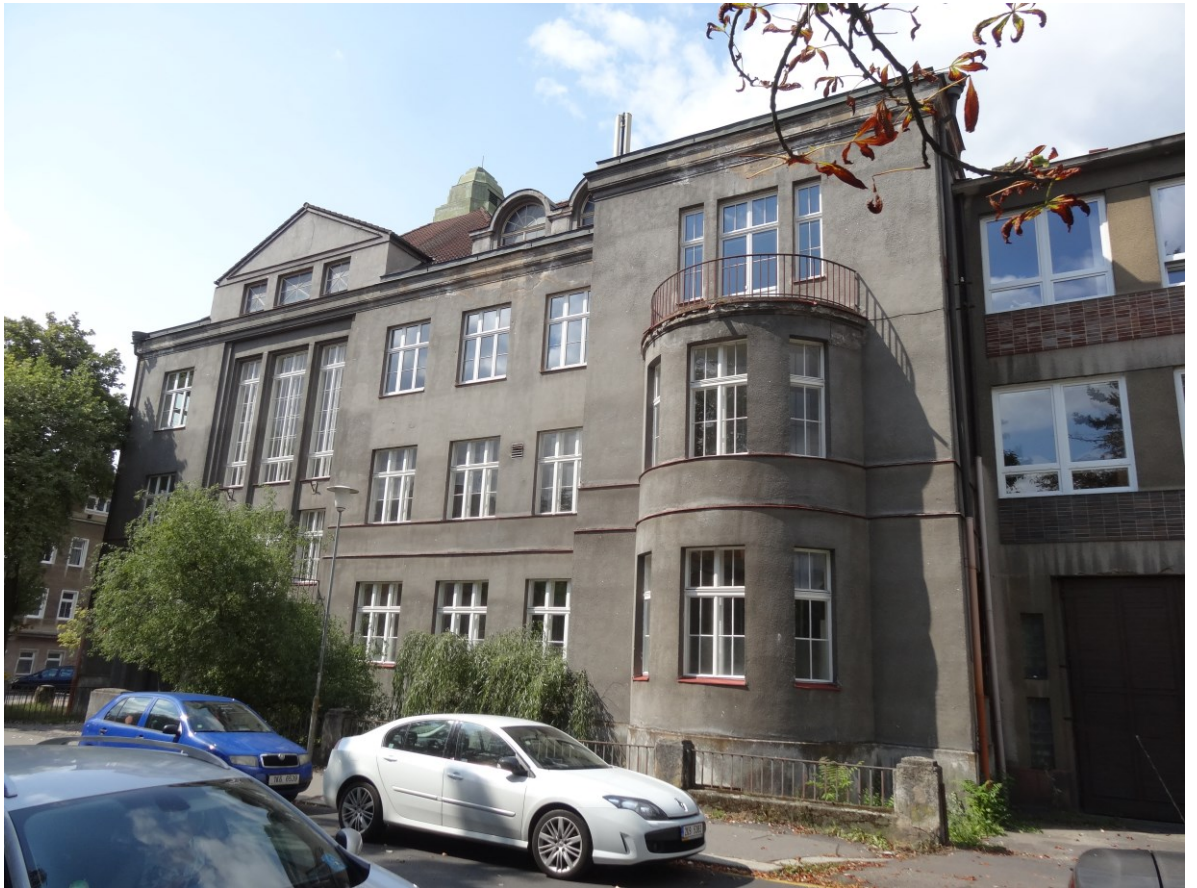
Budova školy - Pohled od severovýchodu