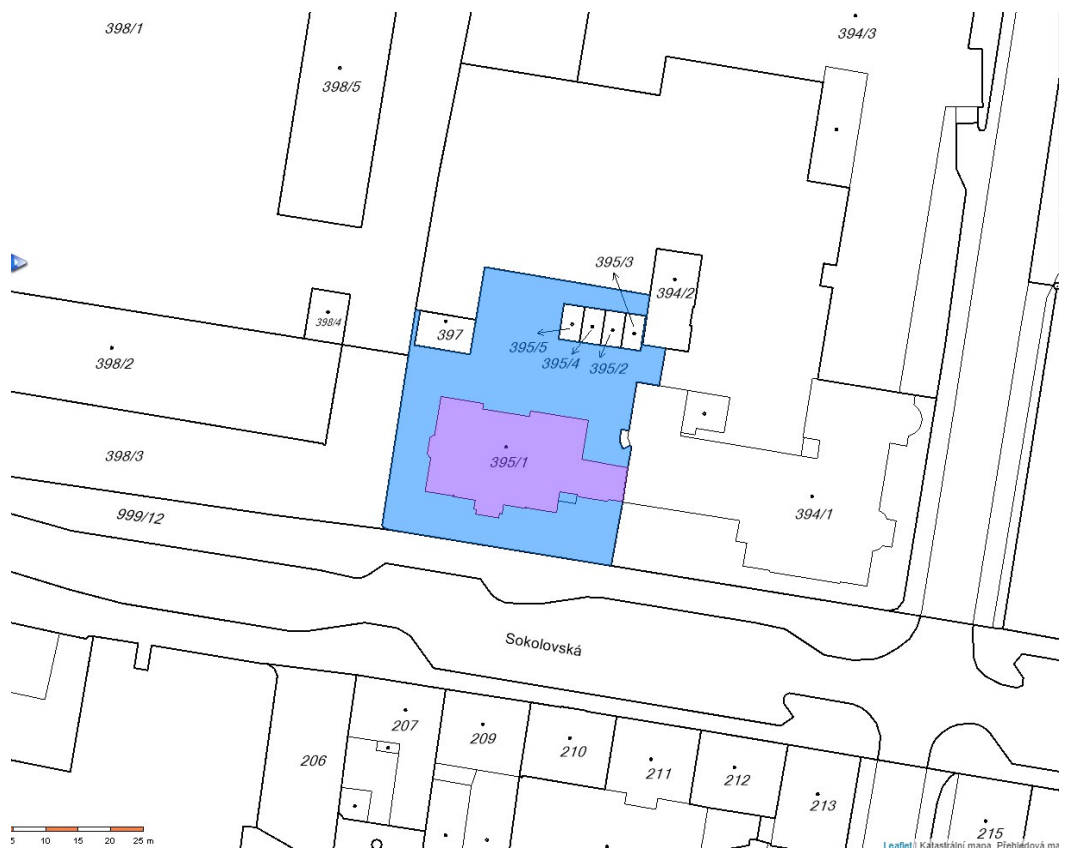
Snímek z KN – budova na pozemku st.p.č. 395/1, k.ú. Rybáře