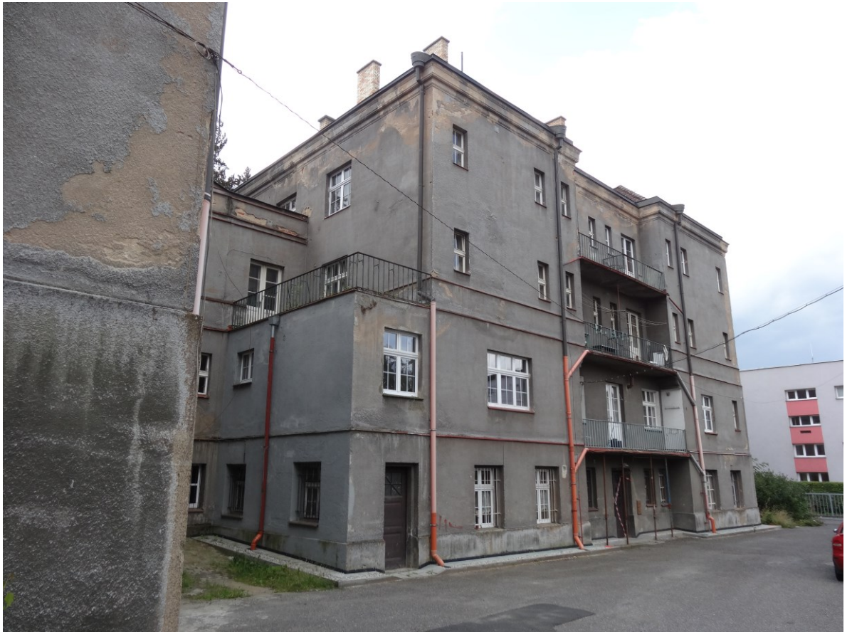
Budova bytového domu - Pohled od severovýchodu