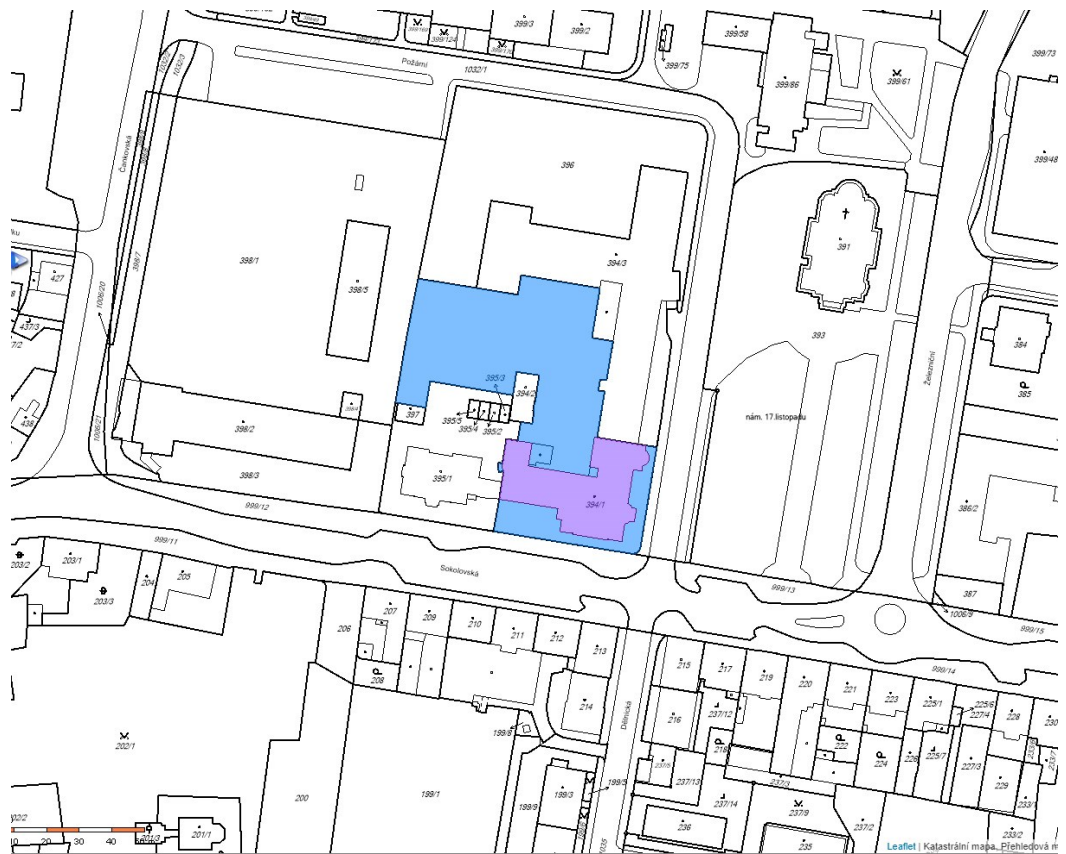
Snímek z KN – budova na pozemku st.p.č. 394/1, k.ú. Rybáře