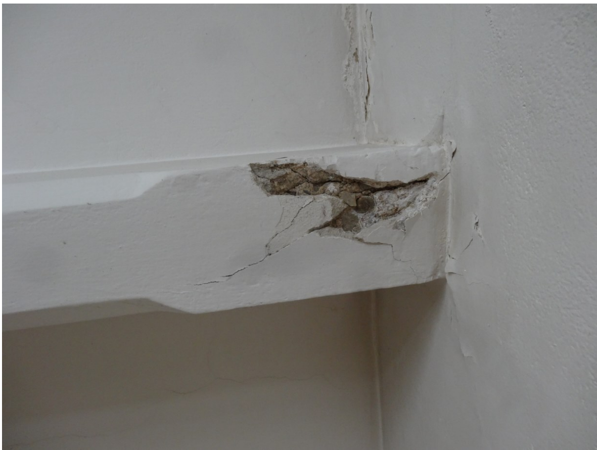
Stropní trám v bytovém domě (přízemní byt na jihovýchodní straně)