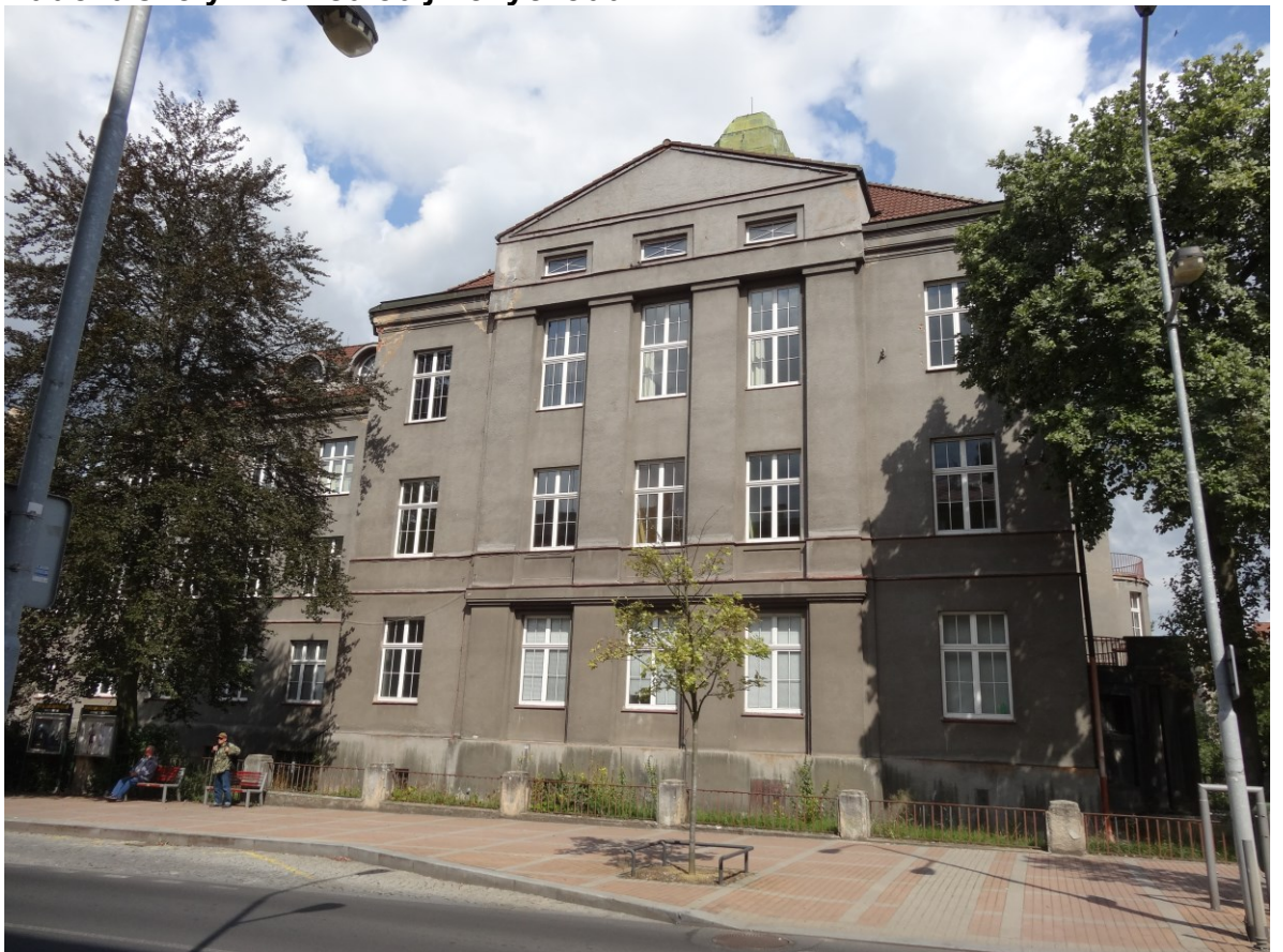
Budova školy - Pohled od jihu