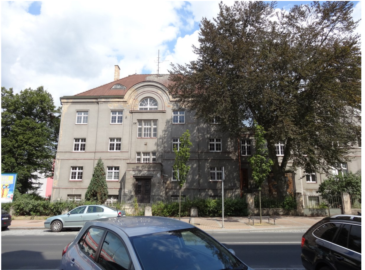
Budova bytového domu - Pohled od jihu