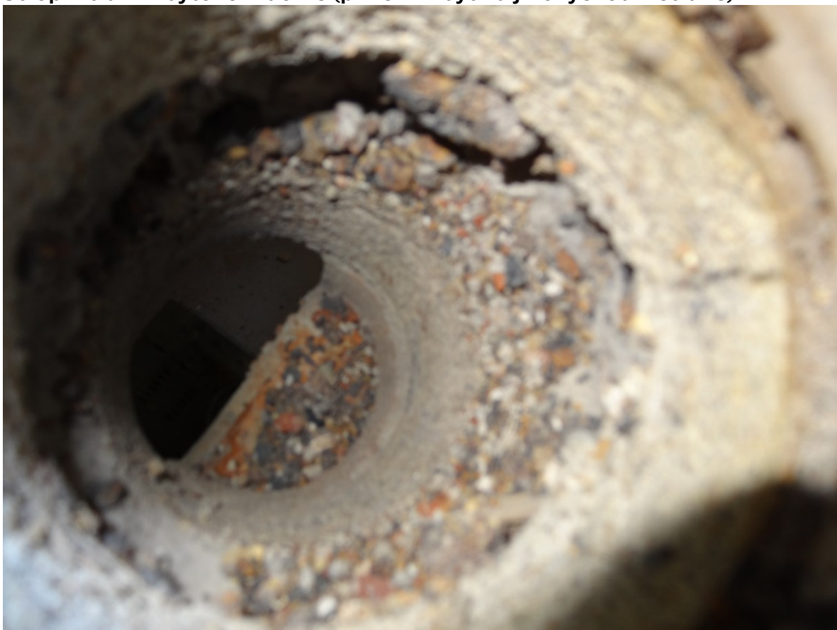
Detail otvoru po vrtané sondě v bytovém domě