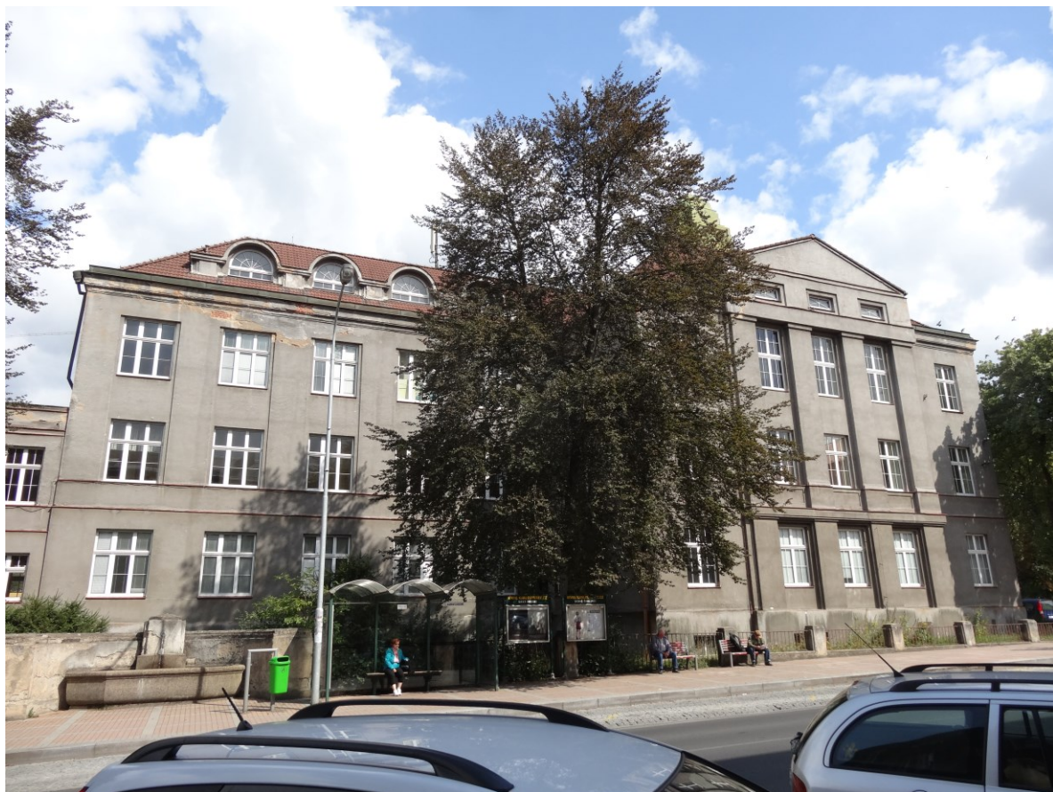
Budova školy - Pohled od jihozápadu