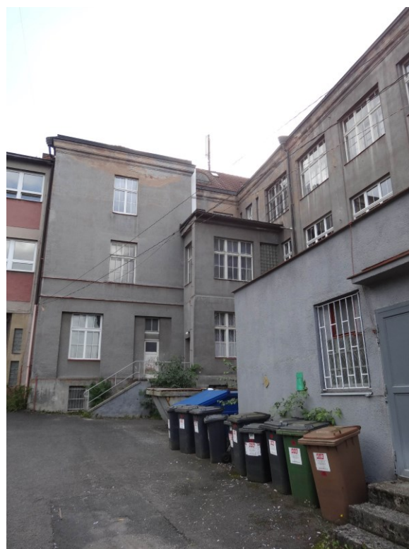
Budova školy – Pohled od severozápadu