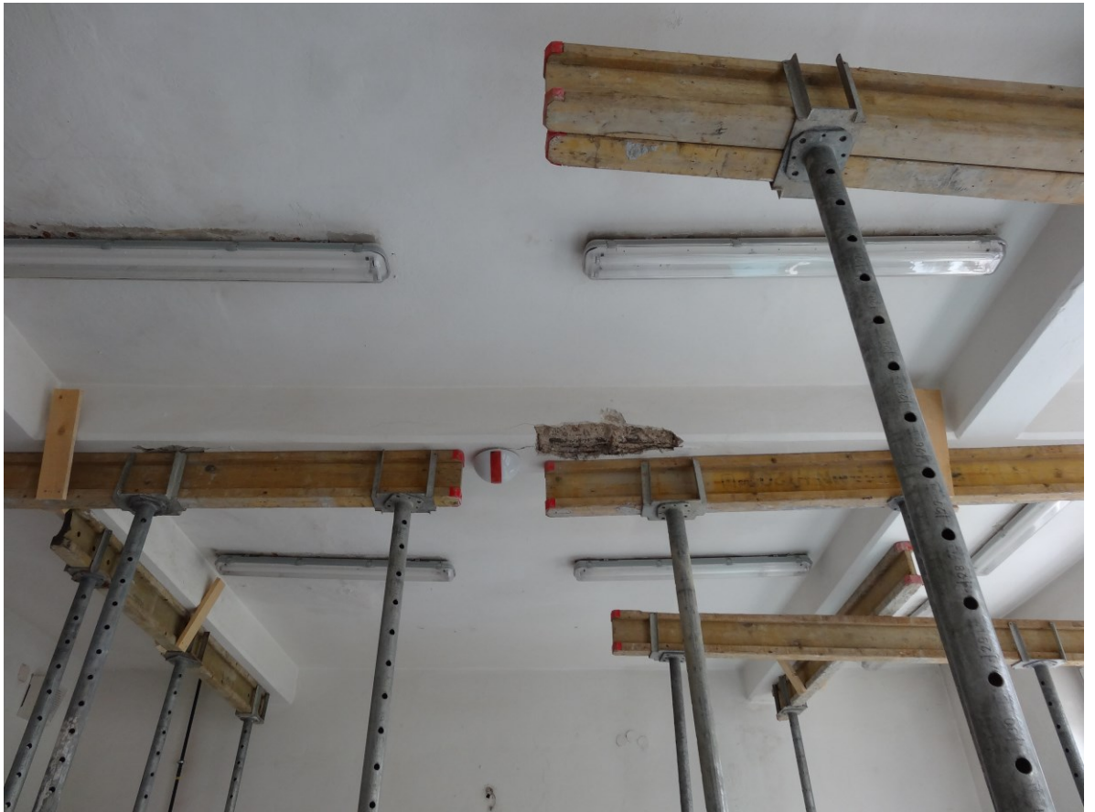
Strop učebny pod chemickou třídou