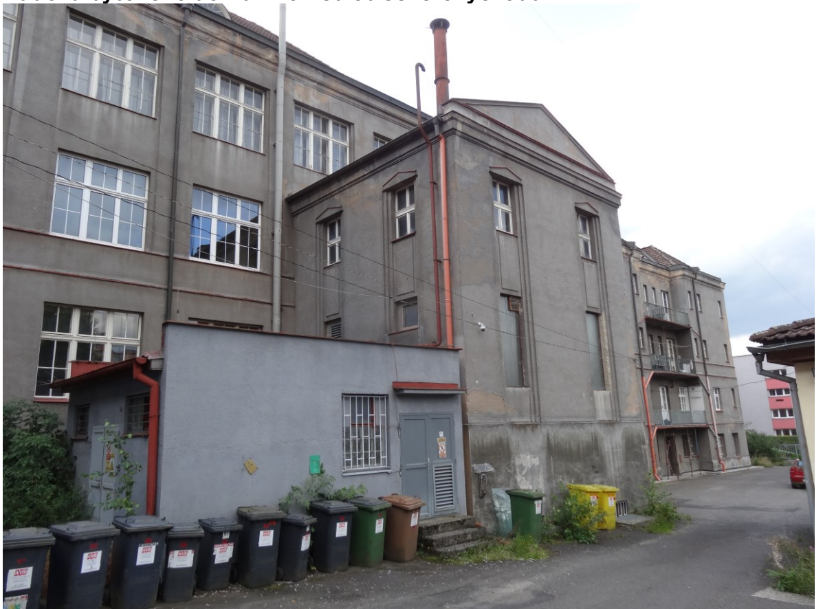
Budova školy – Pohled na dvorní přístavek od severovýchodu