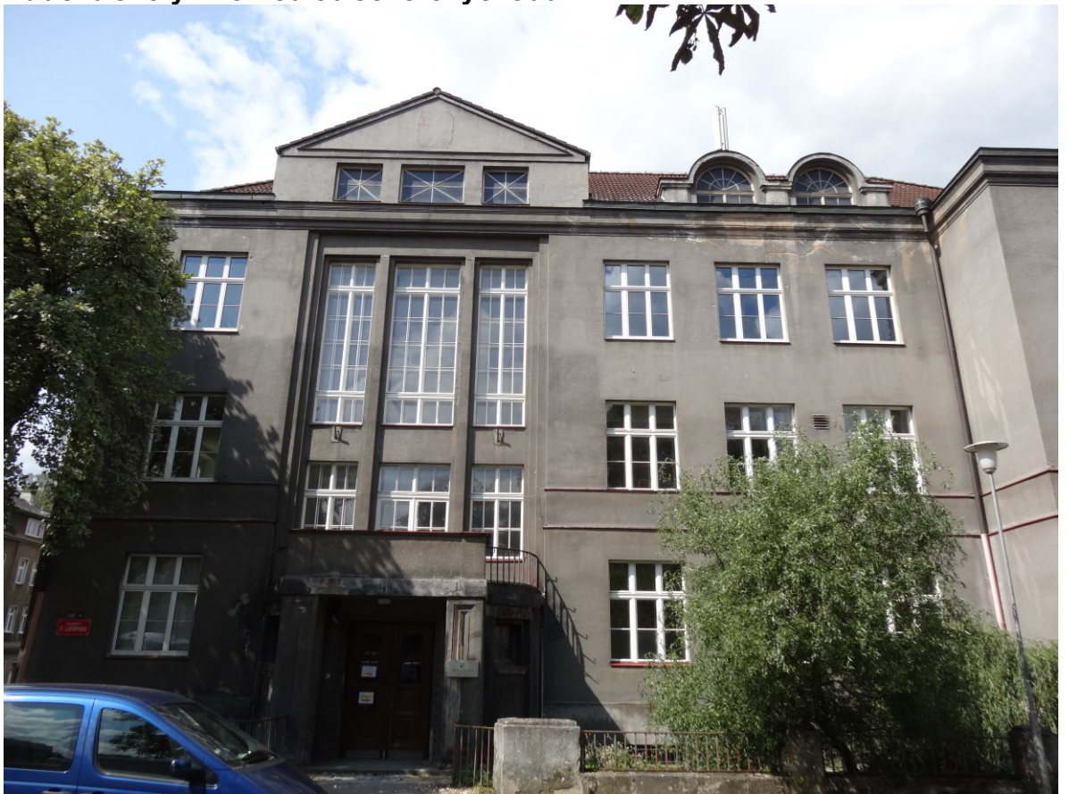
Budova školy - Pohled od východu