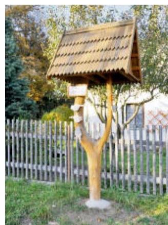
NEZVYKLÝ ukazatel směru v Kostelíku.

ze zatáček pak ale musíme odbočit na červenou turistickou značku, která nás lesem dovede až do Plas přímo k nádraží. Pokud vám zbyde čas, navštivte některou ze zdejších památek – unikátní konvent na dubových pilotech omývaných vodou, sýpku s původ-