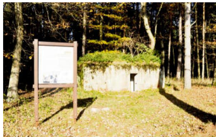
ŘOPÍK na Umíři.