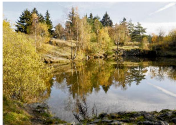
PŮVABNÉ jezírko u Krs.

Občerstvení na trase: Plzeň, Nečtiny (3 km od trasy) – Hostinec na radnici (teplá jídla), Horní Bělá – Hospoda U Šípků (teplá jídla), Plazy – Restaurant Rudolf II (teplá jídla) Cykloservisy na trase: Plzeň, další nejbližší cykloservis je 3 km od trasy v Kaznějově (Cyklo Matějček) Odkazy: http://www.plzenskonakole.cz/cz/osad-umir-1161.htm http://www.manetinskatma.cz/ Trasa: http://www.cykloserver.cz/f/b103167971/