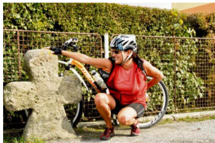
KAMENNÝ kříž v Hubenově.

ním hodinovým strojem ve věži nebo hrobku Metternichů. Už jste tam někdy byli?