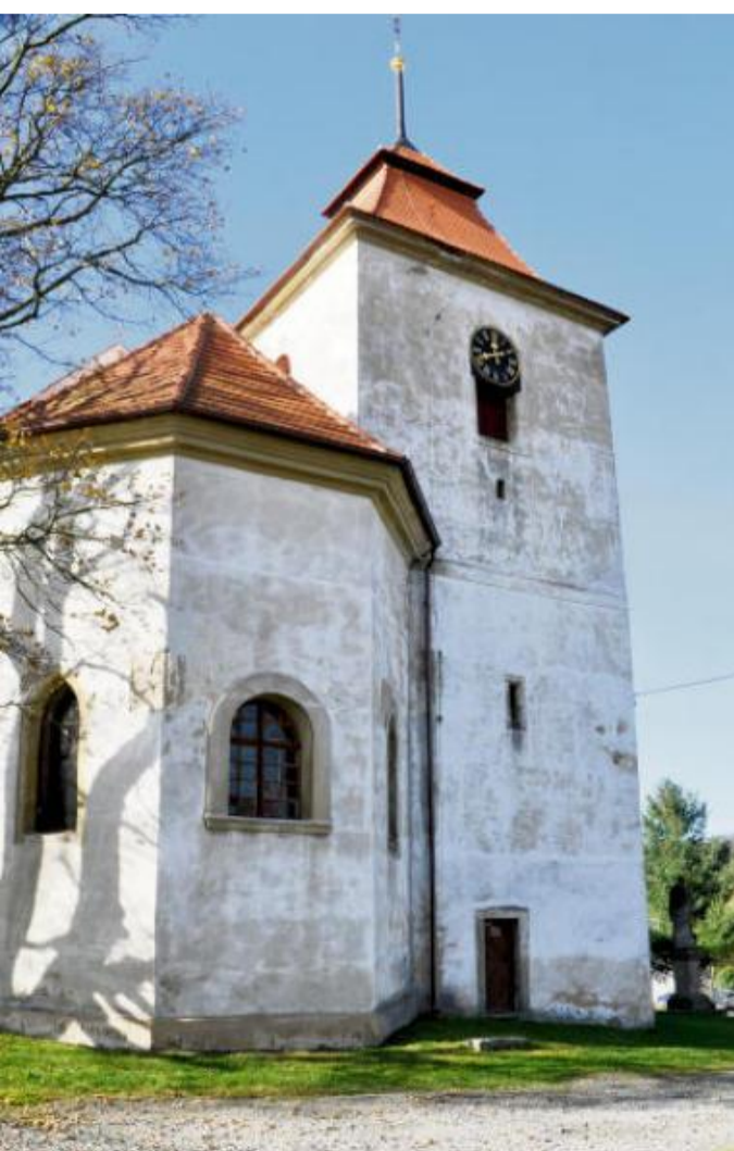
KOSTEL v Krsech.

Z hlavního nádraží projedeme kolem plzeňských rek až k zoo a odtud po silnici pokračujeme údolím řeky Mže kolem zajímavého vodou vytvářeného pískovcového útvaru, Čertovy kazatelny, až do Města Touškova. Odtud již budeme pozvolna stoupat severozápadním směrem do obce Písek. Pak, stále po silnici, mimemě Líštany, projedeme Náklov a pokračujeme směrem na Pernarec. Po přejezdu Žebrovského potoka si cestu můžeme zkrátit přes vísku Ničová pěknou polní cestou. Do Krs dojedeme po silnici přes Křelovice a Ostrov u Bezdruzic. Celou cestu se můžeme kochat vyhlídkami do krajiny, neboť v této jen řídké zalesněné části Manětínské vrchoviny se pohybujeme ve výšce 500-600 metrů nad mořem. V Krsech doporučuji zastavit u kostela.