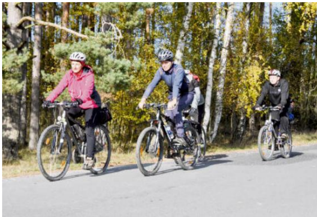
V OBLASTI Manětínska si v sedle kola užijete spoustu pěkných výhledů.