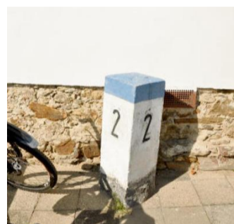
V POOTAVÍ najdete u cest ještě staré žulové patníky.

kousek od cesty Zuklínským lesem po pravé straně. Tak jeďte z kopce pomaleji, abyste vztyčený kámen mezi stromy neminuli. Jen asi 300 metrů za ním je po levé straně Královská studánka. Na této cestě ale