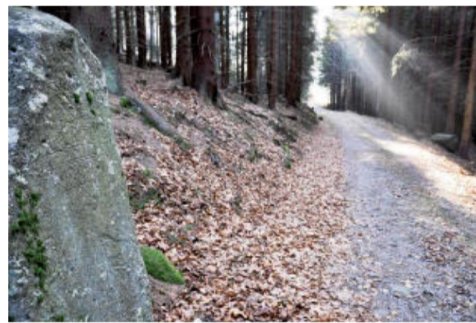
NEZVYKLE velký mezní kámen s korunkou a letopočtem 1882 najdete u cesty pod Javorníkem.

najdeme také jeden z nejzajímavějších mezních kamenů Lamberského panství. Korunka, jako znak šlechtického stavu, je tu spolu s letopočtem 1882 vytesána do obřího balvanu s hladkou rovnou stěnou zabořeného přímo na kraji cesty.