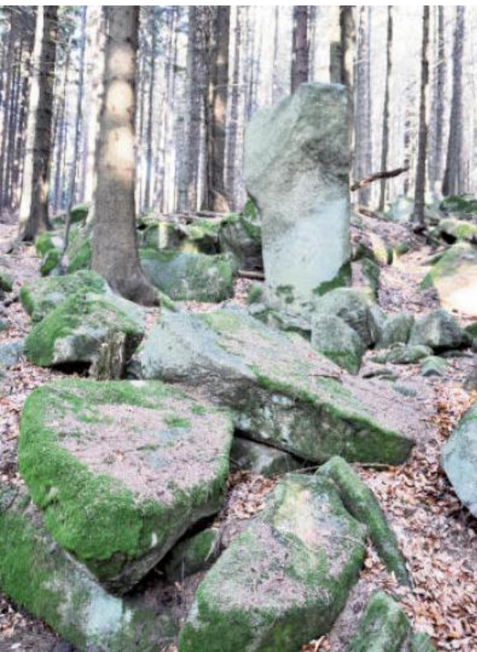
MENHIR MUDRC pod Javorníkem.