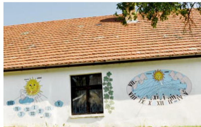
SLUNEČNÍCH HODIN tu potkáte na fasádách opravdu hodně.