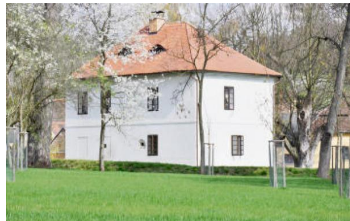
BÝVALÁ TVRZ v Kalenicích je obklopena parkem.

Trasa: http://www.cykloserver.cz/f/fe17167401/