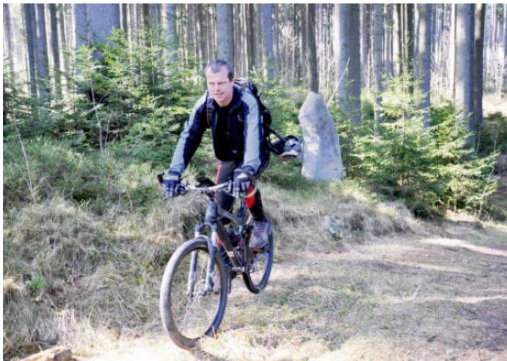
KOLEM JAVORNÍKU je hodně zajímavých kamenů – mezníky i menhiry.

Poté, co se vrátíme zpátky na silnici, pokračujeme do Strašína, odkud nás čeká stoupání k Javorníku. V jedné z ostrých zatáček u cesty jen kou-