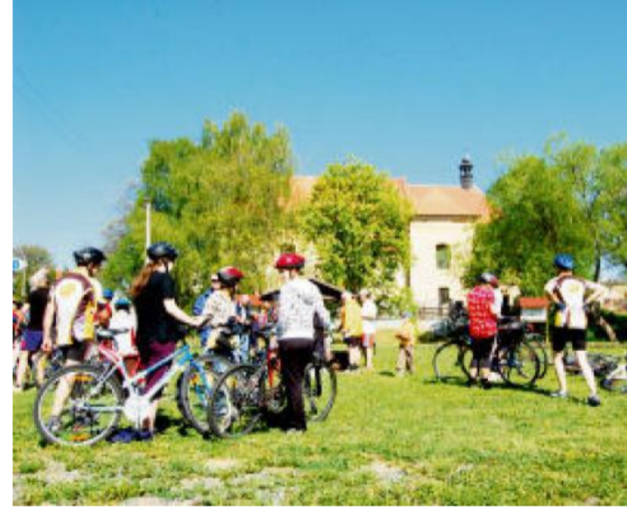
KOSTEL Nanebevzetí Panny Marie v Seči.

jet údolím řeky Úslavy po trase 31 přes Nezvěstice a Starý Plzenec. To se vám pak trasa natáhne na 58 kilometrů. Ty poslední kolem řeky Úslavy jsou ale příjemné a nečeká vás tam žádné velké stoupání. Trasa se jen „houpe“ kolem vody.