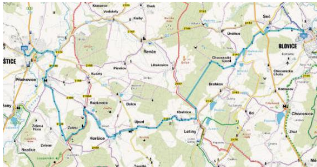
PODROBNÉ VEDENÍ linie trasy na mapě najdete na: http://www.cykloserver.cz/f/b1b9167358/