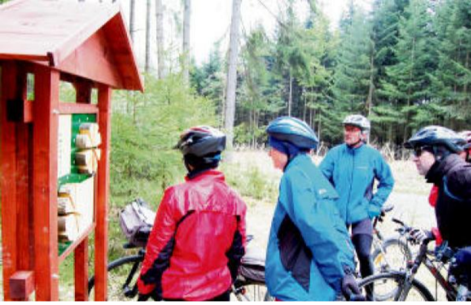
NA TRASE naučné stezky Čertovo břemeno najdeme tabuli s praktickým kvízem poznávání dřeva jednotlivých stromů.