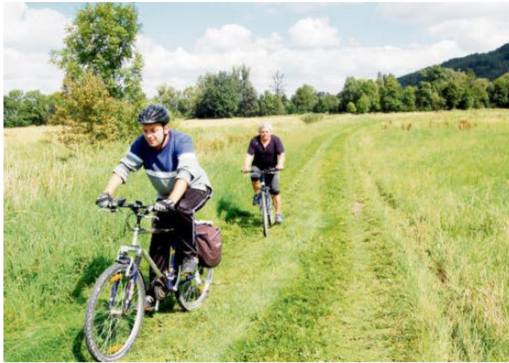
NÁŠ VÝLET začínáme v údolí řeky Úhlavy a zakončíme ho v údolí Úslavy.

Ke hradu pak musíme odbočit doleva do lesa na trase 2188A, která vede spolu s červenou turistickou značkou. Jen kousek za nejvyšším místem cesty je odbočka k hradu Skála. Na skalní ostroh se zbytky hradních zdí se ale vydejte raději bez kola. Obě části hradu – horní i dolní hrad – lze obejít, i když někdy musíte po prudším svahu. Ze samotného hradu zde zůstalo jen pár zdí, často přilepených rovnou k buližnickové skále. Teď přímo na hradě i v jeho okolí rostou stromy, ale zkuste si ho představit v době jeho vzniku,