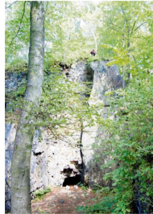
DVOJHRADÍ Skála se rozkládá na protáhlém buližnickovém suku.