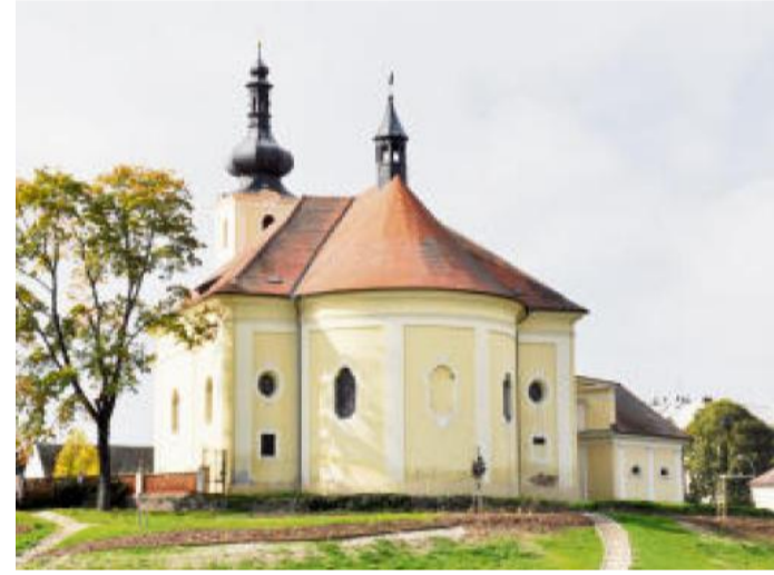
KOSTEL sv. Jana Evangelisty v Blovicích s nedávno opravenou hrobkou Kolowratů.