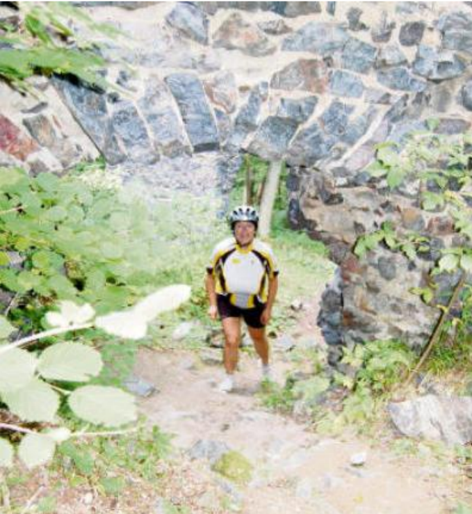
NA CELÉM dvojhradí Skála najdete už jen jediný zchovalý kamenný portál.