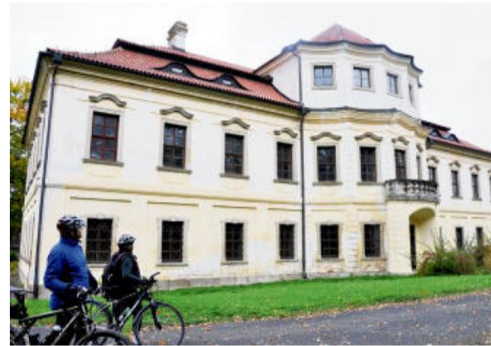
ZÁMEK v Příchovicích s trochu nezvyklým členěním fasády.

Občerstvení na trase: Přeštic (Lidový dům), Letiny (minipivovar), Blovice (na nádraží) Cykloservisy na trase: Blovice, Přeštic Odkazy: http://hrady.dejiny.cz/slovník/g.htm http://www.pivovarletiny.cz/ http://www.plzenskonakole.cz/cz/naučne-stezky-243 http://www.prichovice.cz/informace-o-obci/zajímavosti-z-obce/prichovicky-zamek/ Trasa: http://www.cykloserver.cz/f/b1b9167358/