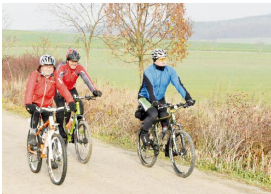
MEZI RAKOVOU a Veselou nad Mirošovem s vyhlídkou pojedeme k rozhledně na Kotle.

Na křižovatce za Mokroušemi se vydáme rovně po lesní cestě, která nás dovede až na konec lesa nad Rakovou do místa, kde stávala bývalá rakovská hájovna. Pokud by se vám nechtělo jet lesní cestou nebo bylo zrovna po pořádném dešti, můžete do Rakové dojet po silnici přes Němčičky. Celá oblast kolem Rakové je v nadmořské výšce kolem 500 metrů, a tak se i v době podzimních mlh, či dokonce zimní inverze můžeme dostat do míst, kde se lépe dýchá. Z Rakové pokračujeme kolem hřbíště do Nevida a na Kamínky. I tuto spojku lze objet za špatného počasí po silnici. Z Kamínků nás čeká pěkný sjezd po cyklotrase 2154 do Mirošova. Tady se můžeme zastavit na občerstvení či na oběd. Dát si něco na posilněnou je na místě, protože nás čeká cesta do kopce do Skořice. Malebná víska na kraji Vojenského výcvikového prostoru Brdy je opět výše položená. Nás ale nečeká celý skořický kopec, ale jen jeho část vedoucí k odbočce do Trokavce. Asfaltová komunikace nás provede okrajovou částí Vojenského vý-