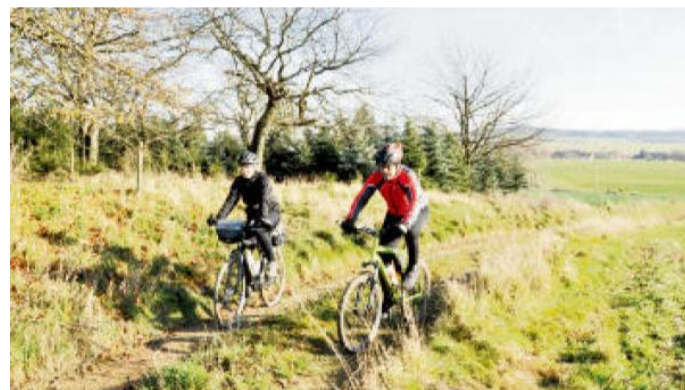
CESTA k Homberku.

kdy na stromech teprve raší listy a kvete bylinné patro pod nimi. Z rozcestí Hádky pokračujeme pěknou zpevněnou lesní cestou po trase 2154 až nad Kozel. Po cestě ale nezapomeňte zastavit u Neslív-