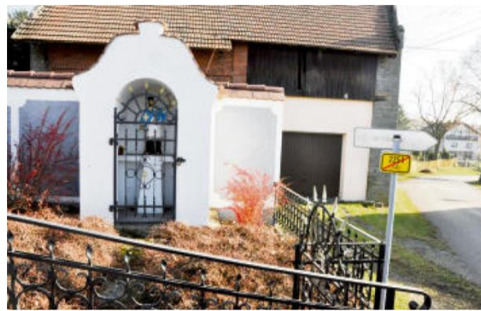
SVATÝ Jan Nepomucký, patron poutníků, na rozcestí ve Skořicích.

Trasa výletu vede částečně po turistických trasách a naučné stezce. Dbejme tu pozornosti, zejména při sjezdech. Pěší turisty nesmíme na kole ohrozit!