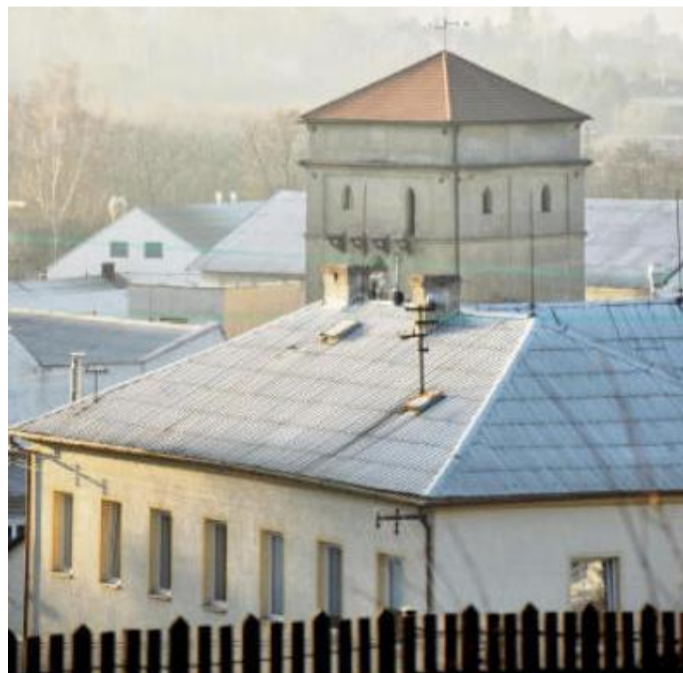
KYCHTA výšové pece v Sedlci je technickou památkou.

Již téměř za Kornaticemi odbočíme doprava do Kozelského polesí k hájovně Hádky. Ještě než k ní dojedeme, budeme mít po pravé straně v lese území, kde se nacházelo mohylové pohřebiště. V čerstvě napadaném listí bývá tvar mohyl, které tu byly objeveny, lépe zřetelný. Hned vedle mohylového pohřebiště je přírodní památka Zvoníčkovna se zajímavou květenou. Ta láká k návštěvě spíš časně zjara,