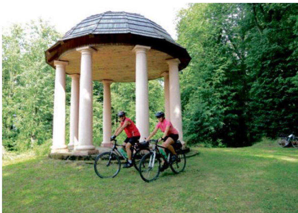
GLORIET na Františku u Žinkov.

Pokračujeme po cyklotrase do obce Kuciny a tam se napojíme na cyklotrasu číslo 2188A. Napřed vede trasa po místní silničce s asfaltovým povrchem do Radkovic, později přejde do lesa a tam po lesní cestě a mírném stoupání dojedeme k turistickému ukazateli: Skála – zřícenina. Zde do-