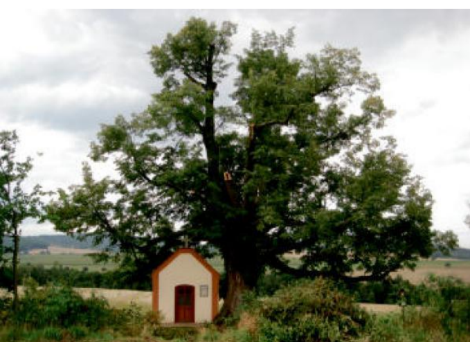
KAPLIČKA pod Ticholovcem.