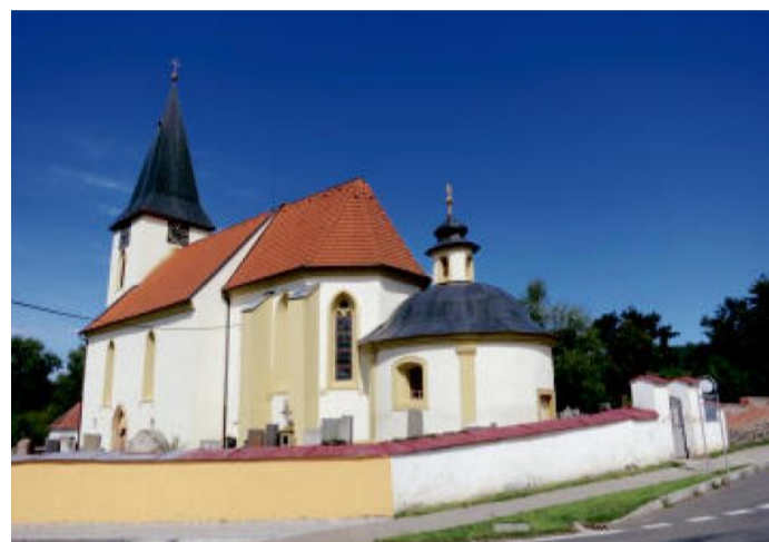
HORŠICE – kostel sv. Matěje.

Občerstvení na trase: Žinkovy – restaurace Zlatý jelen; Autokemp Nový rybník Nepomuk – mezi Žinkovy a Nepomukem Odkazy: http://www.rozhlednovymrajem.cz/kozich/ Trasa: http://www.cykloserver.cz/f/8c7f163445/ Trasa výletu vede částečně po turistických trasách bez značení cyklotrasy. Dbejte tu pozornosti, zejména při sjezdech. Pěší turisty nesmíme na kole ohrozit!