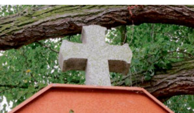
KAPLIČKA pod Ticholovcem.