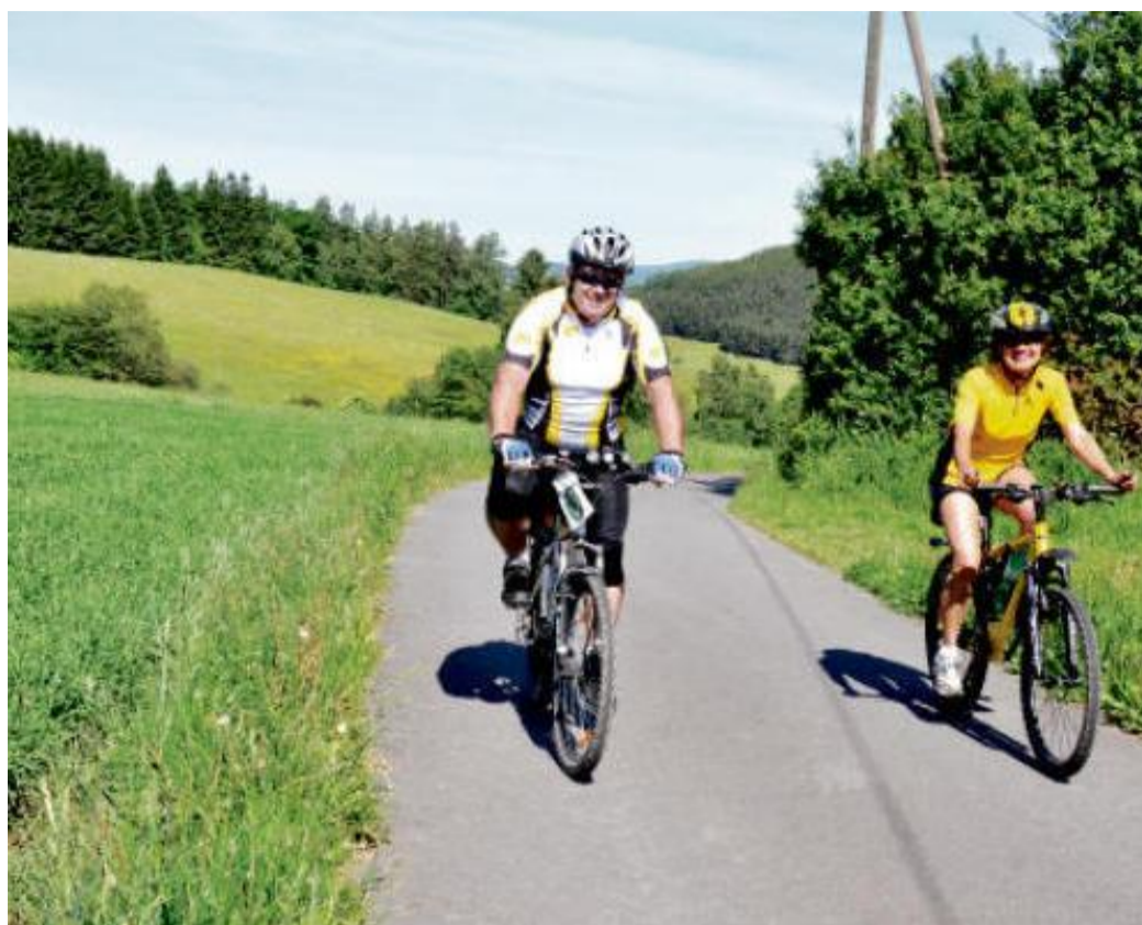
ÚZKÁ SILNIČKA po cyklotrase 2038 do Javoříčka je pro cyklisty jako dělaná.