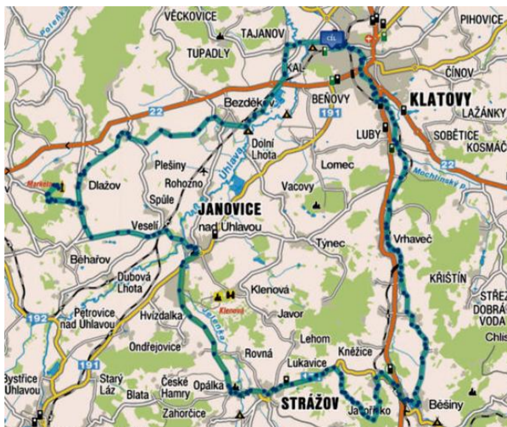
PODROBNÉ VEDENÍ linie trasy na mapě najdete na: http://www.cykloserver.cz/f/e637162989/

hledy jak do vnitrozemí směrem ke Klatovům, tak směrem na Šumavu. Panorámat, která lákají k fotografování, mnohde dokreslují stáda krav. Ale to už začínáme postupně sjíždět do Běšin. Trasa se tu trochu složitě vyvíjí hlavní komunikací, po které auta jezdívají nebezpečně rychle. Kousek od Klatov se napojíme na cyklotrasu číslo 38, která nás po stezce dovede údolím podél Drnového potoka přes Vrhavěc a Luby až do