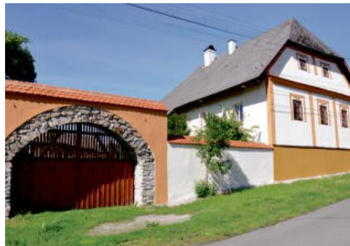
NOVĚ OPRAVENÝ statek ve Strážově.

Občerstvení na trase Janovice nad Úhlavou, Strážov, Běšiny (Eurokemp), Klatovy Cykloservisy na trase: Klatovy Odkazy: http://www.sumavanet.cz/fr.asp?tab=snet&id=8503&burl – Speissová naučná stezka http://www.plzenskonakole.cz/cz/rozhledna-na-sv-markete-1082.htm – o rozhledně nad Dlačovem Trasa: http://www.cykloserver.cz/f/e637162989/ Trasa výletu vede částečně po turistických trasách a naučné stezce. Dbejte tu pozornosti, zejména při sjezdech. Pěší turisty nesmíme na kole ohrozit!