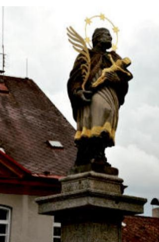
SV. JAN NEPOMUCKÝ na náměstí ve Strážově.

Více než o sto metrů výše, než je vrch Hrádek, na kterém dřívě stával přímo na skále hrad, ovšem o několik kilometrů dále, byla postavena v loňském roce nová rozhledna.