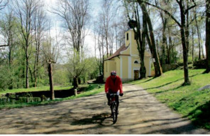
KAPLE na návsi v Kořenu.