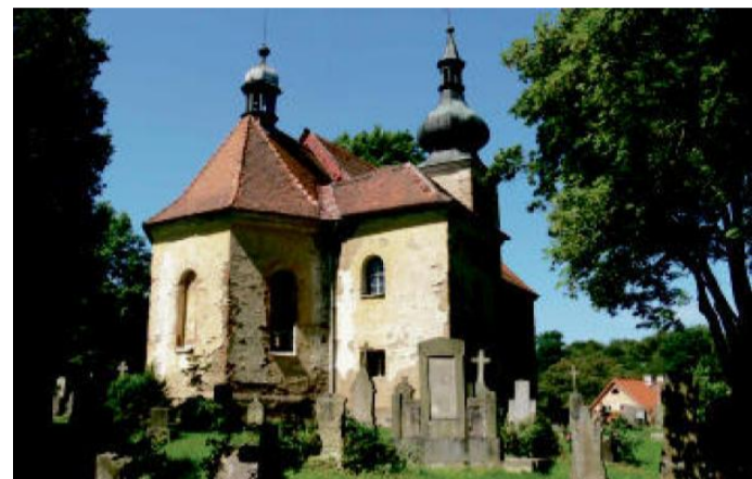
KOSTEL v Michalových Horách.