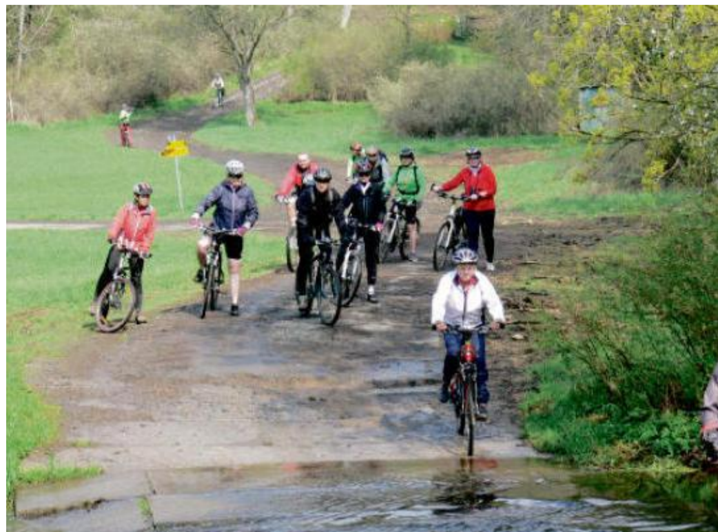
BROD u soutoku Jilmového a Kosího potoka.

V první polovině století našeho letopočtu zde vznikla osada zvaná Poříčí. Stála ně-