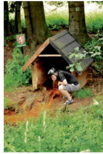
PRAMEN u Kosího potoka.

Cyklotrasy číslo 2206 se budeme držet až do cílových Konstantinových Lázní, kam pojedeme přes Zádub a Kokašice. Před Kokašicemi překonáme u Balcarova mlýna údolí potoka Hadovky. Komu ještě zbyde dost síl, může vyjet na zdáli viditelný vrch Krasíkov, který tvoří dominantu celého Konstantinolázeňska. K návratu využijeme motoráček bezdružické lokálky.