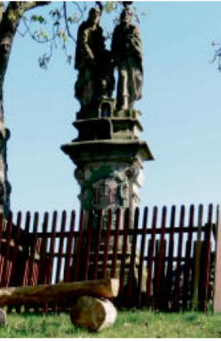
SOCHA sv. trojice v Olbramově.

Příští pátek: Za „Panenkou Skákavou“ v poutním kostele u obce Skoky