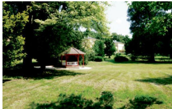
ZÁMECKÝ park Lázeň.

Trasa výletu vede částečně po turistických trasách bez značení cyklotrasy. Dbejte tu pozornosti, zejména při sjezdech. Pěší turisté nesmíme na kole ohrozit!