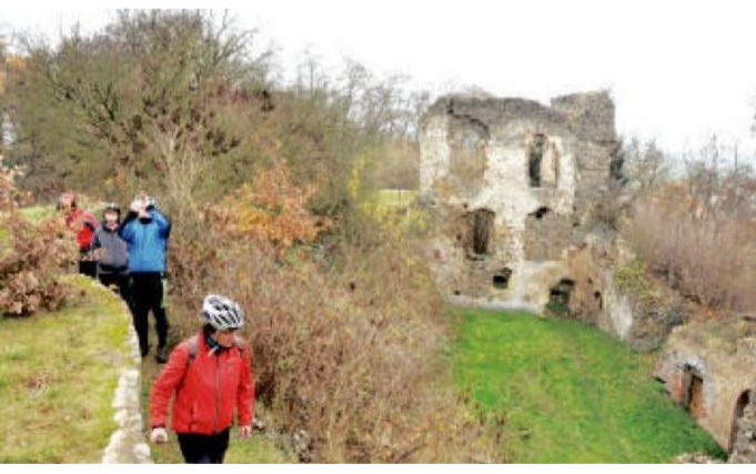
ZŘÍCENINA hradu Roupov.