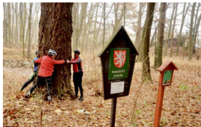
DOUGLASKA v arboretu v Újezdci.