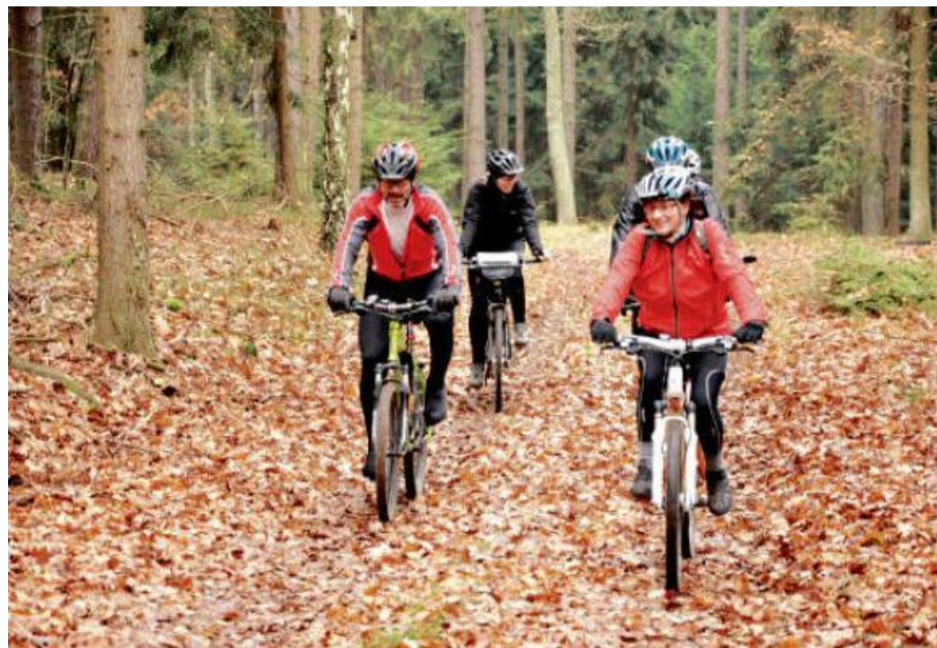
V LISTNATÝCH lesích se příjemně jede po měkkém podkladu z vrstev spadaneho listí.

Výlet začneme ve Švihově na nádraží, kam se pohodlně dostanete vlakem. Jízda s kolem některými rychlíky na trati z Plzně do Klatov ale vyžaduje povinnou rezervaci na kola, tak na to včas pamatujte. Z nádraží sjedeme k nejbližší odbočce do města. Pokud jste ještě nebyli na hradě, určitě si jej aspoň objedte – fotogenický je skoro ze všech stran, zvláště přes vodní příkop. Pak se vydáme přes Lhovice a Vřeskovice do Roupova. Zřícenina zdejšího hradu se zachovalým hradním příkopem umožňuje vylézt do výše bývalého horního podlaží, nebo si prohlédnout zbytky černé kuchyně. Nezvyklý komín pak uvidíte zblízka nejen zespoda, ale také z horního „patra“ zříceniny. Právě z něj uvidíte také vzrostlý tis červený, který je již několik let chráněn jako památný strom. Přímou proti příjezdové cestě k hradu stojí kaple sv. Anny. Pokud v době jejího vzniku nebyly v okolí