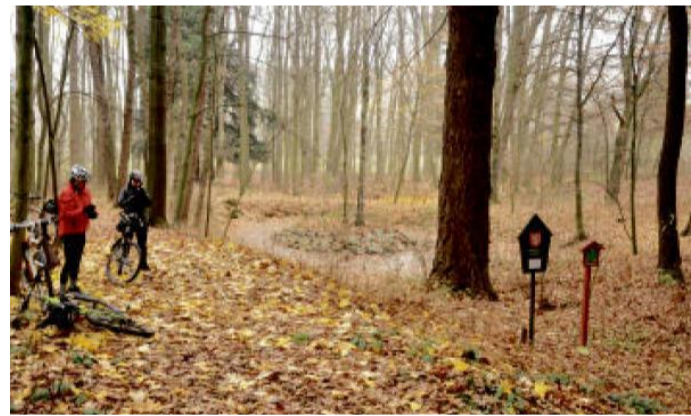
LESNÍ jezírko v arboretu v Újezdci.