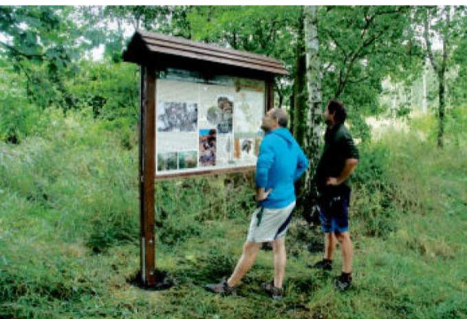
VĚTŠINU zajímavých míst souvisejících s těžbou představuje na osmi panelech nová naučná stezka Po stopách důlní činnosti na Brásku, která se otevírá tuto neděli.