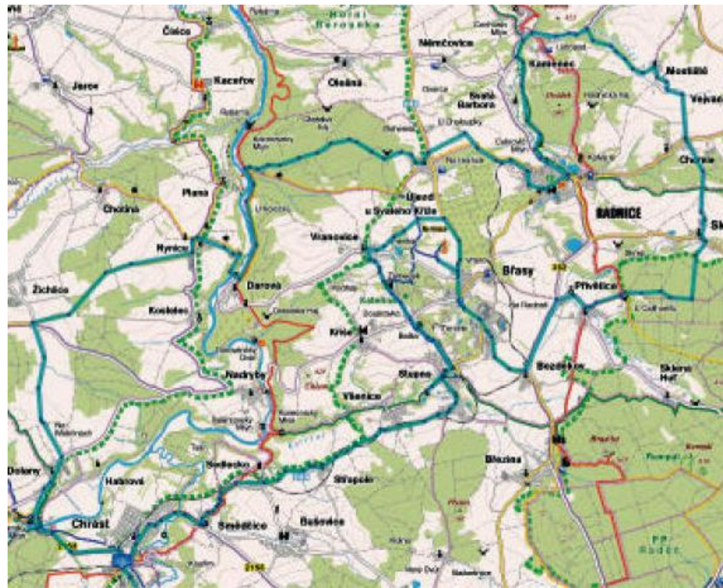
PODROBNÉ VEDENÍ linie trasy na mapě najdete na: http://www.cykloserver.cz/f/376f158248/