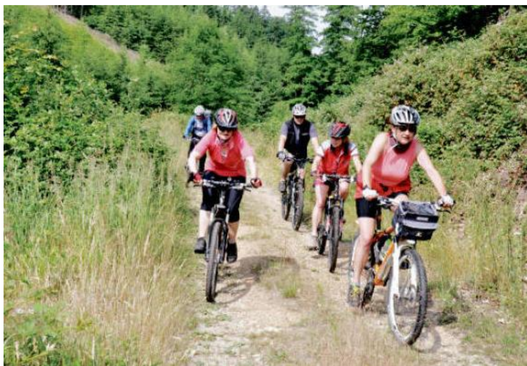
CESTY z údolí Berounky bývají často strmé, ta do Újezda Sv. Kříže stoupá pozvolna.

Náš výlet začneme na nádraží v Chrástu. Odtud se přes Dolanský most vydáme k darovanskému přívozu. Od počátku roku tu krom pondělků a úterků převládá auta, pěší i cyklisty převáží a někdy i převoznice pomocí motorem poháněného zařízení, které už nyní patří do kategorie technických památek. Hned za přívozem se dáme vlevo po červené turistické značce. Jen asi 300 metrů od rozcestí narazíme na první stopu zdejší těžby – odvodňovací darovanskou štolu. Jindy železnicí vodou zalitá vstupní chodba je ale letos skoro suchá. Jen skrz mříž je v dáli vidět pramen, který jí protéká. Z tabulky nad vchodem, kde jsou zkráceně hornická kladivka topůrkou nahoru, zjistíme, že těžba tu skončila v roce 1937. Cesta podél Berounky je spíše pro horská kola, některé úseky vedou po kamenech či vyjeté cestě. Právě za ní se nám naskytne krásný pohled na strmou skálu pod Planou na protějším břehu Berounky. Odtud nás pěšina zavede podél řeky až k rozcestí, kde se do ní vlevá jeden z přítoků – potok Velká Radná. Cesta podél něj vzhůru do Újezdu u Sv. Kříže je ve srovnání s ostatními pozvolná a vyšlápne ji snad každý. Někteří si ale u zlatonosného potoka udělají zastávku, aby zkusili štěstí a našli alespoň jednu zlatinku. Přes Újezd u Sv. Kříže dojedeme do Radnic. V parných