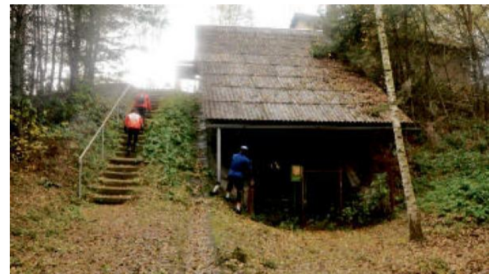
PŘÍRODNÍ památka Bašta, kde je vidět černé uhlí Bráské pánve prokládané světlými propláskky. Proto takovému uhlí horníci říkali „kanafas“.