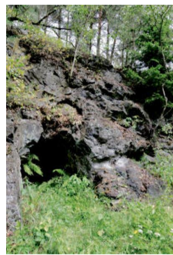
ŠTOLA nad Kamencem.

Ve Stupně nezapomeňte zajet ke hrobce Šternberků, ma-