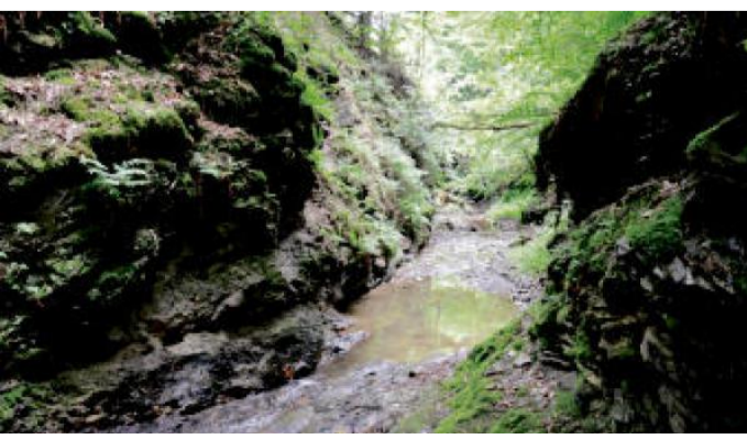
VŠENICKÉ jeskyně u Korečného potoka.