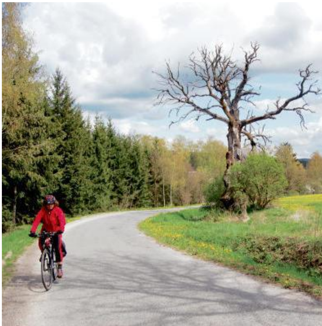
DRUHÝ LOMANSKÝ asi 500 let starý dub uschnul v roce 2003.

Oba Lomanské duby, ten starší asi sedmisetletý, i ten mladší asi pětisetletý rostou u silnice. Ten první, Žižkův, u silnice do Draženě, ten druhý u silnice do Lomničky. Ten starší, kolem kterého prý prošel Jan Žižka se svým vojskem, má obvod kmene skoro osm metrů, tak, pokud vás bude dost, můžete zkusit strom obejmout. V Lomanech najdete v bývalé hájence Muzeu těžby borové smoly. Info-