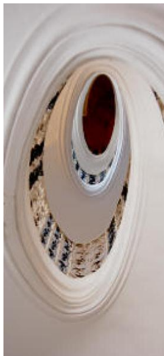
OVÁLNÉ schodiště v konventu.