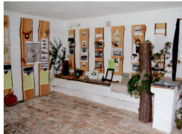
MUZEUM těžby borové smoly ukazuje, jak sběr smůly probíhal.

Trasa výletu vede částečně po turistických trasách bez značení cyklotrasy. Dbejte tu pozornosti, zejména při sjezdech. Pěší turisty nesmíme na kole ohrozit!