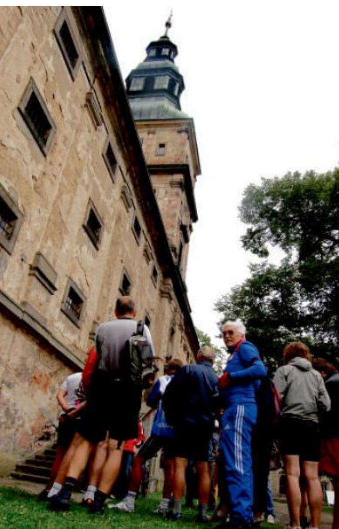
SÝPKA se starým hodinovým strojem ve věži.