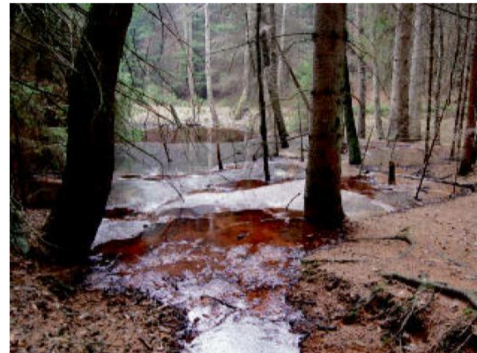
MALENOVICKÝ pramen – přírodní památka u Loman.

jedinečnou památkou a to nejen díky svým základům, ale i budově nad nimi. Oválné schodiště, křížová chodba i další prostory sem lákají turisty nejen domácí, ale i zahraniční. Za návštěvu stojí i Metternichova hrobka nebo několikapatrová sýpka s hodinovým strojem ve věži. Na prohlídku Plas si nechte dost času – určitě toho nebudete litovat. Areál kláštera byl totiž vážným kandidátem do seznamu památek UNESCO. Pokud pojedete z Plas vlakem, nezapomeňte, že na nádraží je to trochu do kopce a po dobrém obědě se do kopce člověku většinou moc nechce.