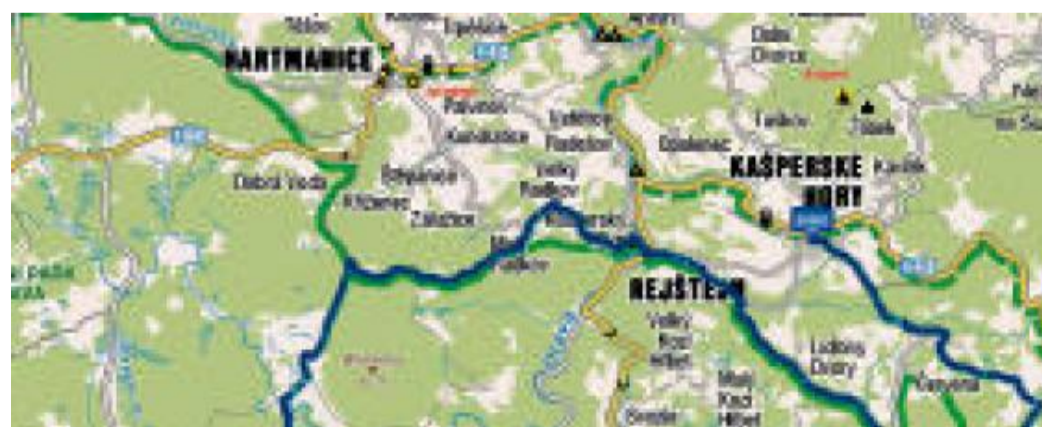
PODROBNÉ VEDENÍ linie trasy na mapě najdete na: http://www.cykloserver.cz/f/8d95153927/