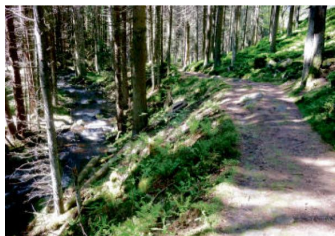
CESTA podél potoka Losenice.

Občerstvení: Popelná, Rejštejn, Prášily, Srní Cykloservis: Nejsou, v případě technických problémů si musíme umět poradit sami. Odkazy: Šumava a Keltové http://www.sumavainfo.cz/Keltove http://www.npsumava.cz/cz/1129/678/clanek/keltove/ http://www.sumavanet.cz/modrava/fr.asp?tab=snet&id=193&url=Archeopark Prášily http://www.archeoparkprasily.cz/ Cyklobus Šumava, žlutá linka 433570 http://www.csadplzen.cz/mainindex/43357001.htm Trasa cyklovýletu: http://www.cykloserver.cz/f/8d95153927/ Upozornění: Trasa výletu vede částečně po turistických trasách bez značení cyklotrasy. Dbejte tu pozornosti, zejména pokud budeme sjíždět z Obřího hradu. Pěší turisté tu mají přednost a na kole je nesmíme ohrozit!