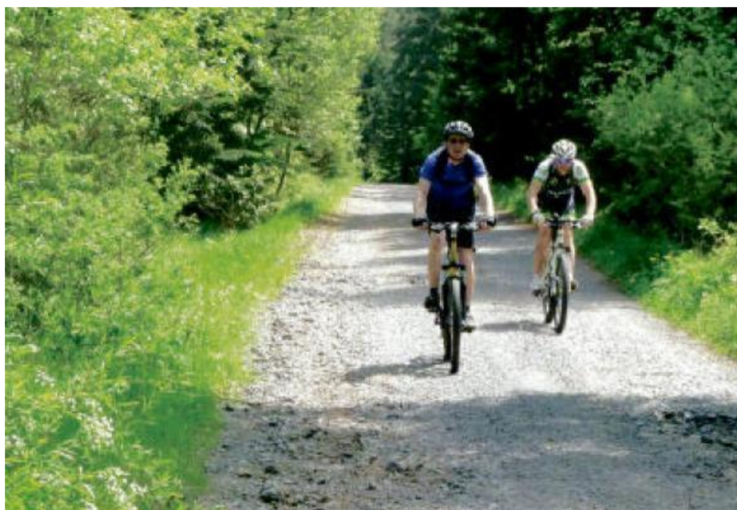
POHODOVÝ SJEZD k rozcestí u Malého Babylonu.

Okolí městečka Kašperské Hory je známé především svou zlatokopeckou historií. Již méně tím, že na místě bývalého městského koupaliště byly nalezeny zlomky laténské keramiky a další (blíže neověřitelný) nález zlatých keltských mincí byl z luk mezi Kašperskými Horami a Řetenicemi. Z náměstí projedeme kolem Muzea Šumavy po cyklotrase 1201 společně s modrou turistickou značkou a vzápětí začneme zdolávat první výškové metry až k rozcestníku Pod Milovským vrchem. Od něj se napojíme na žlutou značku a po 2,5 kilometru přijedeme do osady Popelná. Zde začíná naučná stezka, která věnuje tři zastavení Keltům na Šumavě. Po jednom kilometru nás dovede k Obřímu hradu. Cesta je však velmi strmá a na konci i kamenitá a své kolo tu budeme spíše tlačit. Po jeho návštěvě se vrátíme do osady Popelná a pokračujeme po červené turistické značce při dravé říčce Losenice. Ta vytváří jedinečnou atmosféru, přímo nad ní ve svahu budeme míjet kamenná moře. Cesta je na kole díky velkým kamenům obtížně sjízdná a zvládnou ji jen ostřílení bikeři. Ten, kdo se na tento terén nebude cítit, udělá lépe, když své kolo chvíli povede. Odměnou za takto vynaložené úsilí