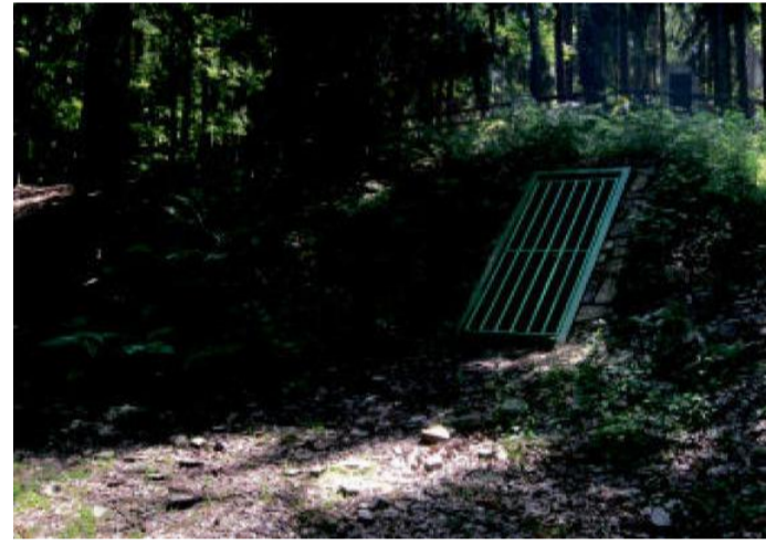
PARTYZÁNSKÝ BUNKR v lese nad Kařízkem.