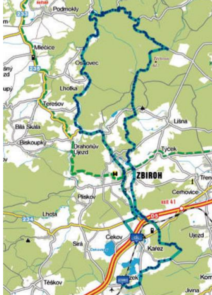
PODROBNÉ VEDENÍ linie trasy na mapě najdete na: http://www.cykloserver.cz/f/1446153134/

Cestu podbrdských partyzánů zahájíme u Podmokelského mlýnu po modré značce ve směru na Zbiroh, kde hned po několika metrech narazíme na sirný pramen, který vyvěrá s převelkým zápachem pod kořeny mohutného starého smr-