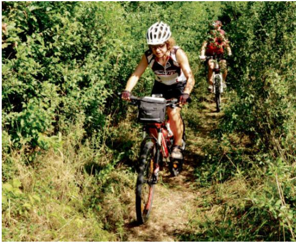
VÝLET VEDE po polních cestách i po zarostlých pěšinách.

Cesta je v těchto místech náročnější, a někdy je lepší i sesednout. Postupně sjíždíme k bývalé státní silnici Praha – Plzeň, kterou v místě známém jako Tři sudy překročíme, a pokračujeme stále rovně směrem na Zbiroh. Přejedeme přes nově postavený most přes železniční trať a těsně za ním odbočíme doprava. Mineme Dvorský a Čápský rybník. Po modré značení se dostaneme do