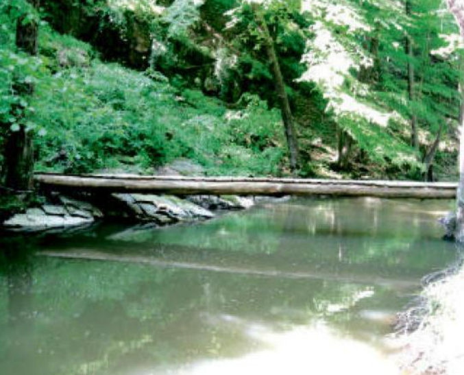
LÁVKA přes Zbirožský potok.