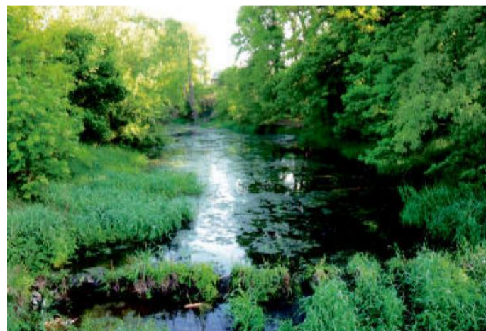
MEANDR kvetoucí řeky Ohře.