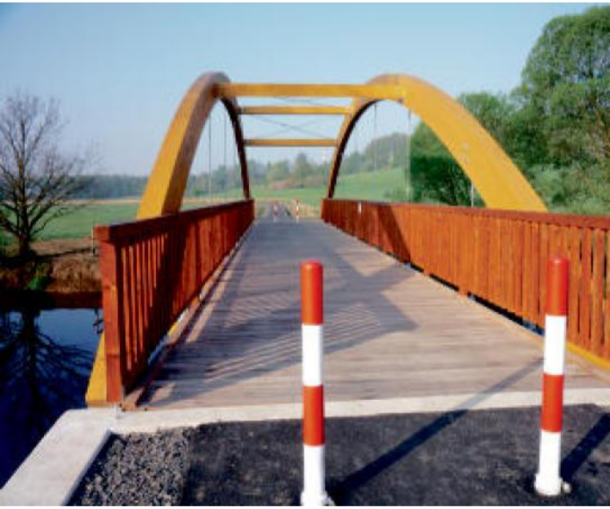
MOST přes Ohři na novém úseku u Chebu.