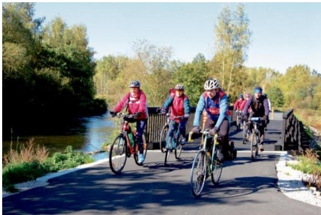
SKORO SAMÁ ROVINA, jen občas malé stoupání – to láká k Ohři většinu cyklistů, včetně těch dálkových.

V okolí elektrárny Tisová byl proveden největší zásah toku Ohře. Uvidíme tu násilně zregulovanou řeku v úzkém korytu kvůli stavbě tepelné elektrárny. Bývalá obec Tisová podlehlá potřebám energie-