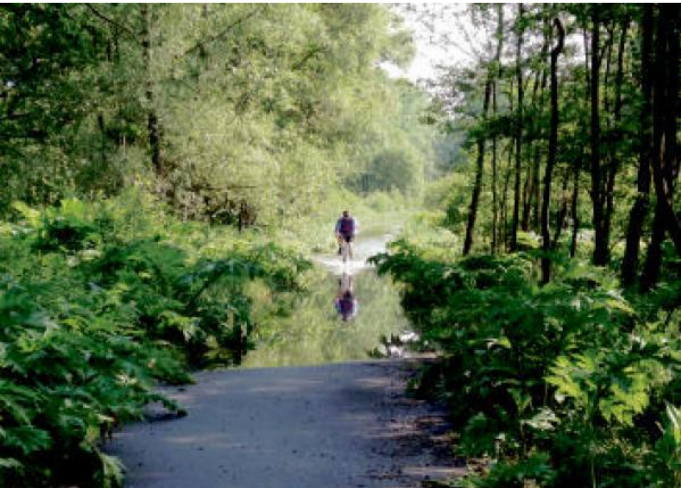
KDYŽ SE Ohře rozběsí.