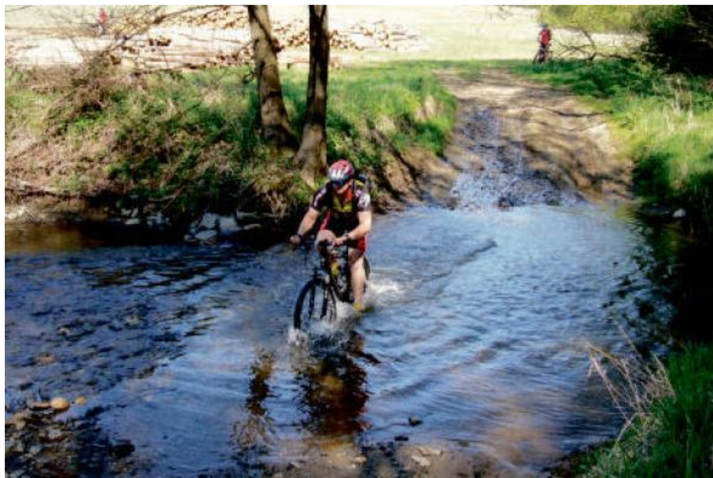
BROD přes Úterský potok.

K návštěvě Šipína se nabízí dvě trasy různé délky a obtížnosti. Jsou vedeny tak, aby návštěvníky zavedly do nejpůvabnějších míst. Východním směrem jsou Bezručice nebo Konstantinovy Lázně, kde obě trasy i končí. Z Plzně se sem dá dojet motoráčkem bezručické lokálky. Návštěvníci z Karlovarského kraje se na Konstantinovy Lázně dostanou z nádraží v Teplé po cyklotrase 306.