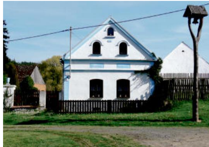
V MYDLOVARECH na návsi.

KRATŠÍ TRASA: http://www.cykloserver.cz/f/0901151594/