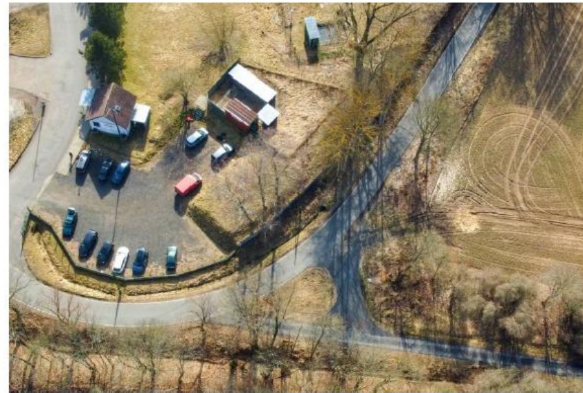
Sektory L, F