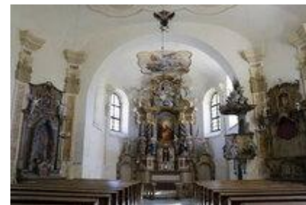
oprava kostela sv. Anny na Božím Daru