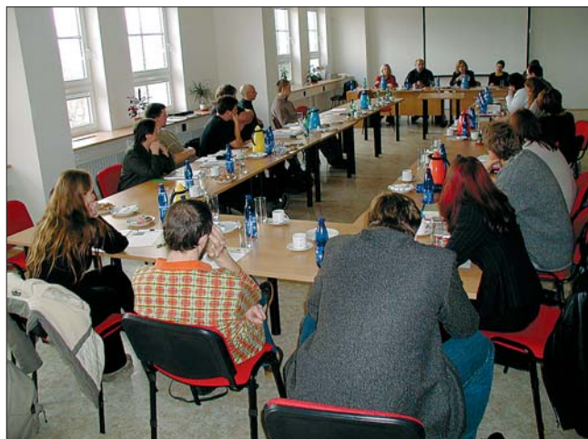
Seminář s názvem Význam regionů v zajištění kvality služeb pro uživatele drog se uskutečnil koncem listopadu na půdě krajského úřadu. Neziskové organizace z Karlovarského a Ústeckého kraje se na něm zabývaly protidrogovou problematikou. Setkání zorganizovala Rada vlády pro koordinaci protidrogové politiky.