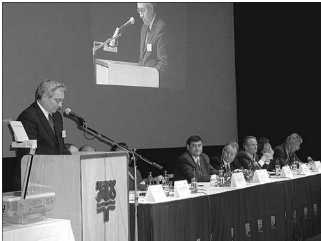
Otázky pracovních příležitostí a možnosti vzdělávání v příhraničních regionech celé Evropy byly ústředním tématem mezinárodní konference, která se v posledním listopadovém týdnu uskutečnila v Karlových Varech. Výroční konference Asociace evropských příhraničních regionů (AGEG) se poprvé od vzniku organizace konala za bývalou železnou oponou. Při hejtmánově projevu se z řad zahraničních účastníků ozývaly projevy souhlasu.

Dány a pánové, dovolím mi, abych Vás pozdravil jménem svým i jménem Karlovarského kraje zde, v Karlových Varech, sídelním městě našeho regionu.