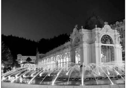
Zpívající fontána vědují mariánskolázeňské kolonádě.

Stejně jako jiná města se i Mariánské Lázně potýkají s problematickou klesající počtu dětí a s tím spojeného slučování, případně i rušení základních škol.