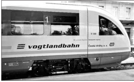
Tyto moderní vlakové soupravy DESIRO by měly jezdit na jedenácti tratích v Karlovarském kraji. Na jejich pořízení a provoz ale zatím nejsou peníze.

„My se snažíme udělat něco pro to, aby naši občané měli zájem o železniční dopravu. Obrovské finanční bariéry, které zrealizování projektu zatím brání, ale kraj zvládnout nemůže. Už nyní platíme jako zákonem stanovené objednavatelé veřejné služby v rámci