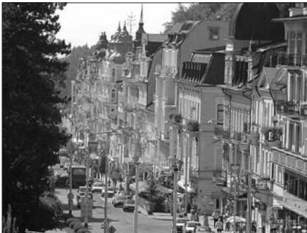
Takhle vypadá centrum Mariánských Lázní z ptáčí perspektivy.

Poměrně mladé lázeňské město vzniklo počátkem 19. století v údolí, v němž vyvěrá mnoho výborných léčivých pramenů, známých místním usedlíkům již od 13. století.