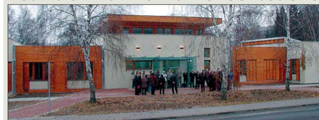
Ředitelství silnic a dálnic (ŘSD) se v Karlových Varech přestěhovalo do nového. Slavnostní otevření nového sídla pobočky v Karlových Varech - Dvorech v areálu hejtmánství se uskutečnilo 2. prosince. Výstavba administrativní budovy, v níž bude pracovat celkem 26 úředníků, vyšla na zhruba 29 milionů korun.