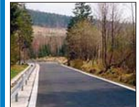
Tématem tohoto vydání bude opět problematika dopravy a zdravotnictví. STRANA 3 A 7