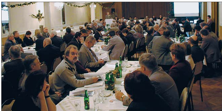
Velikému zájmu ze strany starostů měst a obcí Karlovarského kraje se těší již tradiční setkání s vedením kraje. Hejtmán, jeho náměstci a ředitel Krajského úřadu aktuálně informovali 5. prosince již více než dvě třetiny starostů.