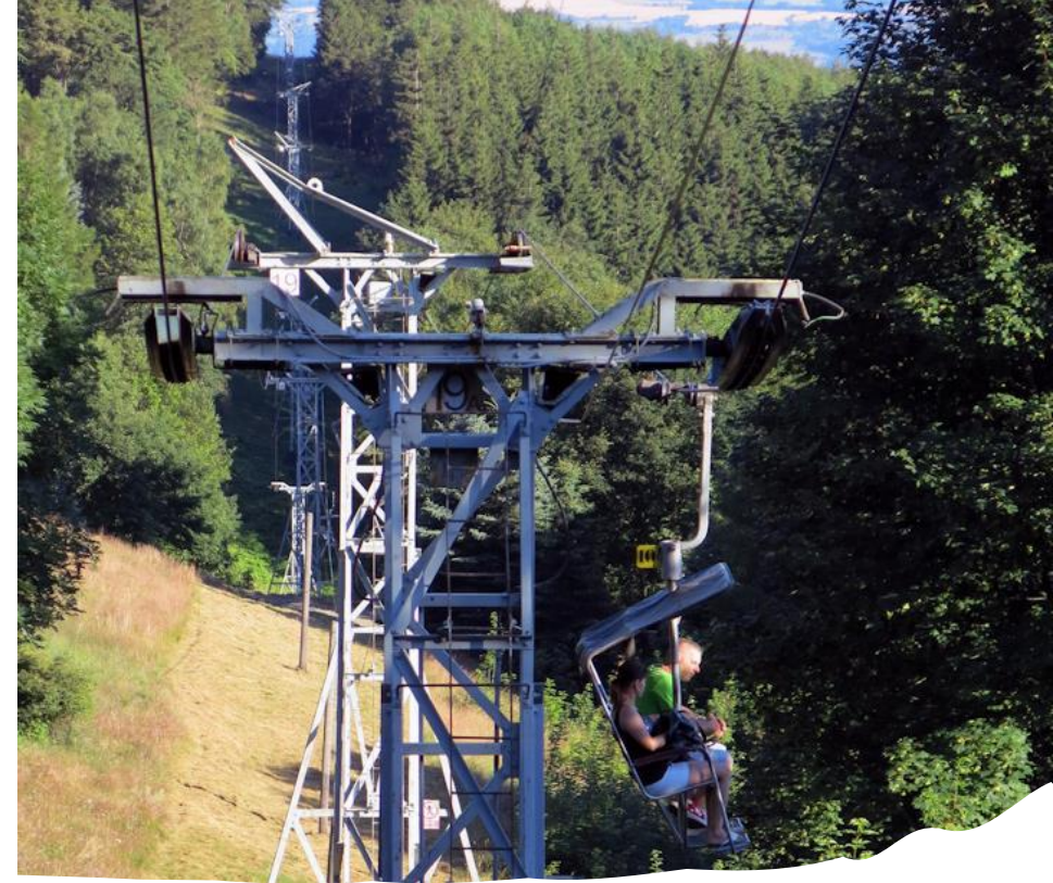
Lanová dráha na Komáří hůrku