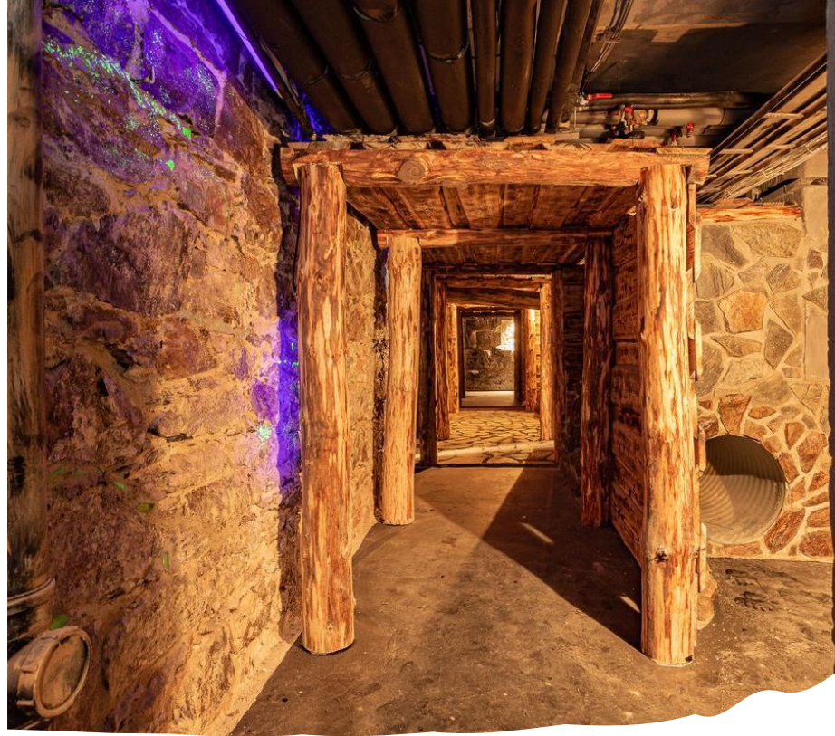
„Štola“ Astoria (infocentrum Lázní Jáchymov)