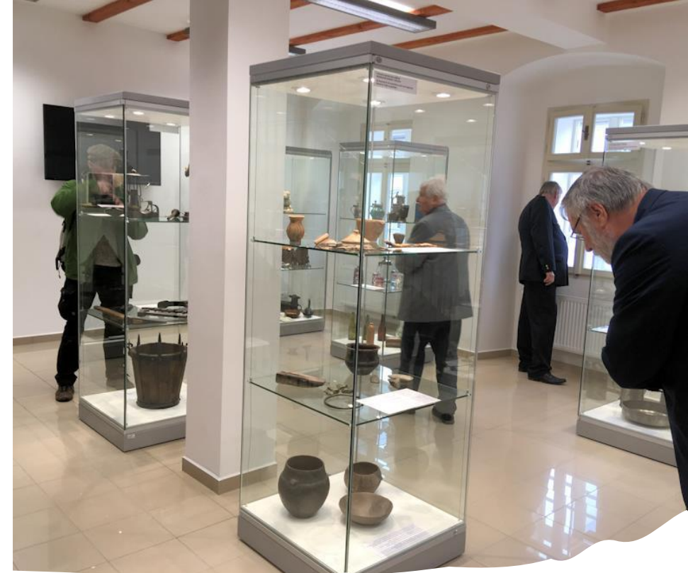
Infocentrum Hornické krajiny Krupka