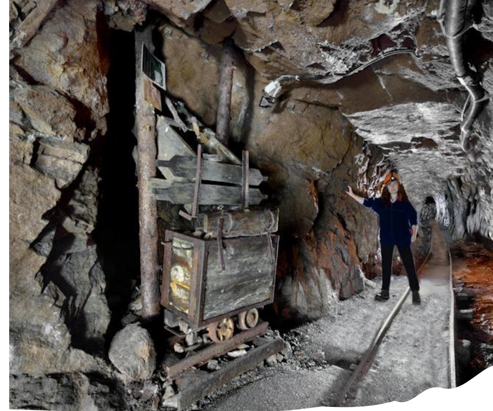
Štola Starý Martin