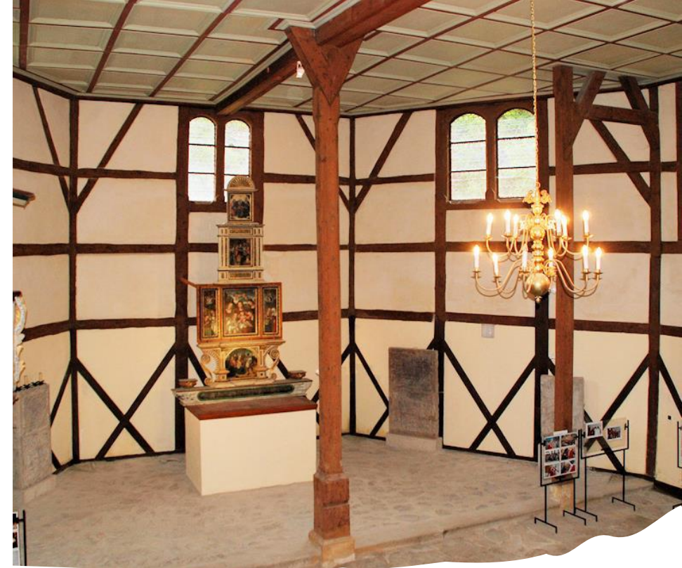
Kostel Všech svatých