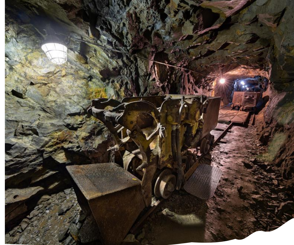
Štola č. 1