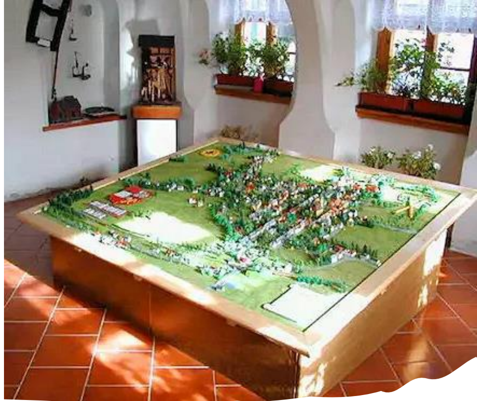
Muzeum v Horní Blatné