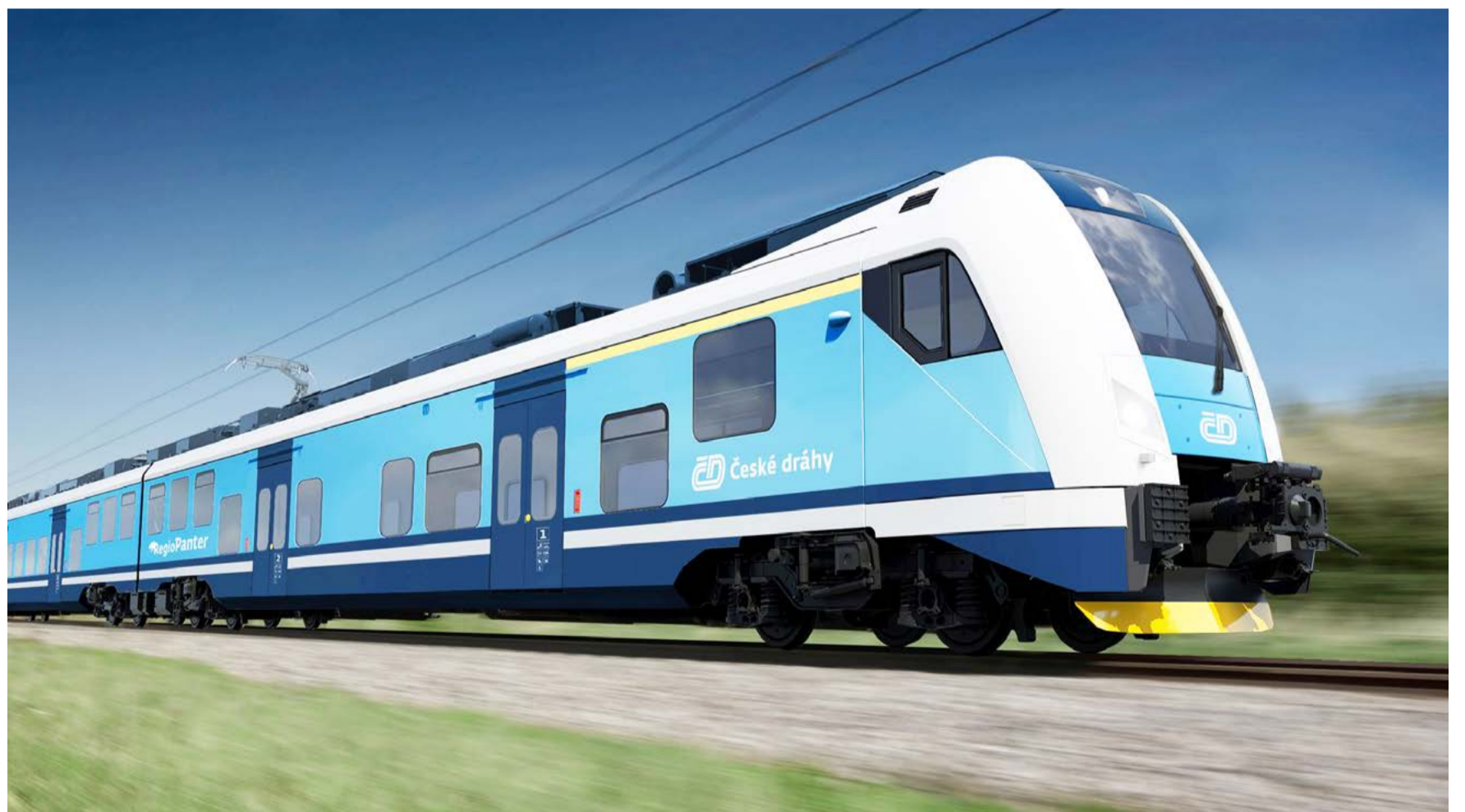
RegioPanter Výroba čtyř vlakových souprav vyšla na půl miliardy korun, z toho 85 procent pokryla evropská dotace z Opreačního programu Doprava II., kterou se Karlovarskému kraji úspěšně podařilo získat.

mají nejmodernější dálkové vlaky. Cestující mají v klimatizovaných oddílech k dispozici Wi-Fi připojení k internetu, elektrické zásuvky a USB porty pro dobíjení cestovní elektroniky, jako jsou mobily, tablety nebo notebooky. Cestujícím s kojencí nabízejí přebalovací pult a lidem na vozíku komfortní bezbariérové cestování. Úplnou novinkou u nás v republice je i speciální zásuvka pro dobíjení elektrických vozíků,“ doplnil Jiří Jeřeta. (KÚ)