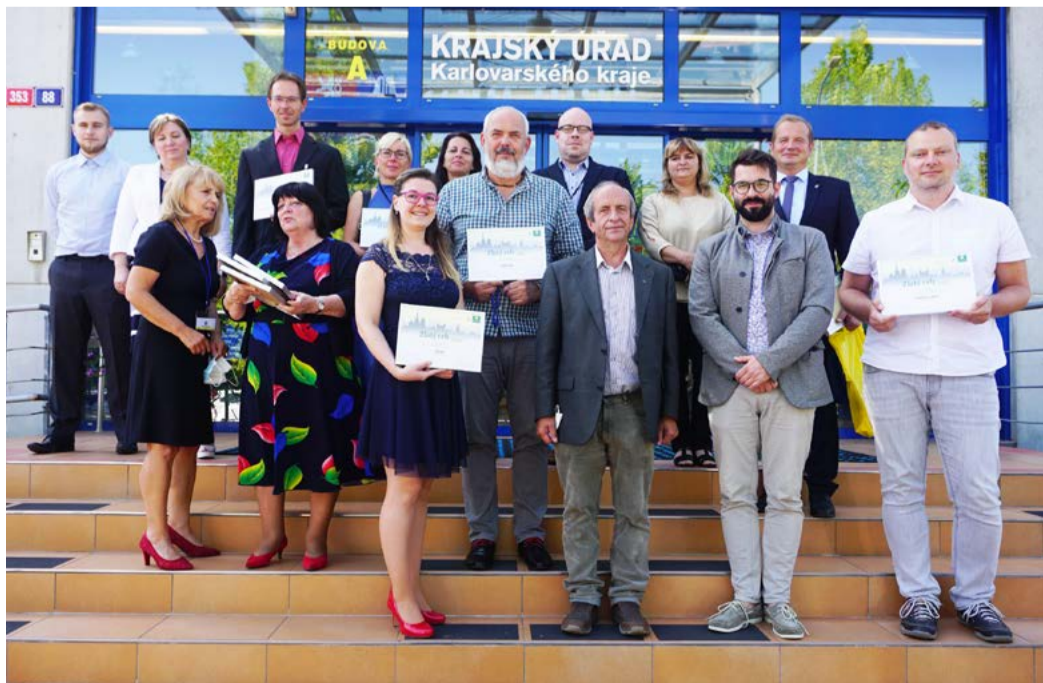
Zlatý erb 2021 Krajské kolo soutěže o nejlepší webové stránky a elektronické služby měst a obcí zakončil slavnostní ceremoniál.

krajského internetového portálu,“ dodal. Účast v soutěži je pro města a obce zdarma, díky hodnocení portálů pracovníci, kteří mají na starosti webové stránky, mohou získat informaci, zda jejich web splňuje legislativní požadavky a je uživatelsky vstřícný pro občany. Na webových stránkách soutěže jsou zveřejněna hodnotící kritéria vypracovaná ve spolupráci s ministerstvem vnitra a jsou využívána jako významná metodická pomůcka pro tvůrce i uživatele webových stránek (KÚ)