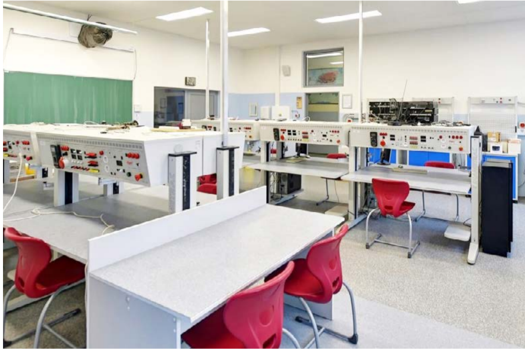
Podzimní výstava V Integrované střední škole Cheb si mohou zájemci o studium prohlédnout moderní výukové prostory.

KARLOVARSKÝ KRAJ Také v letošním roce se mohou žáci 8. a 9. tříd základních škol podrobně seznámit s nabídkou středních škol Karlovarského kraje i s širokou škálou oborů. Umožní jim to podzimní výstavy škol, jichž se pravidelně účastní i zaměstnavatelé z regionu. Svoz žáků financuje Karlovarský kraj.