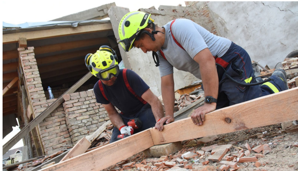
Na pomoc obcím zasaženým ničivými přírodními živly vyrazili profesionální i dobrovolní hasiči z Karlovarského kraje.