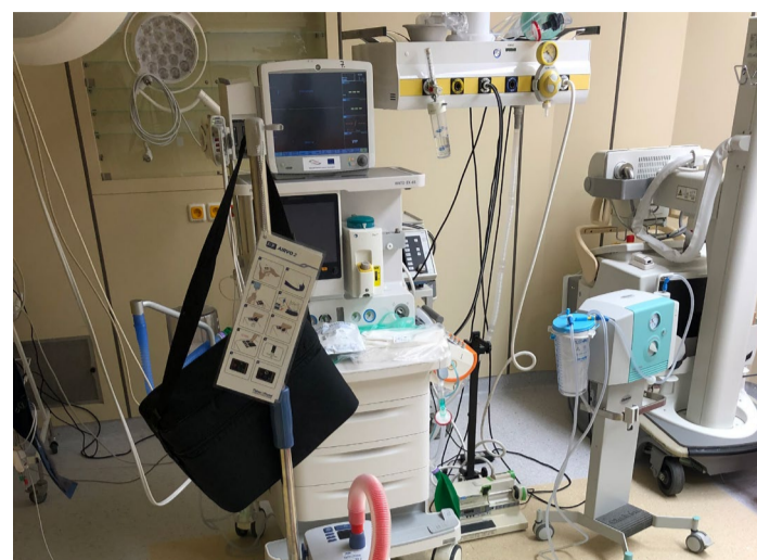
HFNO Nové přístroje na oddělení Emergency a dětském zajišťují neinvazivní podporu dýchání.

V rámci nákupu přístrojů Airvo byly zakoupeny i mikronebulizační přístroje Aerogen, díky kterým je možné podávat současně léky ve formě aerosolu, který se přidává do směsi produkované samotným přístrojem. Cena zakoupených přístrojů včetně mikronebulizátoru a průtokoměru přesáhla část- ku 300 tisíc korun. Nákup těchto přístrojů a dalších pomůcek byl financován z daru Nadace Charty 77 – Konto Bariéry, který do jeho fondu věnovala společnost Philip Morris ČR. (KÚ)