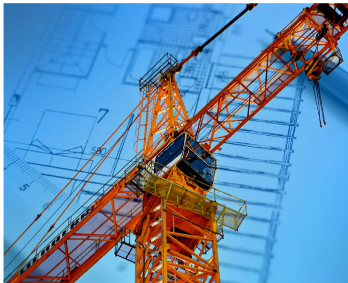
Digitální model budovy Pilotním projektem, kde si kraj novou metodu vyzkouší, bude rekonstrukce budovy B krajského úřadu.

KARLOVARSKÝ KRAJ Přenést řízení rozvoje území regionu do plně digitalizovaného prostředí plánuje v následujících obdobích Karlovarský kraj. Díky tomu bude možné sladit výstavbu budov z pohledu přípravy rozpočtu stavby, energetické náročnosti i dobu udržitelné existence objektů. Využít chce k tomu metodu BIM (Building Information Modeling), tedy vytvoření digitálního modelu – dvojčete budovy, který bude zahrnovat veškeré informace o objektu pro jeho realizaci, správu a provoz po dobu jeho užívání. To zároveň umožní získaná data propojit s digitální technickou mapou Karlovarského kraje a pracovat s nimi při plánování výstavby a rozvoje infrastruktury v okolí, v rámci celého regionu. Později by se tato data mohla promítnout i do připravované Digitální mapy veřejné správy ČR. Plán Karlovarského kraje koresponduje s iniciativou Evropské komise, která nese název „Nový evropský Bauhaus“. „Myšlenku nového evropského Bauhausu, která vychází z avantgardní německé umělecké školy 20. let minulého století, oznámila loni předsedkyně EK Ursula von der Leyen. Cílem je sjednotit úsilí v oblasti architektury, designu, udržitelnosti a investic s ohledem na snahu o dosažení klimatické neutrality v Evropě. Veškeré nápady a řešení by měly v první řadě šetřit životní prostředí, vycházet z potřeb lidí, ale zároveň