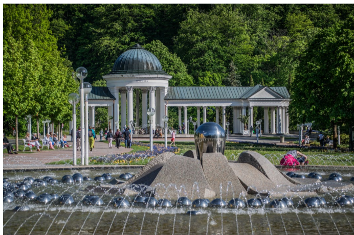
Slavné lázně Evropy/Great Spas of Europe Lázeňská města z našeho kraje (včetně Mariánských Lázní na snímku) už dostala doporučení pro nadnárodní sériovou nominaci na Seznam UNESCO od Mezinárodní rady památek a sídel (ICOMOS).

KARLOVARSKÝ KRAJ Karlovy Vary, Mariánské Lázně a Františkovy Lázně míří spolu s dalšími evropskými lázeňskými městy na Seznam světového kulturního a přírodního dědictví UNESCO. Doporučení pro nadnárodní sériovou nominaci s názvem Slavné lázně Evropy/Great Spas of Europe dostala města od Mezinárodní rady památek a sídel (ICOMOS). Stanovisko ICOMOS je zásadním vodítkem Výboru pro světové dědictví, který bude na konci července 2021 o nominaci a zápisu lázní na Seznam UNESCO jednat.