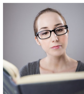
Učitelství pro 1. stupeň ZŠ Nový studijní obor chce Fakulta pedagogická ZČU otevřít v Chebu už v novém akademickém roce 2021/2022.

Podle představitelů jednotlivých fakult se nyní připravuje rozšíření činnosti Fakulty pedagogické ZČU v Chebu, kde se od nového akade- mického roku 2021/22 otevře magi-