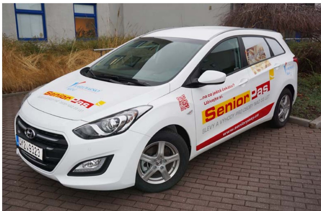
Automobil Senior Pasu, 2018