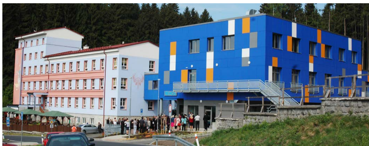
Objekt REHOS Nejdek, 2018