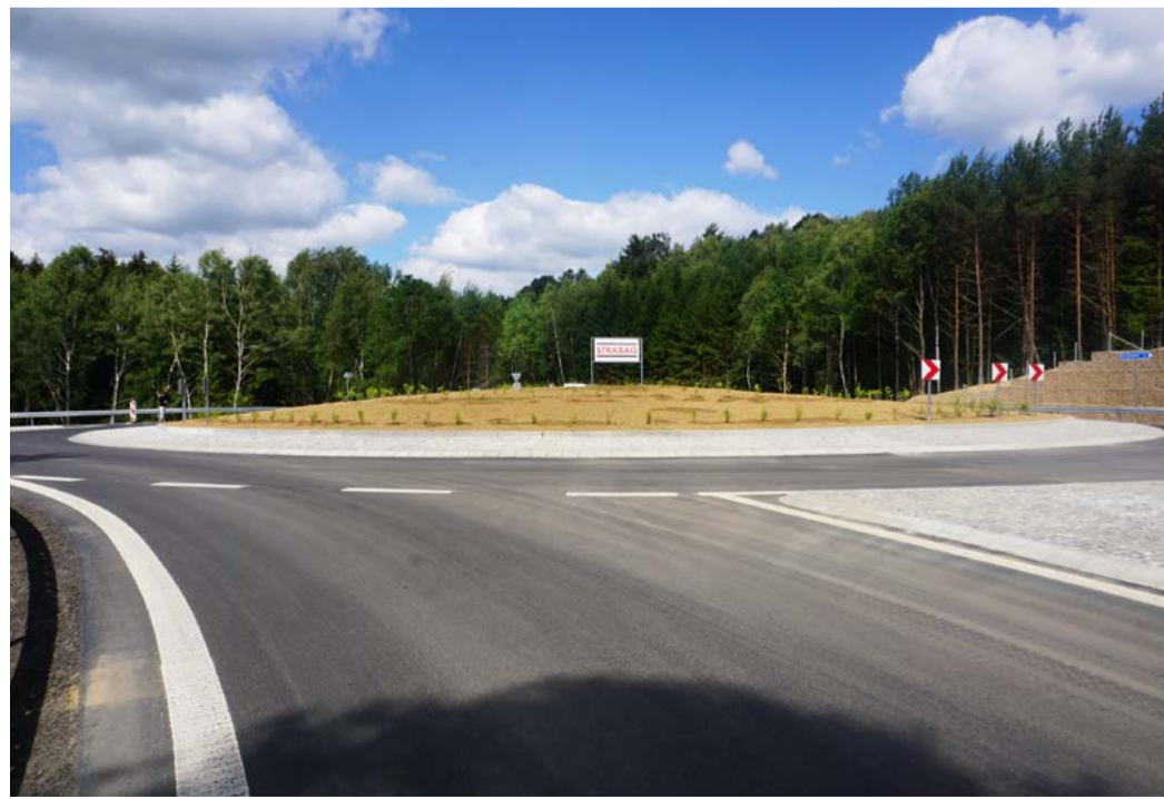
Dopravní napojení k budoucí komerční zóně na Podkrušnohorské výsypce u Sokolova, červen 2020

Zkušební centrum by mělo zahájit provoz koncem roku 2022. (KÚ)