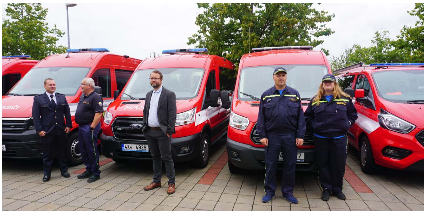
Nové automobily pro hasiče Šestnáct nově zakoupených automobilů a další vybavení pro jednotky dobrovolných hasičů představili zástupci měst a obcí a velitelé jednotek začátkem srpna přímo v areálu Krajského úřadu Karlovarského kraje.

epidemiologická situace ve výskytu onemocnění COVID-19, způsobené novým koronavirem a s tím související vyhlášení nouzového stavu vládou ČR dne 12. 3. 2020. V případě schválení druhé části dotací z rozpočtu kraje bude tak jako loni podpořeno pořízení nových dýchacích přístrojů, zásahových obleků, havarijního vyprošťovacího zařízení, mobilních radiostanic, čtyřkolek, přenosných zásahových prostředků, obnova pneumatik u cisternových stříkaček a nově je letos podporováno také rozšíření řídicího oprávnění na skupinu „C“. (KÚ)