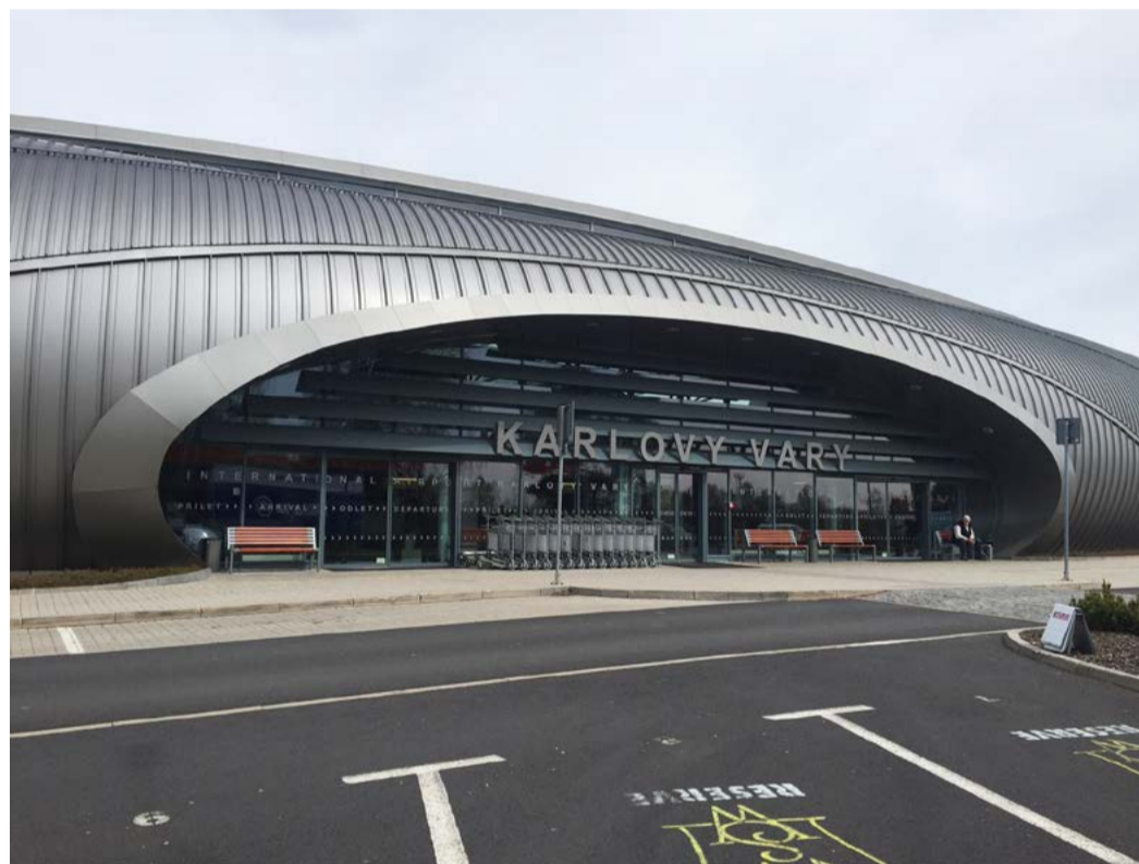
Letiště Karlovy Vary, 2017