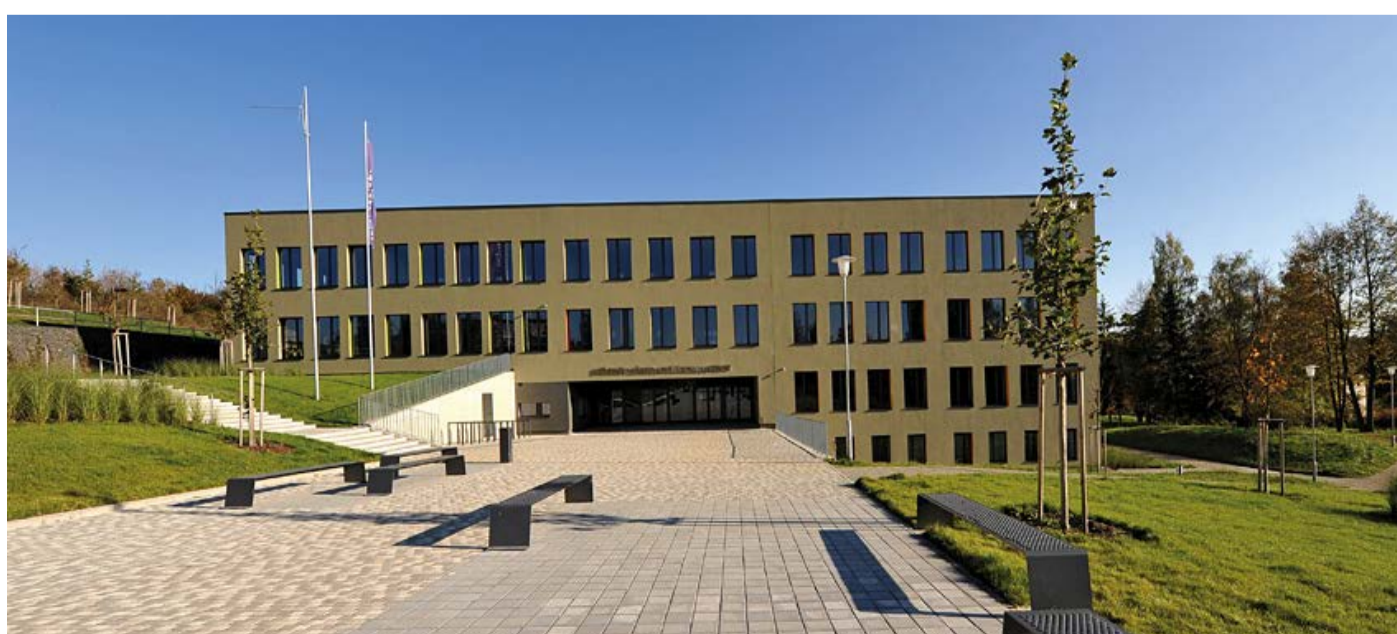
Střední průmyslová škola Ostrov, 2011