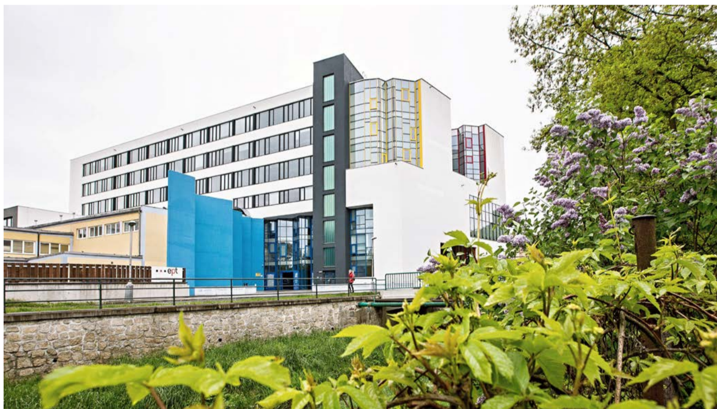
Integrovaná střední škola technická a ekonomická Sokolov

Ze máme v Karlovarském kraji šikovné a nadějně sportovní talenty, prokázala Olympiáda dětí a mládeže. Hry IX. zimní olympiády dětí a mládeže se na území kraje konaly historicky poprvé. Zúčastnily se jich výpravy ze všech třinácti krajů a hlavního města Prahy. Mladí olympionici Karlovarského kraje získali 24 medailí a mezi kraji obsadili celkové 9. místo. (KÚ)