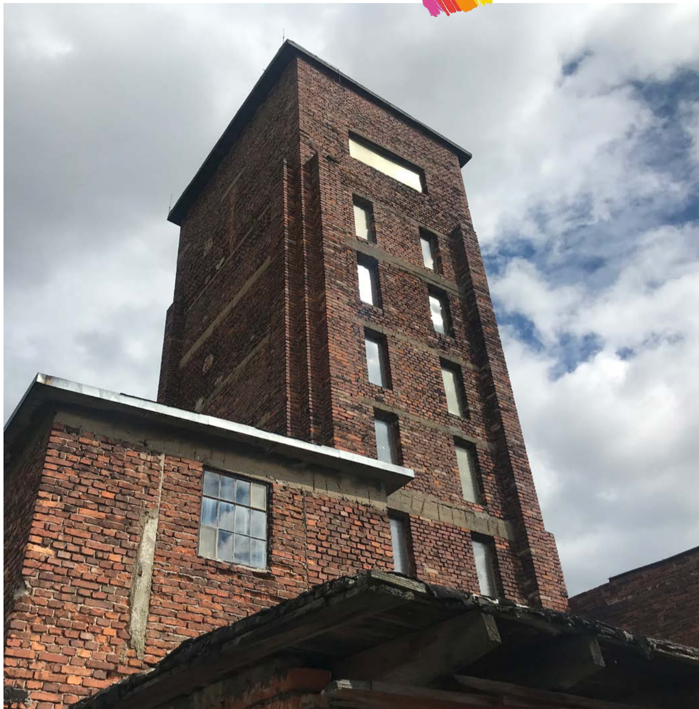
Rudá věž smrti v Ostrově - památka zapsaná na Seznamu UNESCO