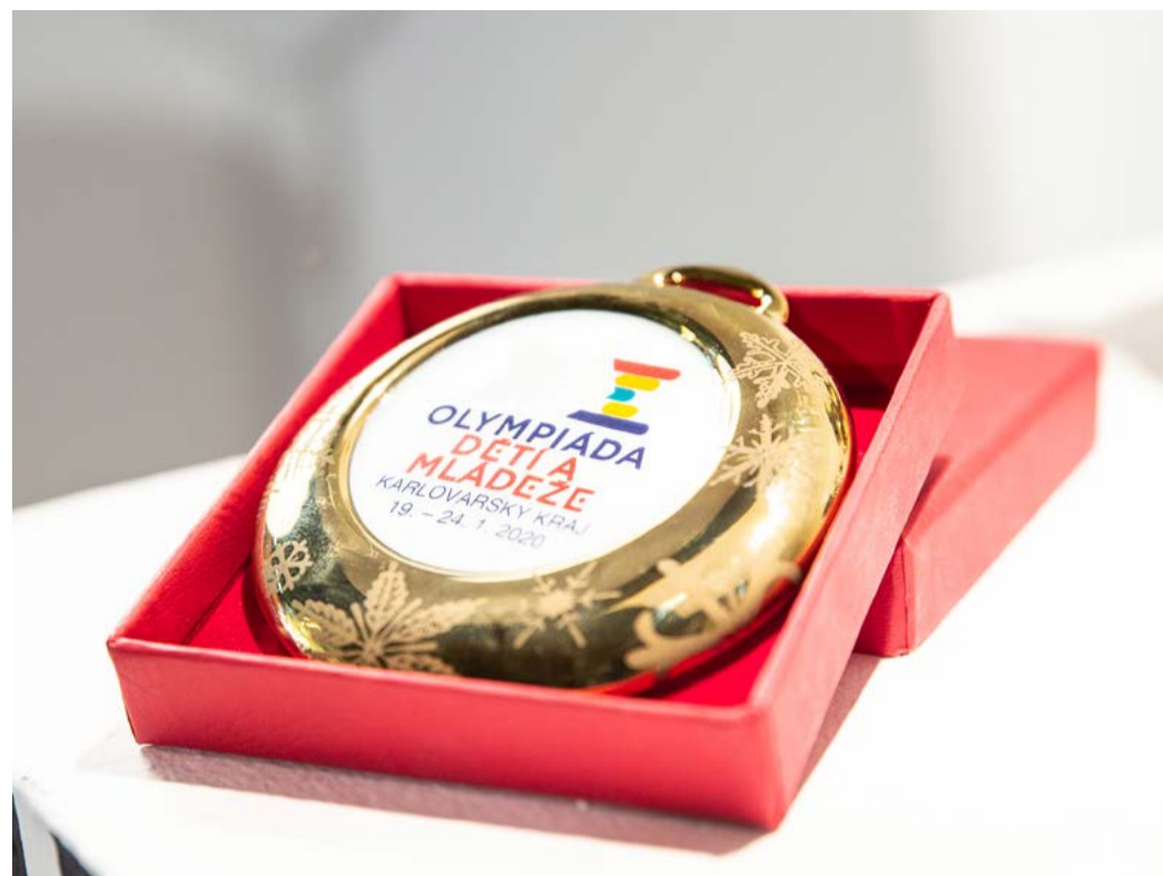
Medaile pro vítěze Olympiády dětí a mládeže

Pro letošní rok vyčlenil kraj ze svého rozpočtu 2 miliony korun na údržbu běžeckých tras. Tuto dotaci je možné využít také na jejich letní úpravu. Dále Karlovarský kraj investoval částku 5,1 milionu korun do sportovního areálu na Jahodové louce. Vznikl tam objekt, který slouží jako zázemí pro rozhodčí, skladovací prostory, garáž pro rolnu a prostor centrální lyžařny s vybavením pro údržbu lyží. (KÚ)