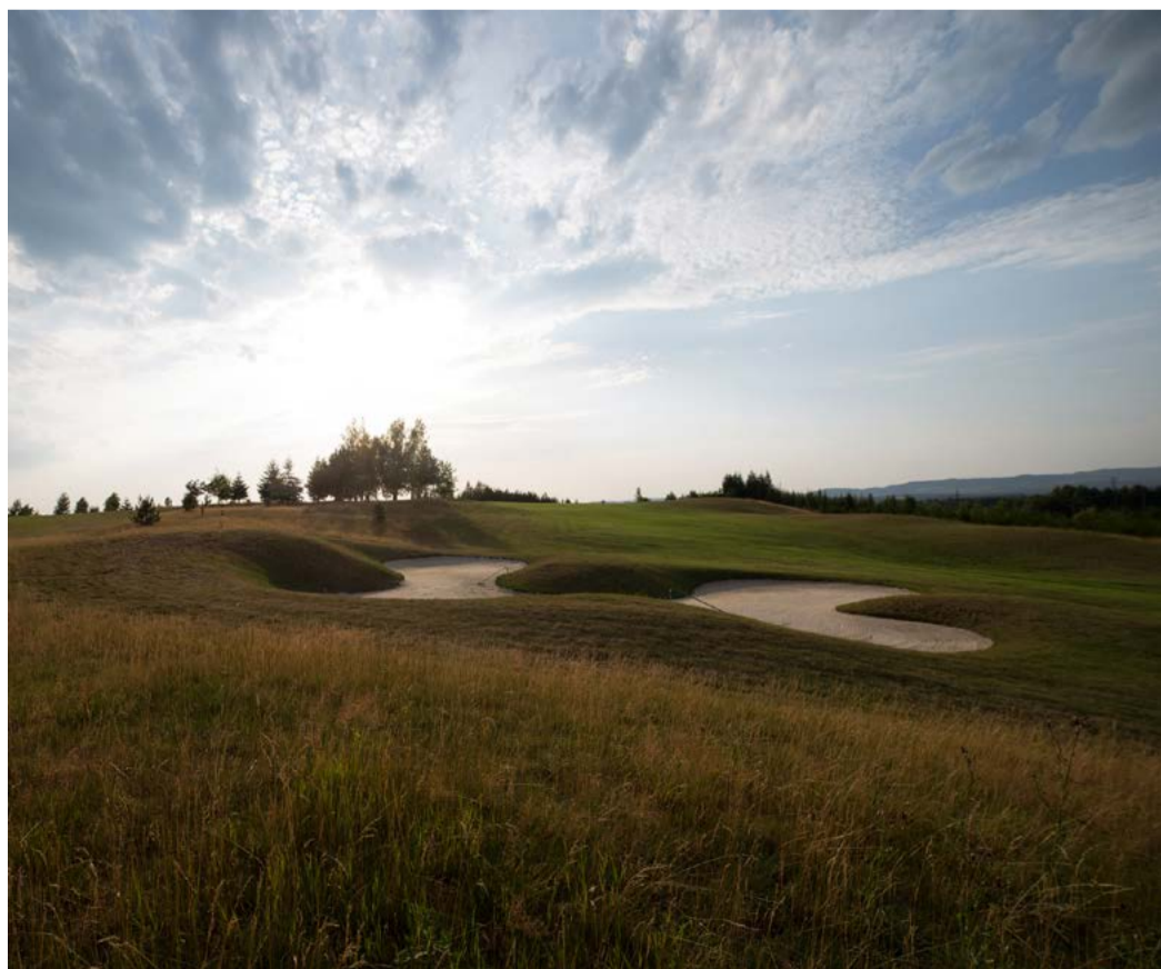
Golfové hřiště v Sokolově vzniklo v roce 2006 ve východní části výsypky.

Druhým podpořeným projektem je „Příprava území pro výstavbu rodinných domů“ ve Starém Sedle v části Pod lesem. Cílem projektu je zasisťování lokalit pro následnou výstavbu 48 rodinných domů. Předpokládané náklady činí 74 milionů korun. (KÚ)