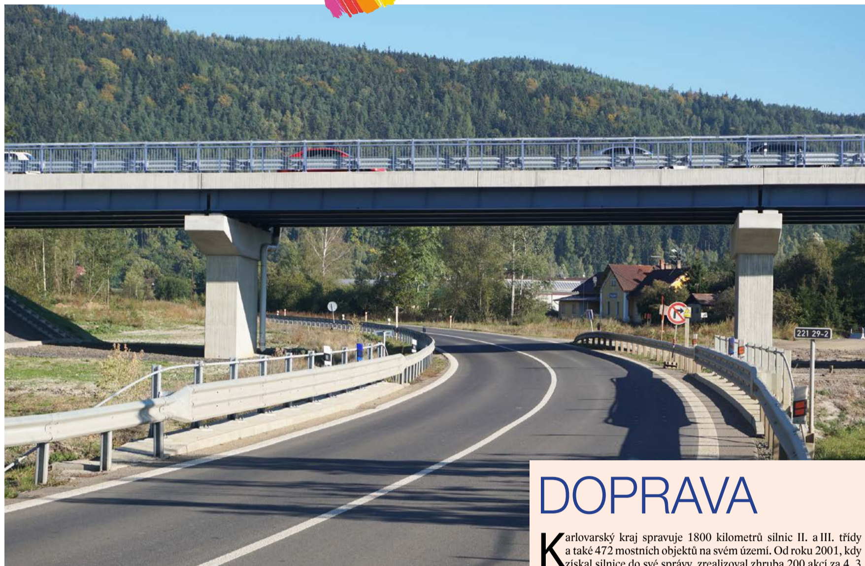
Obchvat a modernizace silniční sítě v Hroznětíně, 2015

Karlovarský kraj se v naší zemi řadí k oblastem s unikátním přírodním bohatstvím. Kromě chráněných území, která se nacházejí v Chráněné krajinné oblasti Slavkovský les a ve vojenském újezdu Hradiště, se kraj stará o více než 70 přírodních památek a rezervací, ležících takzvaně ve volné krajině. V letošním roce na údržbu těchto území vyčlenil 4 miliony korun. Aktuálně zafinancoval práce na úpravě stavu přírodní památky Rotavské varhany. Finanční prostředky z tohoto programu (OPŽP) administrovaného Ministerstvem životního prostředí ČR jdou na zastavení poklesu biodiverzity, ochranu ohrožených rostlin a živočichů, zajištění ekologické stability krajiny a na vznik a zachování přírodních prvků v osídlených oblastech. Pro následující léta Karlovarský kraj připravil seznam dalších území, která čekají na podpůrné zásahy ke zlepšení stavu přírodních rezervací a památek v regionu. Hned v příštím roce to bude například obnova přírodní památky Malý Stolec ve Stráži nad Ohří. (KÚ)