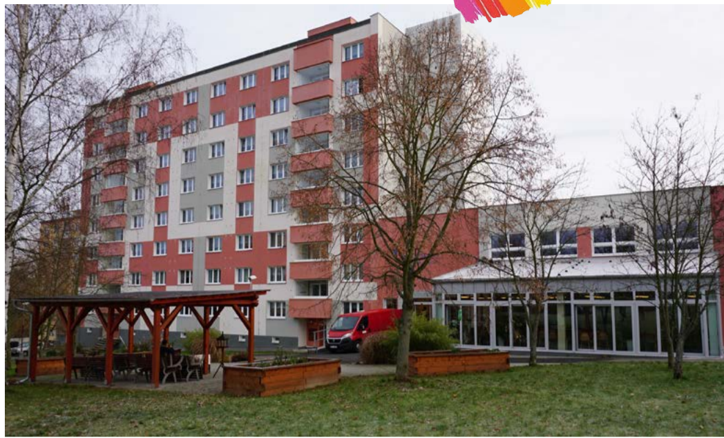
Domov pro seniory Skalka Cheb, 2019