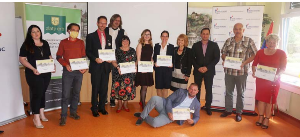
Zlatý erb 2020 Ceny vítězům 22. ročníku krajského kola soutěže byly předány při slavnostní ceremonii na krajském úřadě.