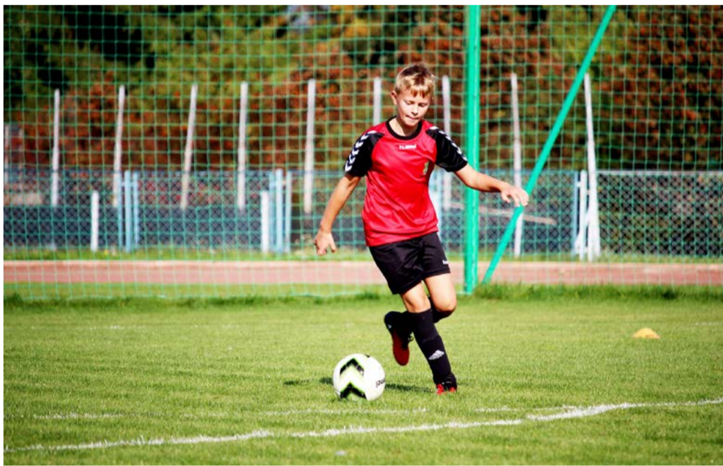
Krajská dotace je letos vyšší Na sportovní aktivity dětí a mládeže letos vydá kraj ze svého rozpočtu o dva miliony korun více než loni.

Váni se sportovní komise, která působí při Radě kraje, snažila rozdělit dotace po dlouhé diskusi velmi pečlivě. „Pro nás je zásadní to, aby se o sport zajímalo co nejvíce dětí už od nižšího věku a aby jim láska ke sportu vydržela až do dospělosti. Velmi živě jsme proto diskutovali o rozdělení dotací a snažili jsme se vyjít vstříc všem žadatelům. Jsem rád, že krajský zastupitelé odsouhlasili poskytnutí příspěvků, protože už nic nebrání tomu, aby se potřebné finance k jednotlivým sportovním organizacím dostaly co nejdříve,“ dodal krajský radní Josef Vána. (KÚ)