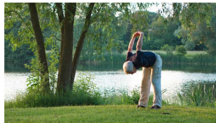
Senior Pas Slevy lze prostřednictvím karty čerpat nejen na služby či zboží v oblasti zdravotnictví, ale zvýhodněné nabídky platí rovněž pro vybrané kulturní instituce, sportovní a wellness zařízení nebo například vzdělávací organizace.

Nabídka aktivit pro seniory z našeho regionu se však neomezuje pouze na výhody spojené s využitím slevové karty. Již nyní Karlovarský kraj připravuje celou řadu vzdělávacích akcí, na které se senioři mohou těšit na podzim letošního roku. V plánu jsou kurzy bezpečnosti, díky nimž se dozví, jak se chránit před podvodníky, zloději a násilníky. Přichystány budou také zdravotní semináře, zaměřené na správnou životosprávu a pohybová cvičení, nebo semináře v dopravě, které připomenou zásady bezpečného chování v silničním provozu. Senioři nepřijdou ani o oblíbené tréninky paměti. „Zároveň bych chtěl všechny po nejsrdčejší pozvat na oslavu Mezinárodního dne seniorů, která se letos uskuteční ve čtvrtek 1. října v Chebu a Chodově. Připraven bude opět bohatý kulturní program plný tance, hudby a zábavy. Věřím, že si společně užijeme příjemné odpoledne tak jako vloni v Ostrově a Kraslicích,“ doplnil hejtmán Petr Kubis. (KÚ)