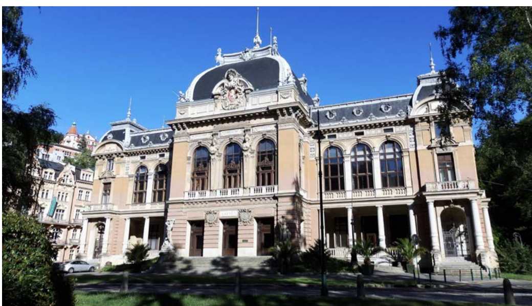
Císařské lázně v Karlových Varech. Mezi největší plánované investiční akce v příštím roce patří další etapa revitalizace.

Ještě letos by se měla rozběhnout zastavená dostavba nemocnice v Chebu. „V době, kdy se celá republika vzpamatovává z pandemie koronaviru, je velmi důležité, aby kraj zachoval probíhající a naplánované investice. Pomůže to všem oblastem života v regionu, ať jsou to opravy silnic, zdravotnictví nebo cestovní ruch a další.