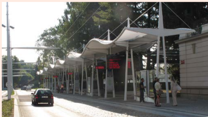
Dopravní terminál Mariánské Lázně (2012)