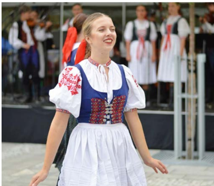
Karlovarský folklorní festival 25. ročník se uskuteční v prvním zářijovém týdnu.

souborů je tento rok s ohledem na mezinárodní situaci logicky omezen, diváci se ale mohou určitě těšit na evropské soubory z Rumunska či tradičně oblíbené Slováků. Nebudou chybět ani české a moravské soubory, např. Formani ze Slatiňan, Dyjavánek ze Znojma, Chris z Chrástu, Stázka z Teplé, pravidelný návštěvník Skejušan z Chomutova a domácí organizátorský soubor Dyleň.