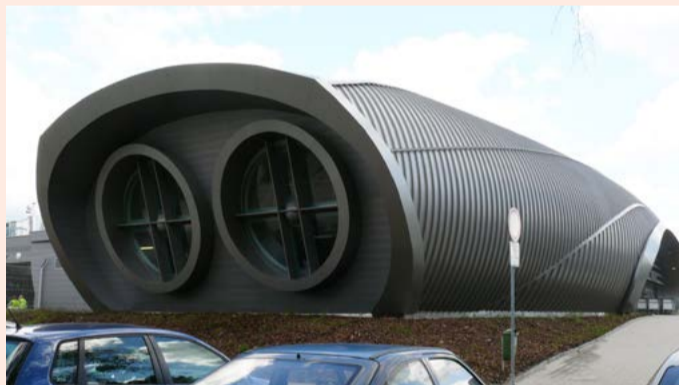
Letiště Karlovy Vary, odbavovací hala (2009)