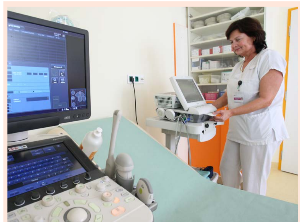
Porodnice v chebské nemocnici už se vrátila ke svému běžnému chodu. Výstavba pavilonu A přinesla pacientům i personálu větší komfort. Nově vybudované prostory, které kraj nechal vybudovat v rámci revitalizace nemocnice, velmi oceňují především maminky, jež se dočkaly zbrusu nové porodnice, nebo lékaři z operačních oborů, kteří mají nyní v Chebu k dispozici špičkové moderní operační sály.

Ve schváleném rozpočtu Karlovarského kraje na rok 2020 se počítalo s daňovými příjmy ve výši 2 966 438 tisíc korun, z toho částku 1 milion korun představují správní poplatky a částku ve výši 2 965 438 tisíc korun výnosy ze sdílených daní. Výše výnosů ze sdílených daní vycházela z procentní výše, kterou se Karlovarský kraj podílí na celostátním výnosu daní a z predikce výnosu daňových příjmů na rok 2020, kterou zveřejňuje ministerstvo financí. Plánovaná výše sdílených daní byla ve schváleném rozpočtu Karlovarského kraje už původně ponížena preventivně o 4,5 procenta, nyní ministerstvo financí predikci výnosu dále snižuje. O dofinancování propadu daňových příjmů rozhodlo krajské zastupitelstvo na svém květnovém zasedání. (KÚ)