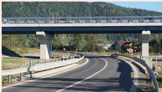
Obchvat Hroznětína (2015)