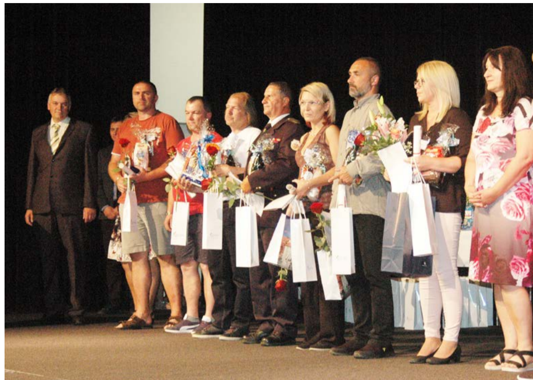
Zlaté kříže pro dárci Letos bylo z našeho regionu na ocenění navrženo 90 dárců krve.