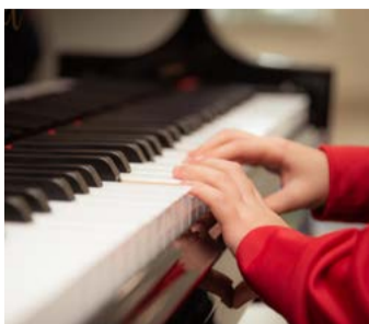
Hvězdy Fanie Projekt hudebního a tanečního vzdělávání získal finanční podporu z přeshraničního programu.

KARLOVARSKÝ KRAJ Malí hudebníci a tanečníci z Chebska, Sokolovska a Karlovarska se budou moci účastnit společných prázdninových pobytů, workshopů a dalších aktivit s dětmi ze sousedního Saska. Projekt s názvem „Hvězdy Fanie – hranice překračující hudební a taneční vzdělávání pro děti a mládež“ totiž získá finanční podporu z přeshraničního programu Evropské územní spolupráce 2014 - 2020 mezi ČR a Svobodným státem Sasko. Rozhodli o tom členové Monitorovacího výboru tohoto programu na svém květnovém zasedání.