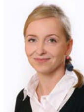
Karla Maříková poslankyně a krajská zastupitelka za SPD

Česko, ale i celou Evropu zužuje sucho. Dlouhotrvající sucho má dopady nejen na přírodu, která nedokáže odolávat škůdcům, ale také na životy nás všech. Sucho, teplo i povodně si však způsobujeme my lidé a to již několik desetiletí. Příčinou jsou především drastické zásahy do půdy a přírody. Globální oteplování je fakt s tím rozdíl, že od těch minulých si za současný stav můžeme sami a na nás teď záleží jak na změnu zareagujeme. Zda se dál budeme chovat „po nás potopa“ nebo něco