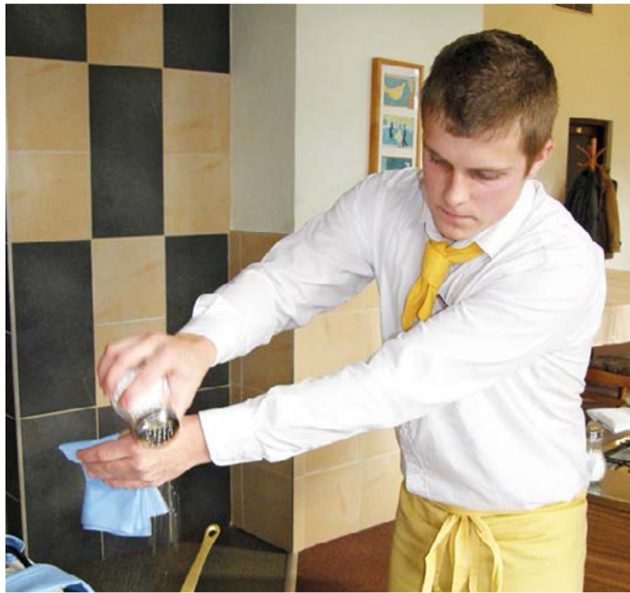
Ilustrační foto www.ssstravovani.cz

„Ve stanovené lhůtě jsme obdrželi celkem pět nabídek, přičemž žádná nemusela být z následného hodnocení vyřazena. Jako ekonomicky nejvýhodnější byla vyhodnocena nabídka společnosti Mudicon, která provede stavební práce za 8,2 milionu korun včetně DPH. Realizace veřejné zakázky poběží