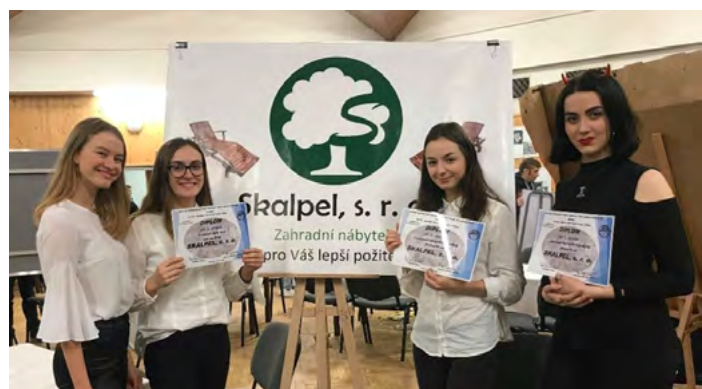
Firma Skalpel Fiktivní eserečko získalo na veletrhu kompletní sbírku medailí.