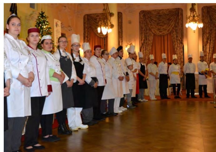
Lázeňský pohárek Jubilejní 20. ročník uspořádala karlovarská pobočka Asociace kuchařů a cukrářů ČR společně se Střední školou stravování a služeb Karlovy Vary a Střediskem praktického vyučování Grandhotel Pupp.