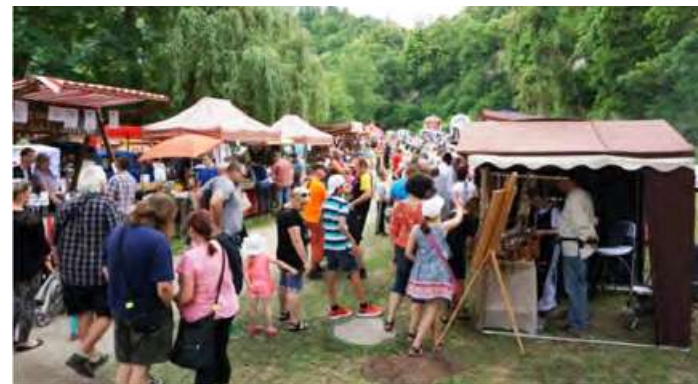
Historický jarmark K vidění byly i ukázky tradičních řemesel.