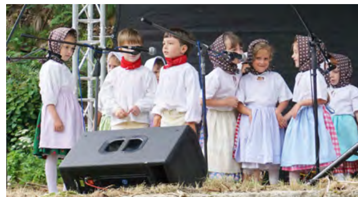
Dyleň Soubor písní a tanců z Karlových Varů.