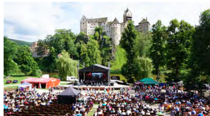
Oslavy 100 let Československé republiky v amfiteátru v Lokti.