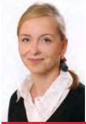
Karla Maříková poslankyně a krajská zastupitelka za SPD

Ztratil jsem vztah k přírodě, půdě i zemědělství. Dnešní orná půda je zastavována sklady a montovnami rychlostí 15 hektarů denně a tam kde se zlatato obilí dnes zasmrádá řepka nebo stojí sklady. Přestali jsme si uvědomovat, že orná půda je to nejceňnější co máme.