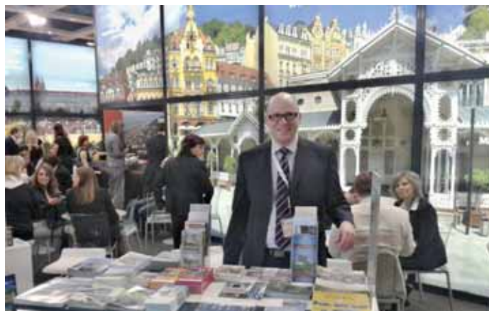
Stánek Karlovarského kraje na jednom z jarních veletrhů.

Karlovarský kraj se letos zatím představil například na veletrhu Vakantie Utrecht, Reisen Hamburg nebo F.R.E.E Mnichov. Další série veletrhů je nyní plánována až na podzim.