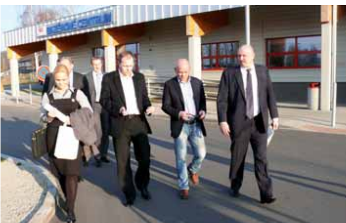
Ministr školství, mládeže a tělovýchovy Marcel Chládek jednal při své březnové návštěvě Karlovarského kraje s hejtmanem Josefem Novotným o zařazení KV Arény na seznam sedmi vybraných a státem podporovaných národních sportovních středisek.

Bude multifunkční sportovní komplex KV Arena zařazený na seznam sedmi vybraných národních sportovních středisek, kde by se připravovaly české reprezentační výběry na vrcholné mezinárodní soutěže? Také o tom jednal hejtman Josef Novotný s ministrem školství, mládeže a tělovýchovy Marcellem Chládkem při jeho březnové návštěvě Karlovarského kraje. Jasně by mělo být v roce 2015.