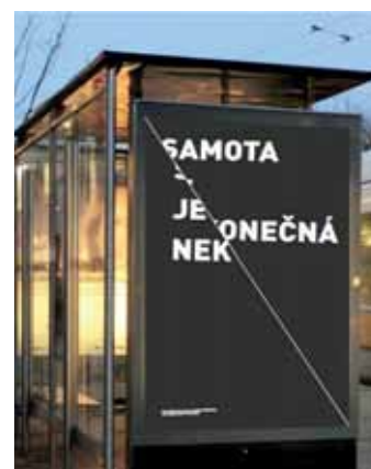
Úspěšná práce Dany Filipové

Studentky se prosadily v konkurenci 140 soutěžních prací. Z nich odborná porota vybrala sedmadvacet nejlepších, které budou reprezentovat české umělecké střední a vyšší odborné školství na festivalu designu Designblok 2014, který se bude konat v říjnu v Praze.