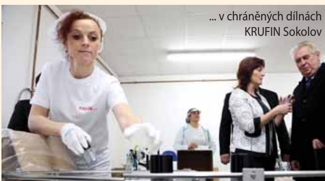
... v chráněných dílnách KRUFIN Sokolov