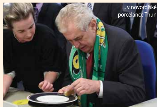
... v novorolické porcelánce Thun