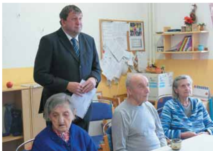
Náměstek hejtmána Miloslav Čermák v Domově pro seniory v Perninku.

Bezbariérový vstup v moderní podobě nyní vítá obyvatele i návštěvníky Domova pro seniory v Perninku. Úpravou přízemí obou svých pavilonů pokračuje domov v plánu postupné modernizace, která bude probíhat i v roce 2014.