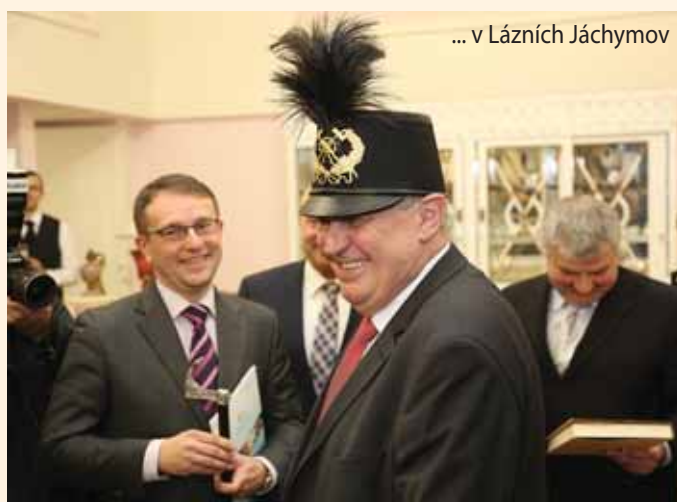
... v Lázních Jáchymov