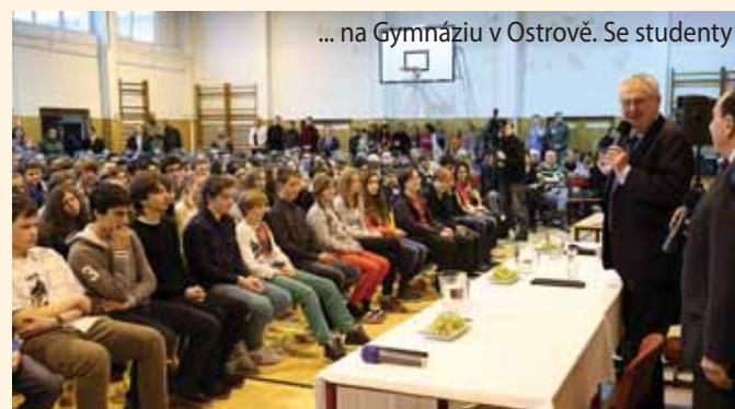
... na Gymnáziu v Ostrově. Se studenty