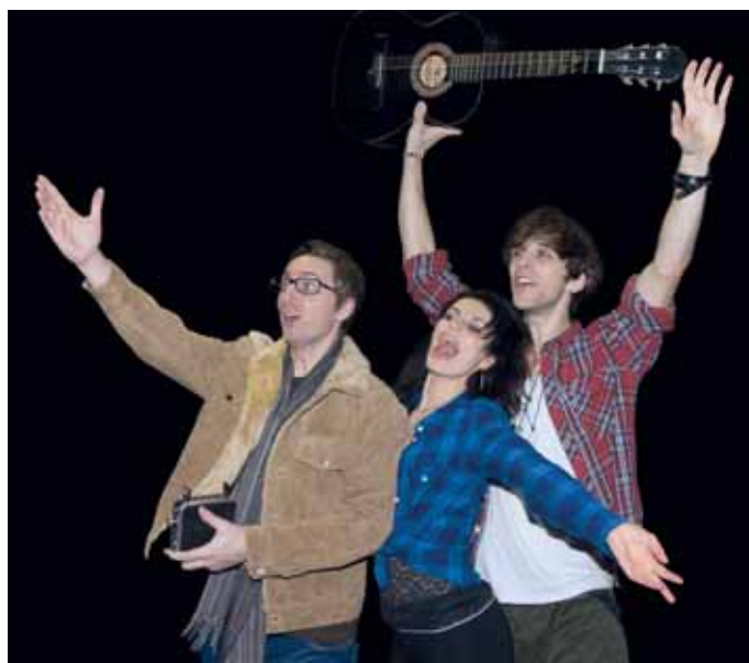
stauraci se svíčkami.

Nemá smysl mluvit o věku. Kdo si rád užívá krásný a dojemný příběh, komu nestačí velká hromadná taneční čísla bez hlubšího smyslu a miluje hudbu, tomu se Rent bude líbit. Rent se nerovná fast foodu. Spíš bych ho přirovnala k útulné re-