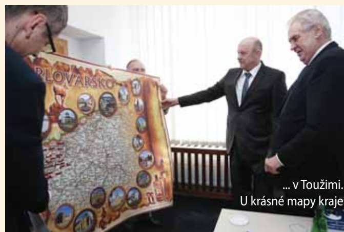
... v Toužimi. U krásné mapy kraje