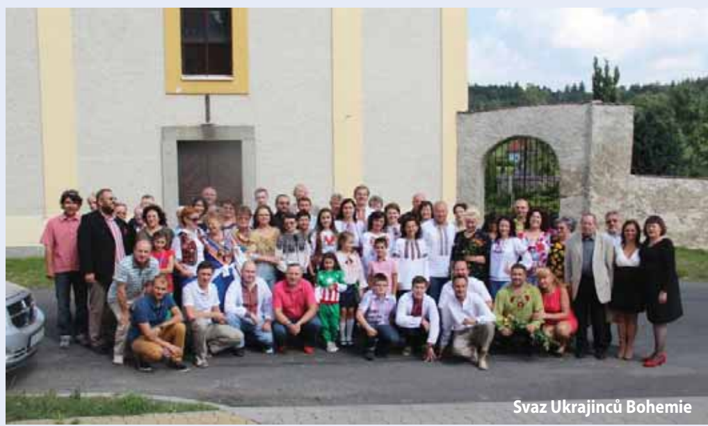
Svaz Ukrajinců Bohemie