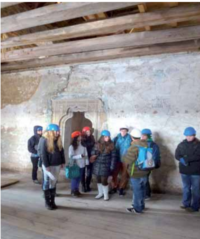
Studenti Střední průmyslové školy v Lokti, kteří studují obor zaměřený na rekonstrukci historických budov, se na hradě Bečov seznámili se středověkými stavebními technikami.