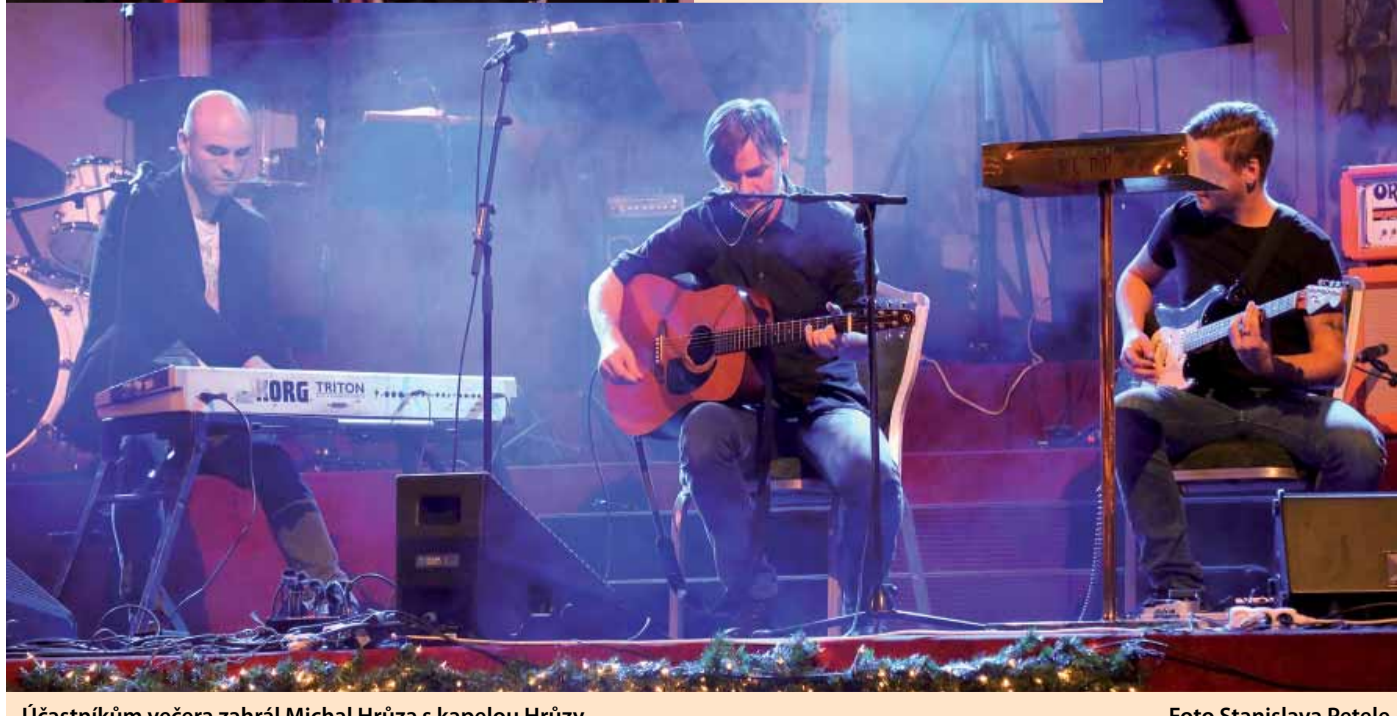
Účastníkům večera zahrál Michal Hřůza s kapelou Hřůzy.