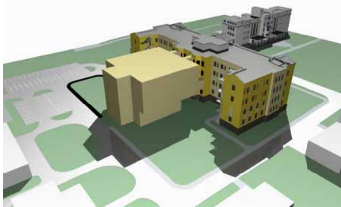
Hlavní budova chebské nemocnice s přístaveným pavilonem. Vizualizace KÚ Karlovarského kraje

K hlavnímu pavilonu B, jehož pravé křídlo bylo opraveno v roce 2012 za 140 milionů korun, bude přístaven zbrusu nový čtyřpatrový pavilon. Do něj se přestěhují ope-