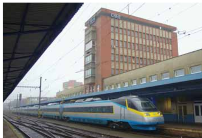
Pendolino nyní přijíždí na Chebsko častěji než vloni.

Tím ale výčet novinek na kolejích nekončí. Mezi ně patří i prodloužení prvního ranního spoje v pracovních dnech na trase Cheb-Aš až do Hranic. Právě z Chebu, který je hlavním železničním uzlem v kraji, vyjíždí nejvíce RegioShar-