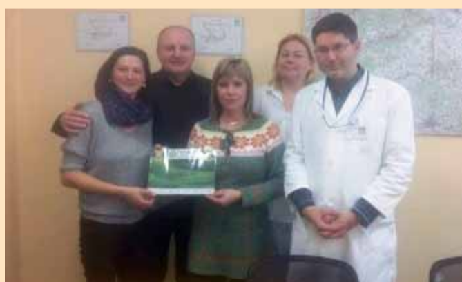
Představitelé FK Baník Sokolov předali nadačnímu fondu Restart příspěvek 12 tisíc korun.

„Náš nadační fond je teprve v začátcích a snaží se použít získané finanční prostředky ve prospěch pacientů, kterým se nedaří nebo mají problémy v oblasti fyzického či psychického zdraví. Příspěvek managementu FK Baník Sokolov nám udělal velikou radost a vážíme si toho, že jsou mezi námi stále lidé, kteří chtějí pomáhat,“ řekli zástupci fondu po převzetí daru od fotbalové-