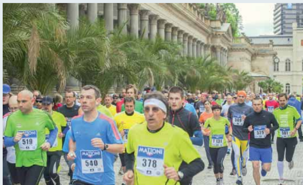
O první ročník Mattoni 1/2Maratonu Karlovy Vary byl vloni velký zájem.

V roce 2013 zažily Karlovy Vary premiéru mezinárodního vytrvaleckého závodu. Krása lázeňského města a vyhlášená vysoká úroveň organizace závodů RunCzech běžecké ligy se zasloužily o úspěch prvního ročníku. Příští rok v květnu se Mattoni 1/2Maraton Karlovy Vary vrátí podruhé a s dvojnásobnou kapacitou startovních čísel.