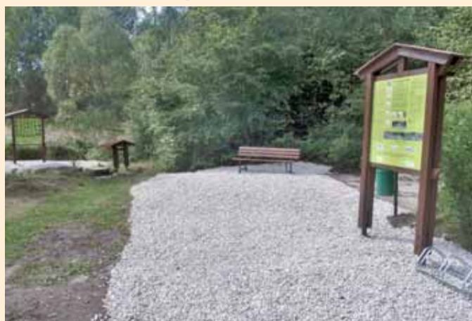
Upravené okolí minerálního pramene Anita mezi Chotíkovem a Nebanicemi.

Cílem projektu bylo zapomenutý pramen opět do- vedení veřejnosti a vytvořit zde příjemné prostředí pro návštěvu a odpočinek. Samotná realizace probíhala od května do září 2013.