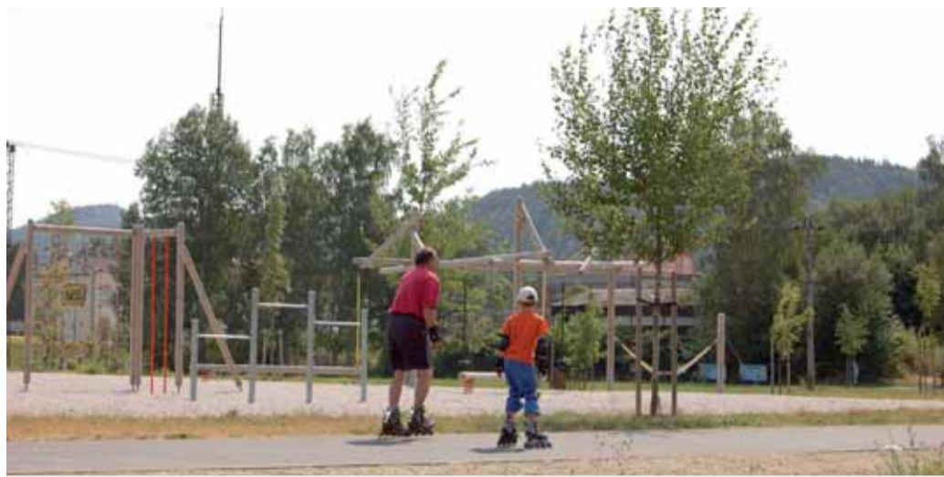
Z dotací ROP Severozápad byla financována také výstavba karlovarského parku meandr Ohře.