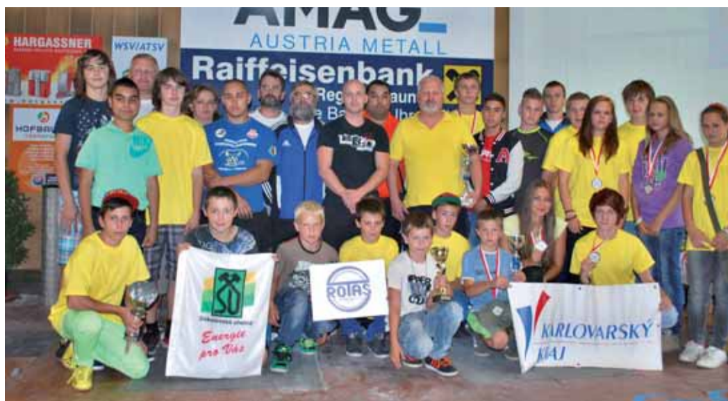
Výprava mladých vzpěračů našeho kraje v Rakousku.

Poslední prázdninový víkend patřil 20. ročníku International Günter Stapfer Gedächtnisturnier v Ranshofenu, jehož se už po osmé v řadě zúčastnilo společné družstvo 23 sportovců z Karlovarského kraje. Startovali zde i sportovci nejen z domácího Rakouska, ale i sousedního Německa a Maďarska.