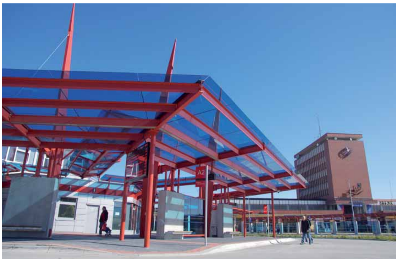
Rekonstrukce chebského terminálu přinesla cestujícím větší komfort.

Inspirací pro konstrukci chebského terminálu, jehož střecha je zavěšená na laněch, hledali tvůrci mimo jiné i v zahraničí. Podobná stavba totiž stojí v německém Bayreuthu, kde stejně jako v západočeském městě patří mezi dominanty.