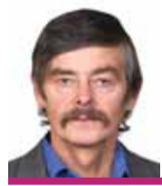
Jan Tancibudek, zastupitel Karlovarského kraje