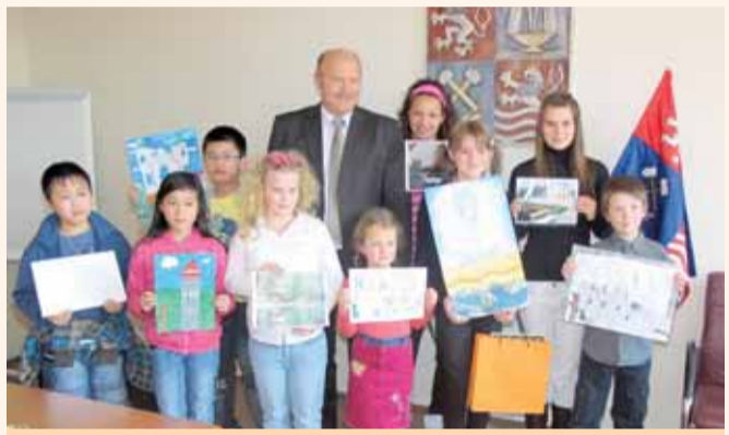
Které děti uspějí v letošní soutěži?

Soutěž začala 1. května 2013 a končí 30. června 2013