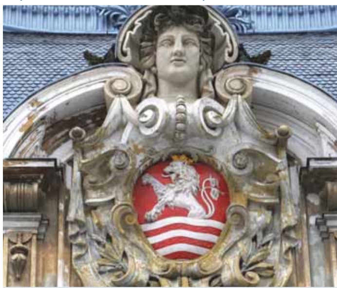
Císařské lázně v Karlových Varech hostí výstavu o karlovarské architektuře.

Až do 19. června bude reprezentativní Zanderův sál Císařských lázní hostit ojedinělou výstavu, která přibližuje architekturu Karlových Varů.