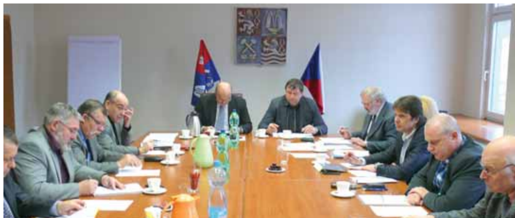
První letošní zasedání tripartity v Karlovarském kraji.