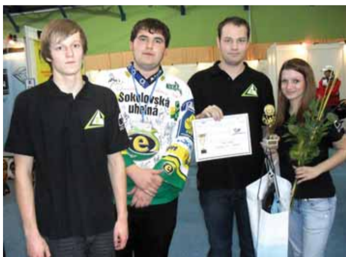
Studenti Střední živnostenské školy Sokolov se fotografují v Bratislavě na mezinárodním veletrhu fiktivních firem - bezprostředně po převzetí ceny.

Kromě toho se studenti také podíleli na přípravě a organizaci 15. mezinárodního veletrhu fiktivních firem v Bratislavě, který probíhal od 28. 11. do 30. 11. 2012. Na veletrhu se přihlásilo celkem 70 firem ze Slovenska, České republiky, Finska, Rakouska, Bulharska a Ukrajiny.