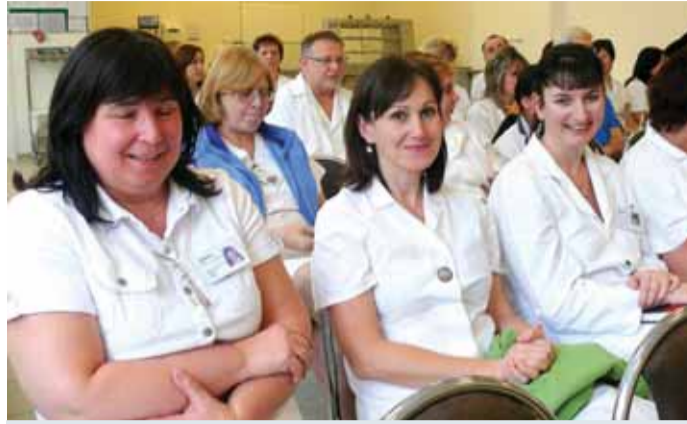
Zaměstnanci sokolovské nemocnice na setkání s vedením Karlovarského kraje.

Zhruba třicítka primářů a vrchních sester Nemocnice Sokolov se v tomto týdnu setkala s hejtmánem Karlovarského kraje Josefem Novotným a náměstkem hejtmána pro zdravotnictví Miloslavem Čermákem. Zástupci kraje zdravotníky ujistili o své podpoře a informovali je o plánovaných investicích do sokolovské nemocnice.