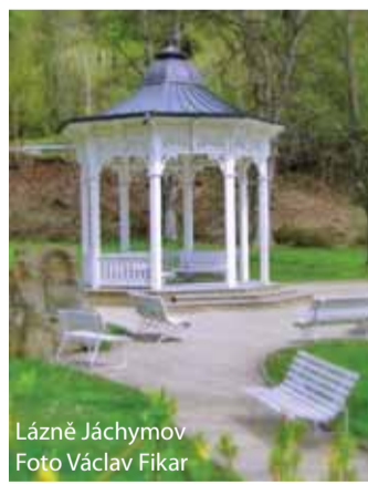
Lázně Jáchymov