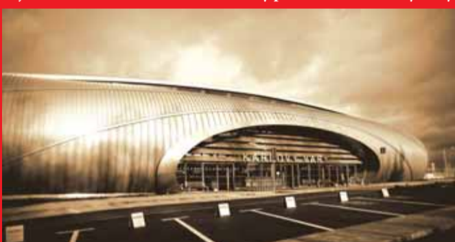
Odbavovací hala letiště v K. Varech.