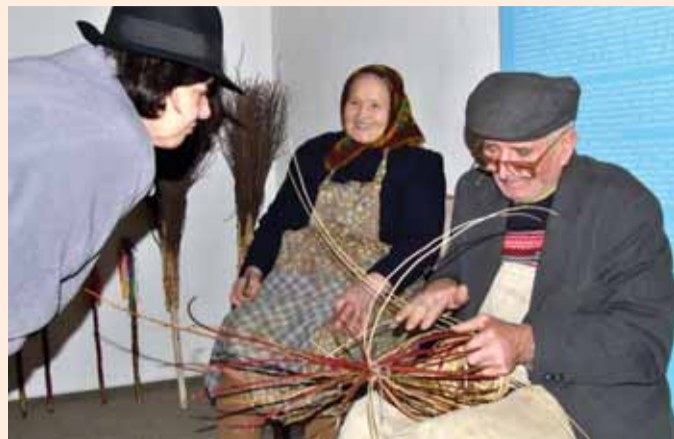
Muzeum v Chebu přitahuje návštěvníky nejen stálými expozicemi či pokojem, ve kterém byl zavražděn Albrecht z Valdštejna, ale i různými tematickými akcemi.

Chebské muzeum zažilo v roce 2012 mimořádnou sezónu. Poprvé v jeho historii prošlo muzejními branami více než třicet tisíc ná-