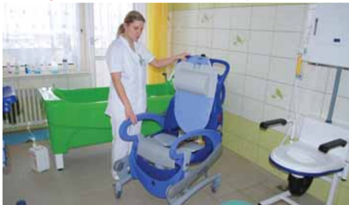
Nová koupelna v Domově pro seniory SKALKA.

Především lidé s omezenou pohyblivostí, ale i ostatní obyvatelé Domova pro seniory „SKALKA“ v Chebu mají k dispozici zbrusu novou centrální koupelnu vybavenou moderními prvky pro snadnou sebeobsahu i pro zjednodušení práce pečovateli. Její vybudování zafinancoval Karlovarský kraj ze svého rozpočtu.