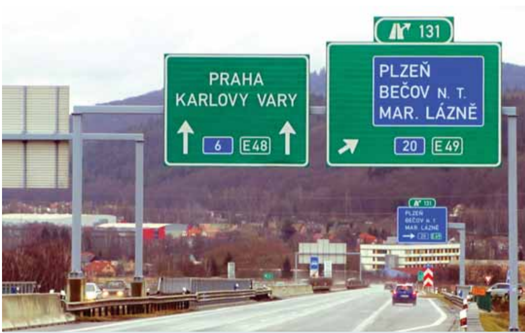
Celkem stovky milionů korun letos vynaloží Karlovarský kraj, stát i města v regionu do oprav silnic a výstavby nových komunikací.