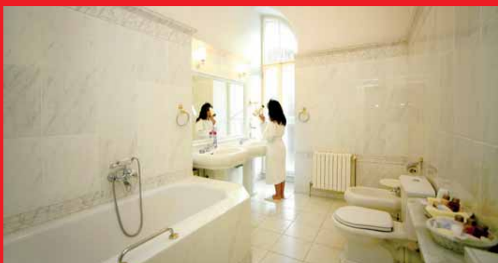
Ministerstvo skokově upravilo pravidla pro hrazení lázeňských pobytů ze zdravotního pojištění, a tak do lázní Karlovarského kraje začalo jezdit méně lidí. Ilustrační foto Léčebné lázně Jáchymov