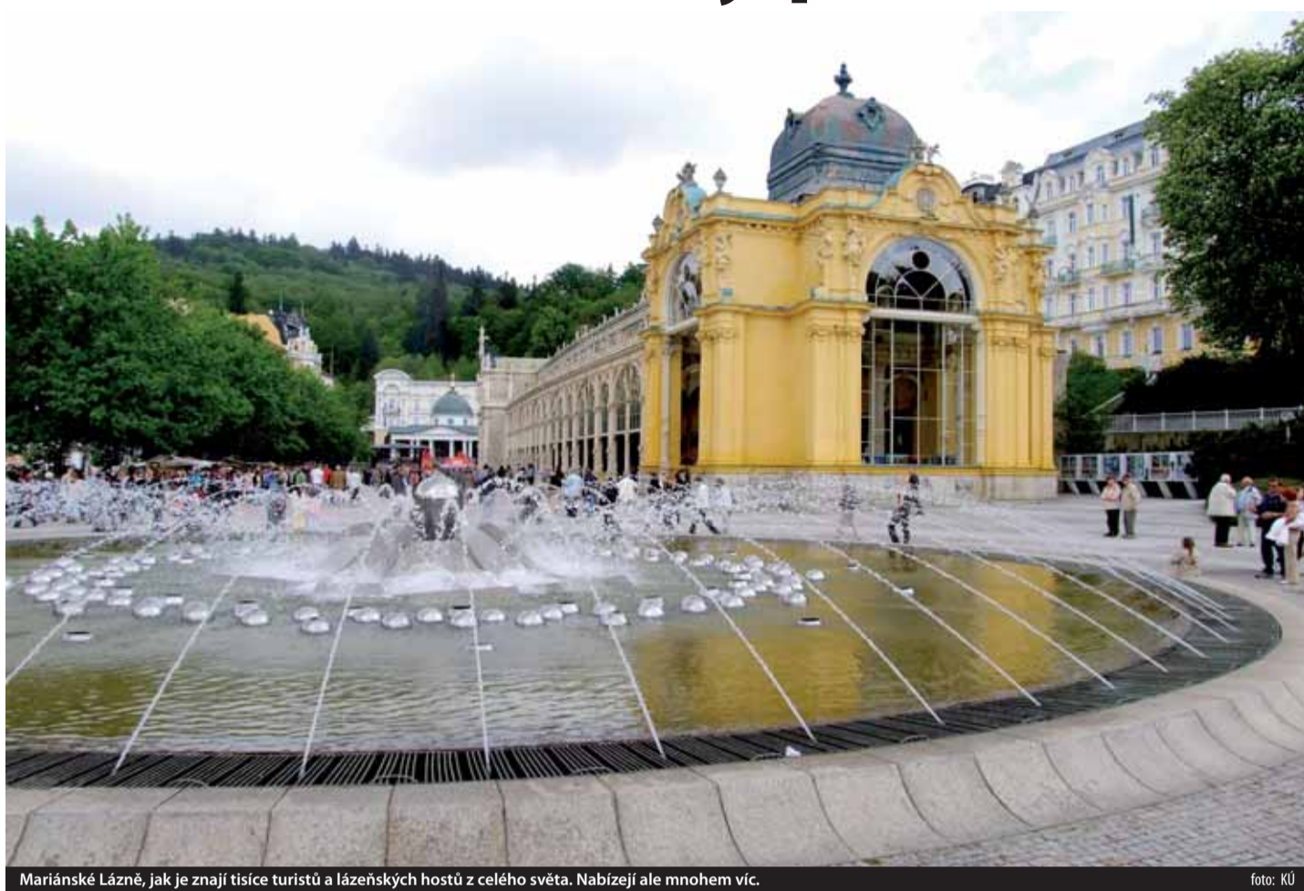
Mariánské Lázně, jak je znají tisíce turistů a lázeňských hostů z celého světa. Nabízejí ale mnohem víc.

Dalšími místy pro aktivní trávení volného času je hřiště na minigolf, tenisové kurty, bazény, sauny, solária, fitness-centra, jezdecká škola, jachting klub a půjčovna sportovních potřeb. Také je možné rybařit, jít na lov, lyžovat, věnovat se cykloturistice nebo prozkoumat zvláštní terén na běžkách. Rekreační mohou také