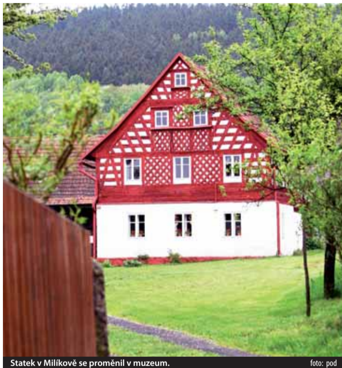
Statek v Milíkově se proměnil v muzeum.

Novinkou v nabídce turistických cílů Karlovarského kraje je od května statek Milíkov na Chebsku. Statek, který je chráněnou kulturní památkou loňském roce koupil Karlovarský kraj i s mobiliářem za 5 milionů korun. Do správy ho dostalo Krajské muzeum Karlovarského kraje, které ho nyní zpřístupnilo veřejnosti.