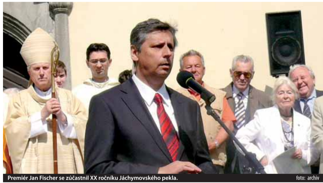
Premiér Jan Fischer se zúčastnil XX ročníku Jáchymovského pekla.

Podobné spory už v minulosti proběhly na nižší úrovni, na obcích. I zde byly podle zákona o střetu zájmů zbaveni někteří zastupitelé mandátů a nakonec jim byl vrácen.