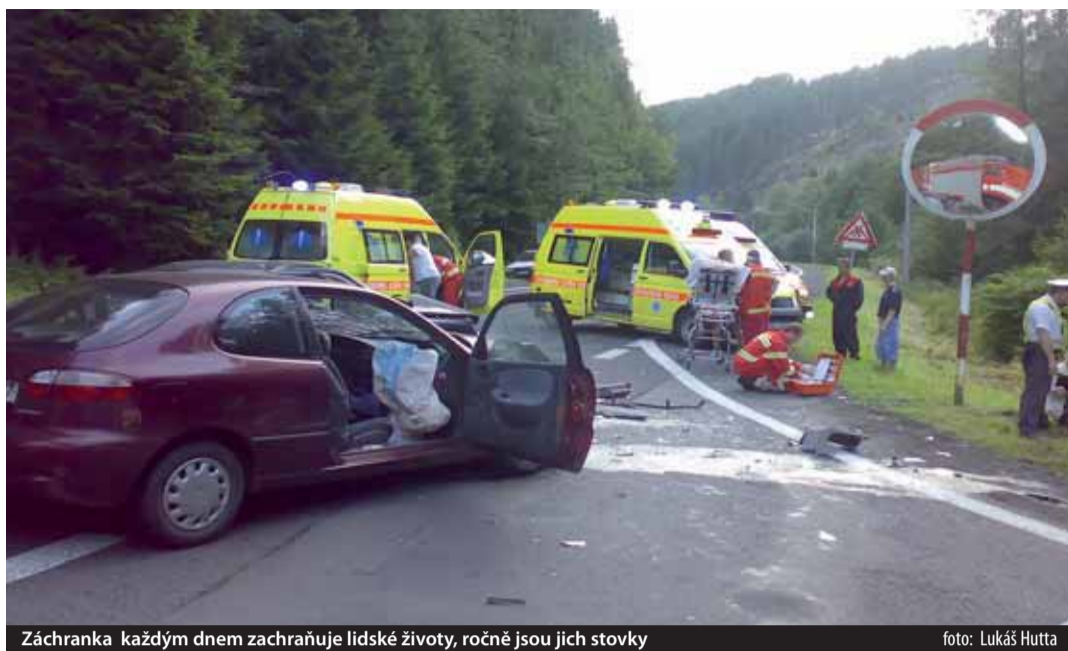
Záchranka každým dnem zachraňuje lidské životy, ročně jsou jich stovky

Výstavba nového výjezdového stanoviště Územní zdravotnické záchrané služby Karlovarského kraje v Horním Slavkově byla dokončena v září 2007. Kraj vynaložil na jeho vybudování celkem 12 milionů korun.