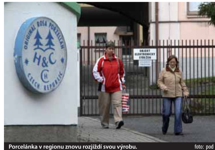
Porcelánka v regionu znovu rozjíždí svou výrobu.