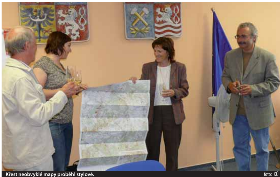
Křest neobvyklé mapy proběhl stylově.