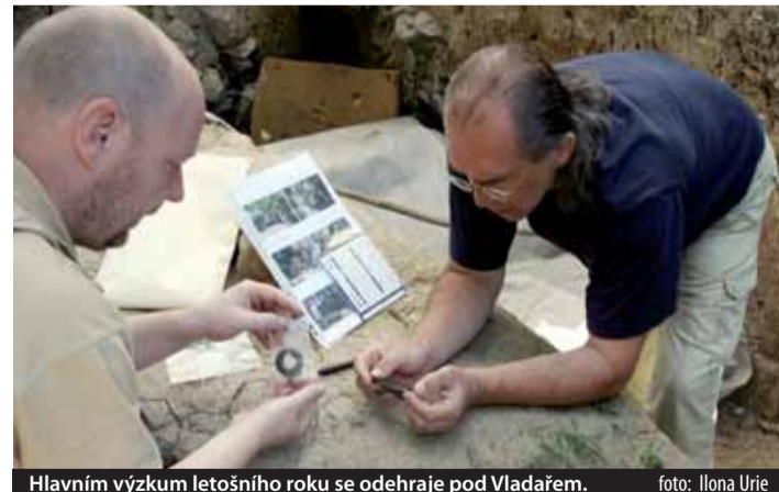
Hlavním výzkum letošního roku se odehraje pod Vladařem.