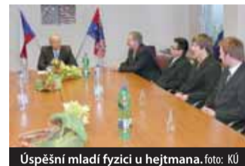
Úspěšní mladí fyzici u hejtmana.

Abyste studenti do mezinárodní soutěže, museli v republikovém finále vyřešit