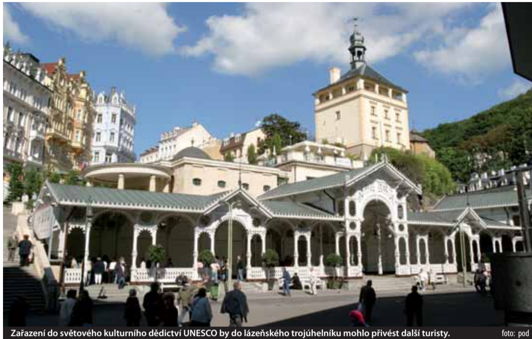
Zařízení do světového kulturního dědictví UNESCO by do lázeňského trojúhelníku mohlo přivést další turisty.

Právě na úskalí střetu ochrany památek s rozvojem měst upozornil při své nedávné návštěvě Karlovarského kraje i dnes už bývalý ministr kultury Václav Jehlička. Jak řekl, aby se města na seznam mohla vůbec dostat, je nutné změnit dosavadní přístup a daleko více spolupracovat při stavebních úpravách s památkáři. „Pokud zde