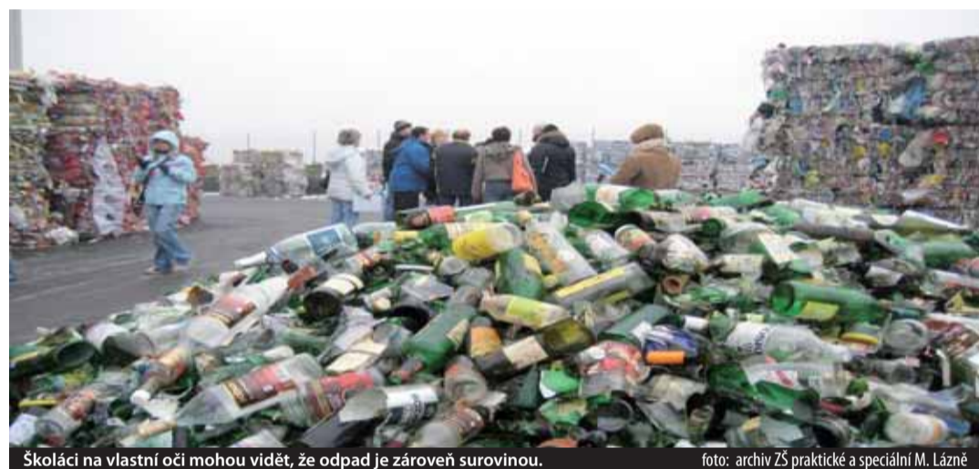
Školáci na vlastní oči mohou vidět, že odpad je zároveň surovinou.