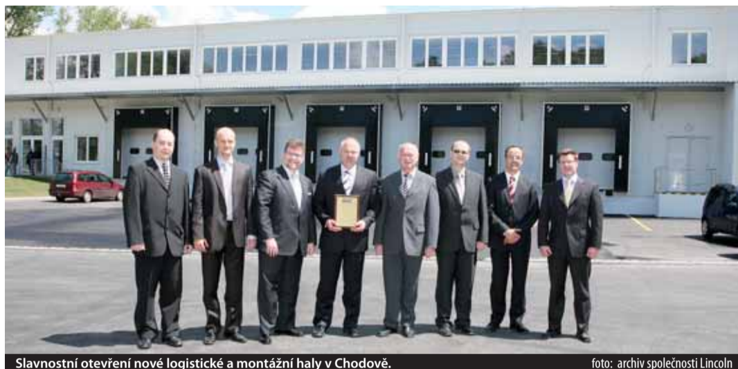
Slavnostní otevření nové logistické a montážní haly v Chodově.

vyrábějící stroje a zařízení pro těžký průmysl jako těžba a zpracování nerostných surovin, stavebnictví, ale též pro energetiku, především pro větrné