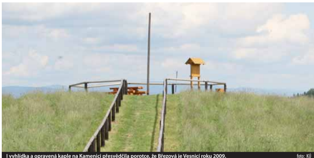
I výhledka a opravená kaple na Kamenici přesevěřila porotce, že Březová je Vesnicí roku 2009.

Březová na Sokolovsku se stala letošní Vesnicí roku Karlovarského kraje. Vybrala ji komise, složená ze starostů obcí, které uspěly v minulých roční-