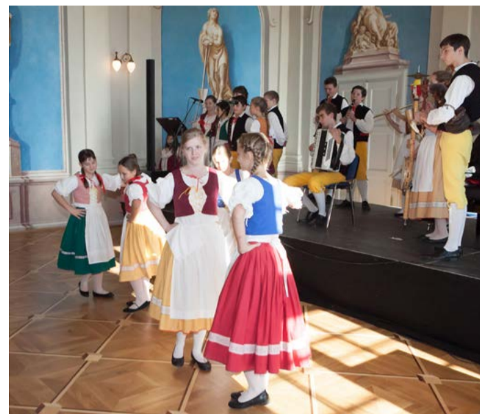
Folklorní soubor Rozmarynek ZUŠ Mariánské Lázně.