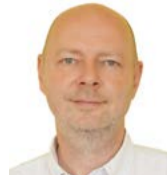
Petr Zahradníček náměstek hejtmana Karlovarského kraje, TOP 09 + STAN

Přestože nejsem vášnivý cyklista, musím právě je upozornit na velký problém, který doslova visí ve vzduchu... Jedná se totiž o lávku na Svatošských skalách, tedy jedno z nejnávštěvnějších míst páteřní cyklostezky podél řeky Ohře.