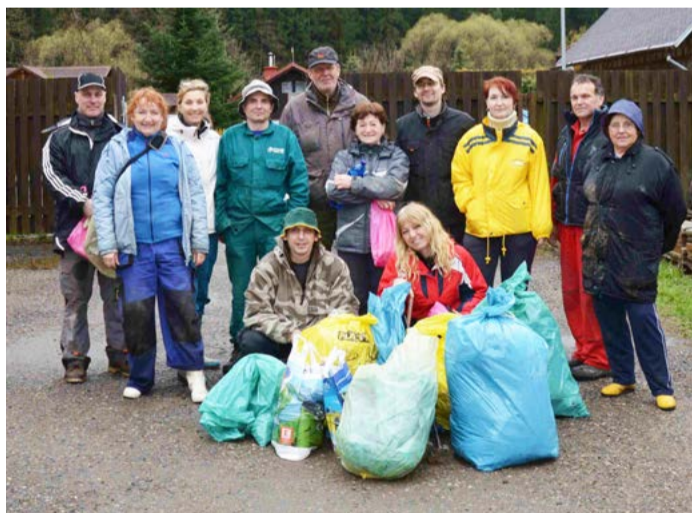
Obyvatelé obce se scházejí i při akci Uklidmě Valy.

Do konce dubna mohly obce z celé České republiky odevzdávat přihlášky do oblíbené soutěže Vesnice roku, která se letos koná již po dvaadvacáté. Z našeho regionu se o prestižní titul ucházelo devatenáct obcí. Vítězem krajského kola a držitelem Zlaté stuhu se nakonec staly Valy u Mariánských Lázní.