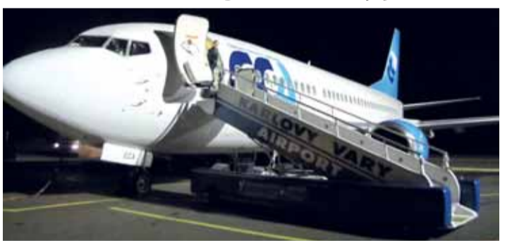
Boeing 737-300 v barvách CCA na karlovarském letišti

Letecké spojení bude zajišťováno letadlem typu Boeing 737-300 a palubní služby budou nabízeny ve dvou cestovních třídách, Business pro 20 cestujících a Economy pro 118 cestujících. „Linka Karlovy Vary - Jekatěrin-