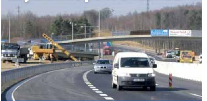
Od 3. dubna je na rychlostní silnici R 6 průjezdný most přes Ohři u Transmotelu ve směru z Chebu do Karlových Varů. V opačném směru se ještě do července musíme smířit s objížďkou přes Sokolov, protože nyní probíhá instalace navazujícího mostu nad železniční trať pro další dva pruhy komunikace. V plném profilu zde bude R 6 průjezdná do konce letošního roku.