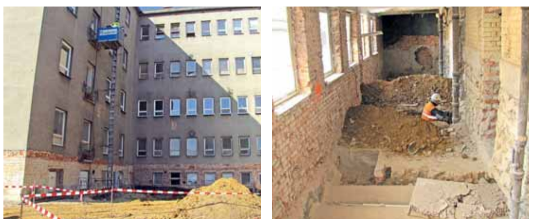
Rekonstrukce hlavního pavilonu chebské nemocnice je oficiálně zahájena! První etapa přijde na 120,3 milionu korun a přinese obnovu pravé části pavilonu včetně vybudování spojovacího koridoru mezi objekty B a C. Dokončena bude na konci února 2012.