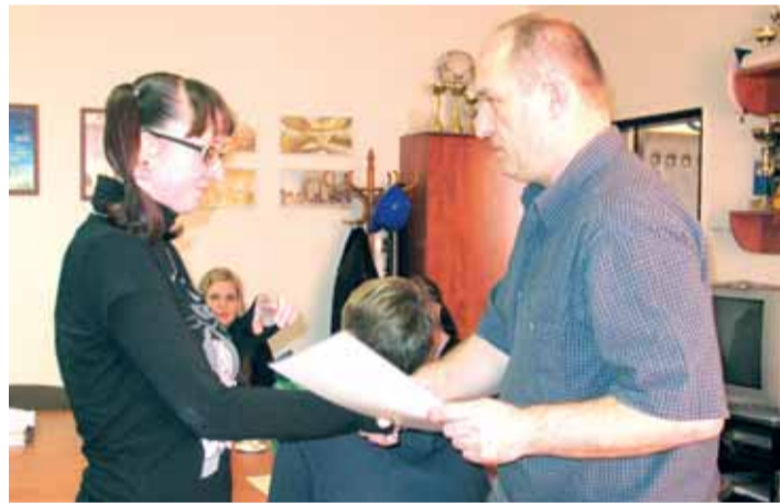
Žáci soutěžili ve finanční gramotnosti již podruhé.