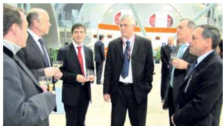
Ze slavnostního zahájení linky do Jekatěrinburgu

O necelý měsíc později, 21. dubna, zahájila jiná česká letecká společnost, Aerosvit Airlines, provoz další pravidelné vzdušné linky z Karlových Varů - do ukrajinského hlavního města Kyjeva a zpět.