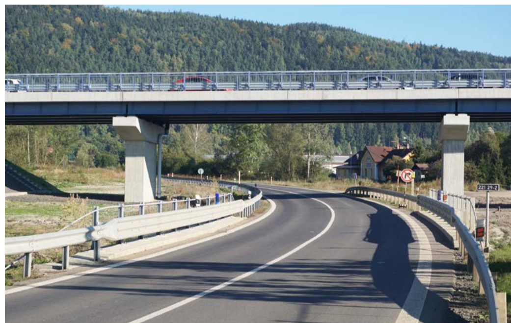
Nový obchvat Hroznětína