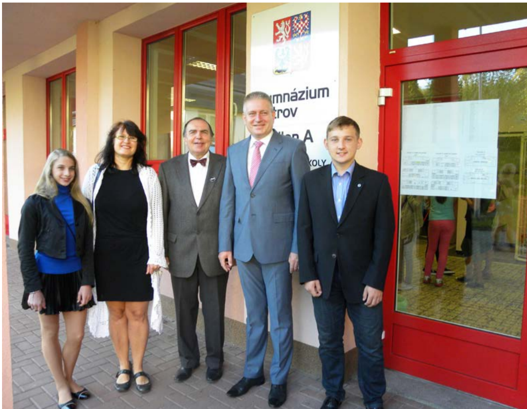
Hejtman Martin Havel (druhý zprava) s pedagogy a žáky gymnázia

Během setkání hovořil ředitel Gymnázia Ostrov o fungování, úspěších a zajímavostech školy. Hejtmanovi představil například galerii s fotografiemi všech významných osobností, které školu navštívily, či moderní 3D učebnu. Gymnázium získalo prostředky na její vybavení před dvěma lety z Operačního programu Vzdělávání pro konkurenceschopnost a využívá ji pro nové metody výuky. Slouží nejen pro zdejší studenty téměř ve všech předmětech, ale docházejí sem i žáci ze základních, mateřských a jiných středních škol.