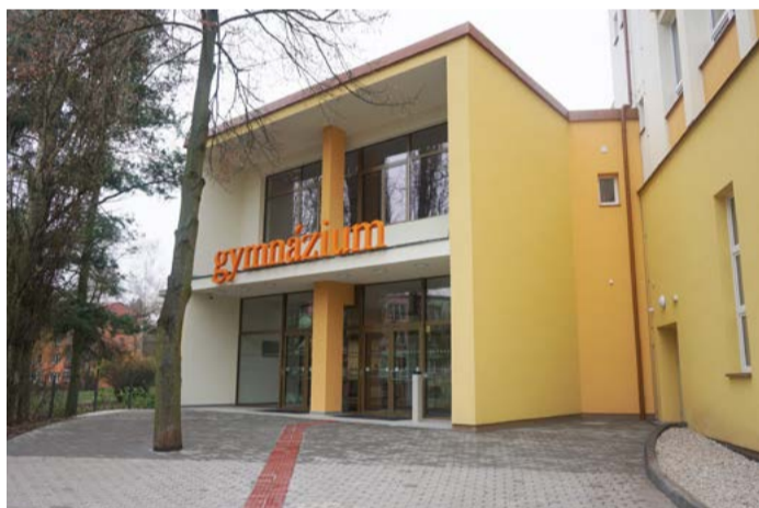
Nově opravené První české gymnázium Karlovy Vary

Postupně Karlovarský kraj zvelebuje i domovy pro seniory. Do lepšího komfortu a služeb pro ubytované penzisty Karlovarský kraj investoval za poslední čtyři roky 113 milionů korun, z toho