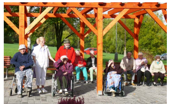
Postupná obnova Domova pro seniory „SKALKA“ v Chebu

Nastávající maminky mohou ocenit zrekonstruovanou porodnici v sokolovské nemocnici. Úpravy i nové uspořádání pavilonu za více než 21 milionů korun podstatně vylepšily prostředí a vybavení porodních sálů, pokojů pro rodičky, zázemí pro zdravotníky. Minulostí je i omšelý vzhled gynekologicko-porodnického oddělení Nemocnice v Chebu. Pavilon C, v němž lékaři a sestry o maminky pečují, se dočkal nové fasády za 3,5 milionu korun. Mezitím finišují přípravy na kompletní dokončení chebské nemocnice, kde do roku