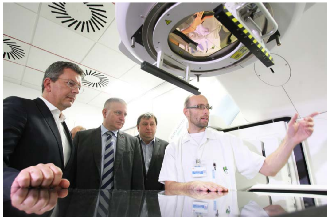
Moderní lineární urychlovač v chebské nemocnici