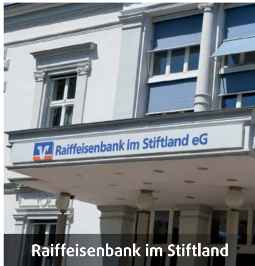
Raiffeisenbank im Stiftland