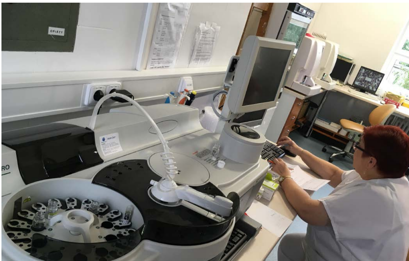
Prvním krokem vedoucím k rekonstrukci byla výstavba nových prostor pro laboratoře OKBH