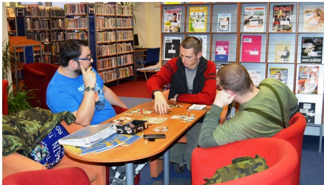
Herní klub V A-klubu knihovny působí několik let oblíbený Herní klub, kde se pravidelně scházejí milovníci stolních her ke čtvrtému hraní. Oblíbené jsou hry s příběhem.