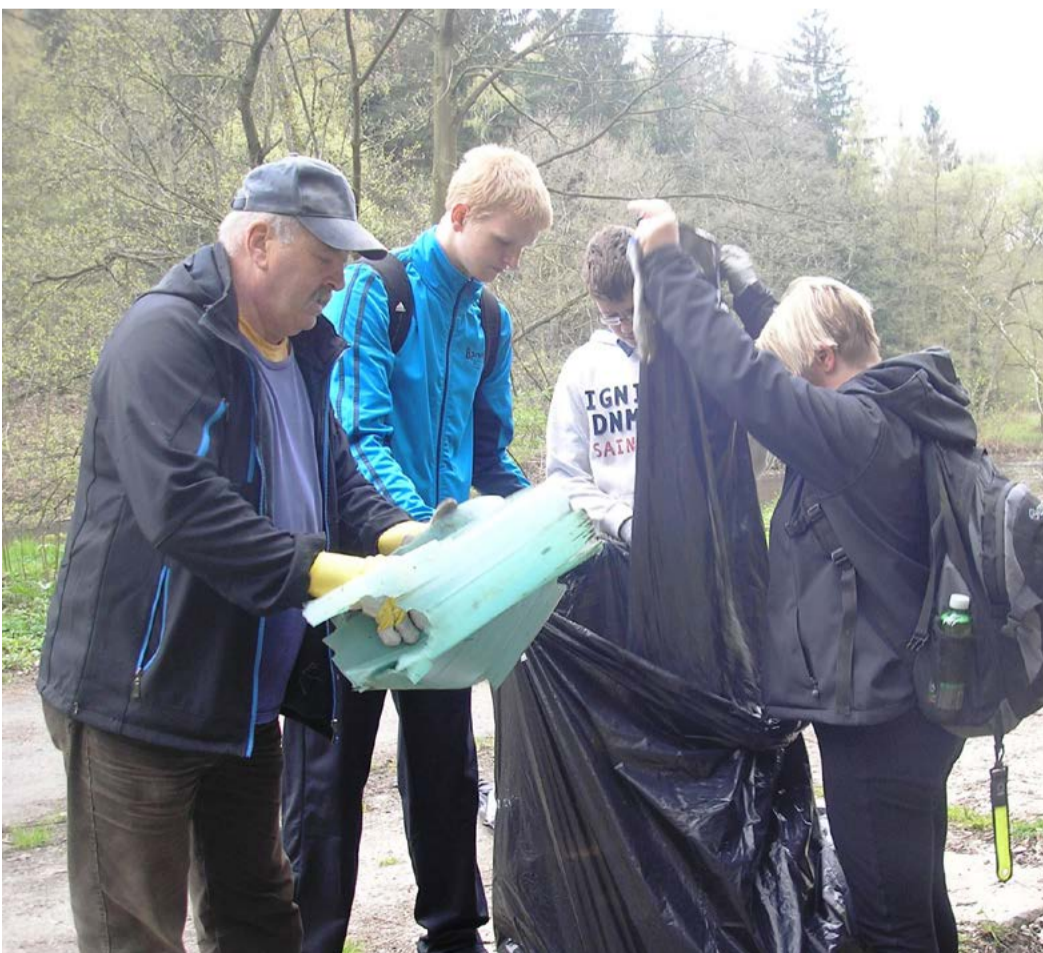
Čištění řeky Ohře V roce 2016 nasbírali dobrovolníci v rámci akce přes 2,23 tun odpadků.