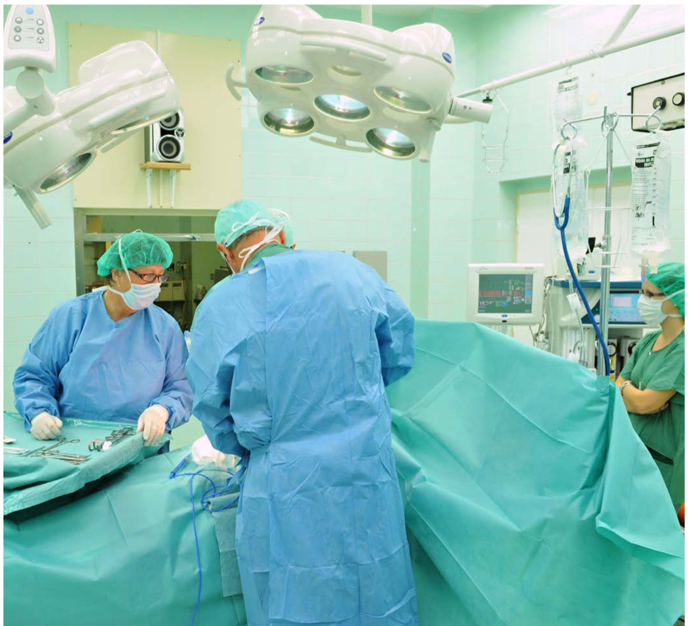
Moderní operační sály už brzy zdravotníkům nabídne nový pavilon v nemocnici v Chebu.