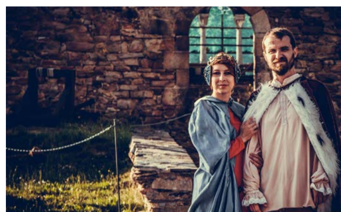
Královský pár Na chebském hradu.

Pro něj celá akce jako pro autora byla jistě náročnou výzvou spojenou s obrovskou zodpovědností za divadelní seriál, za herce a v neposlední řadě také za příchodícího diváka. Stejně zodpovědné, ne-li zásadní, muselo být rozhodnutí o obsazení klíčové postavy všech inscenací, tedy postavy Karla IV. V.