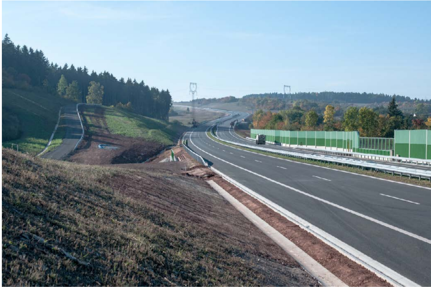
Čtyři kilometry D6 V posledních letech se na dálnici podařilo pouze dokončení úseku Lubenec – Bošov.