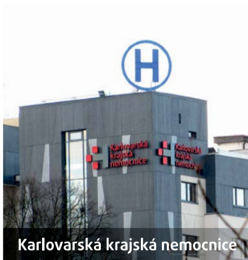
Karlovarská krajská nemocnice