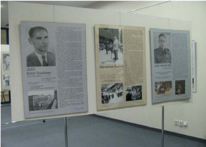
Stín na duši Ze vzpomínek pamětníků holocaustu.