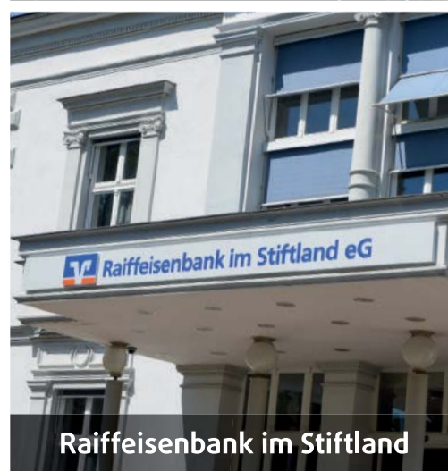
Raiffeisenbank im Stiftland