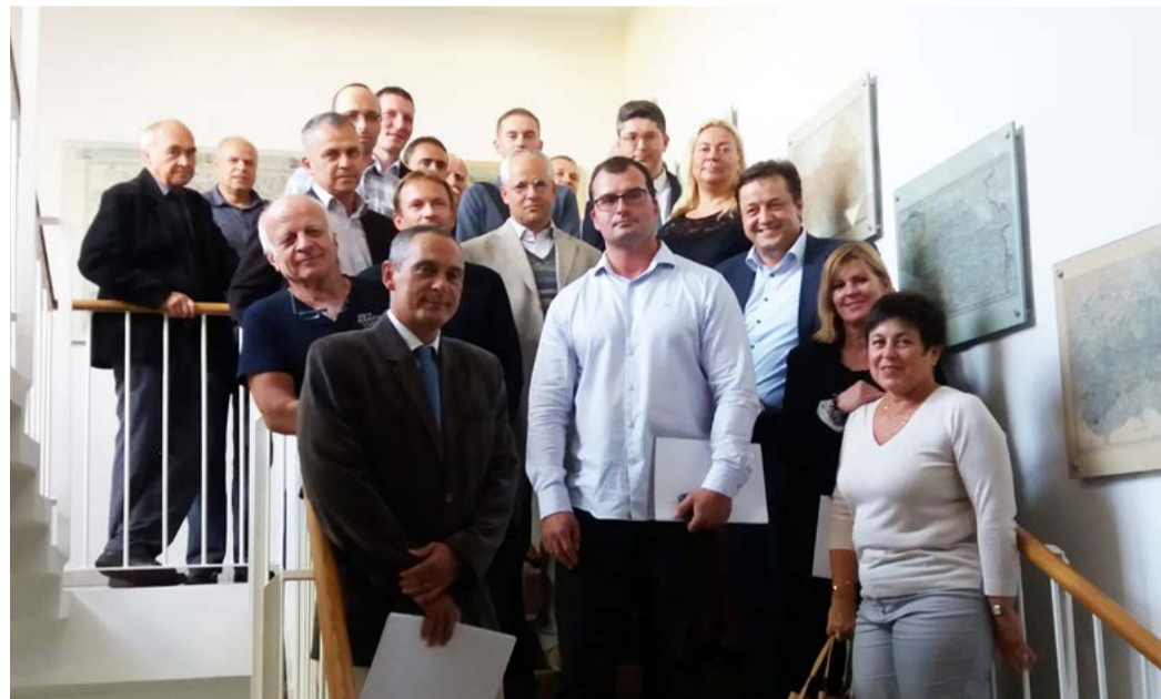
Krajské lékařské odborníky převzali jmenovací listiny.