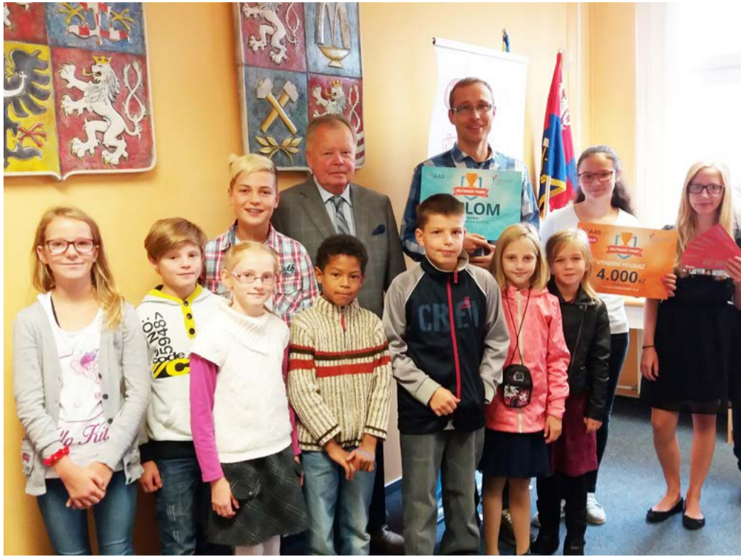
Držitelé Hejtmanova poháru se sešli na krajském úřadě