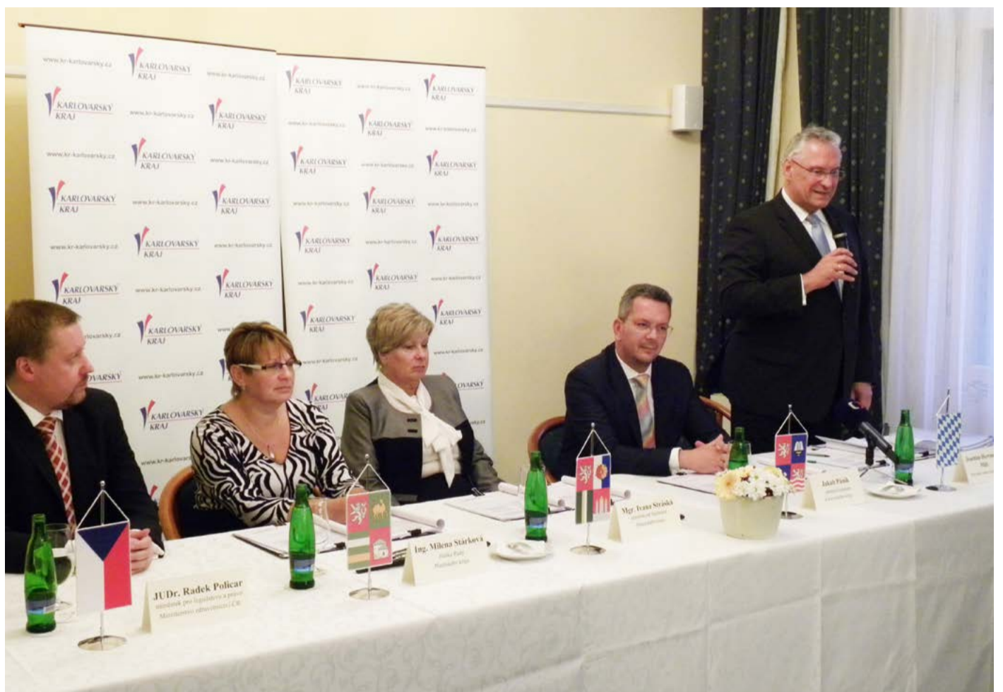
Aktéři podpisu smlouvy o přeshraniční spolupráci záchranek v karlovarském GH Pupp

Obdobnou smlouvu podepsali v listopadu 2015 hejtmáni Karlo-