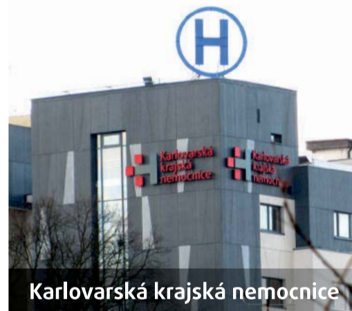
Karlovarská krajská nemocnice