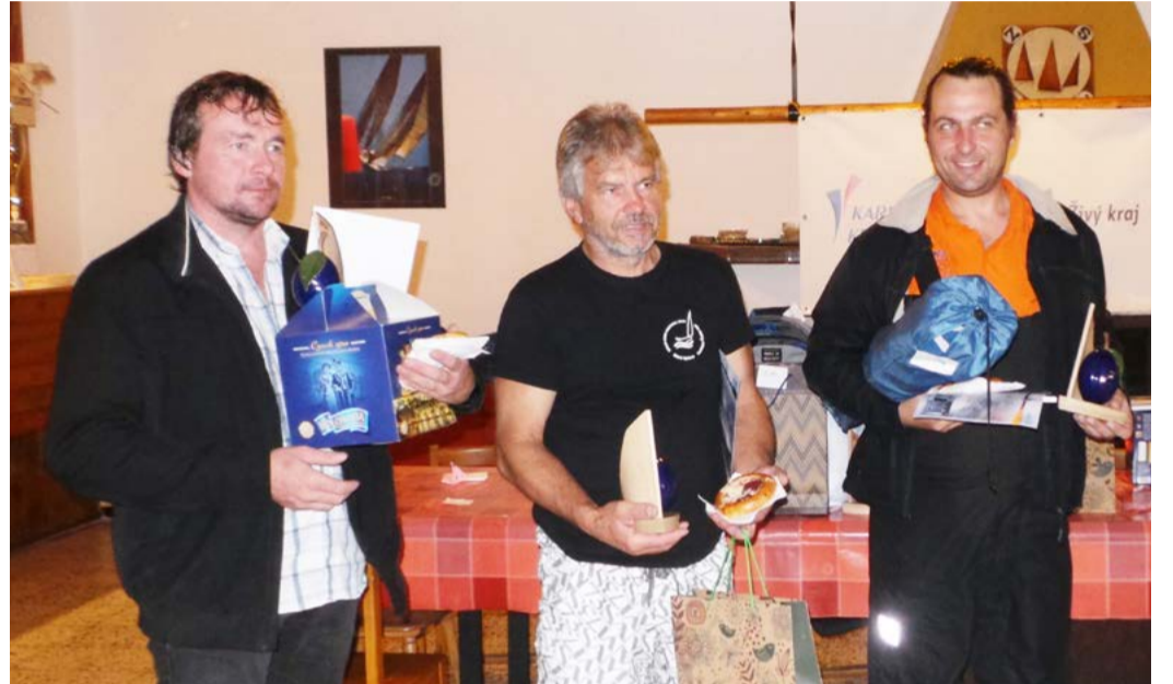
Vítězné lodní třídy Finn 51. ročníku Švestkové regaty