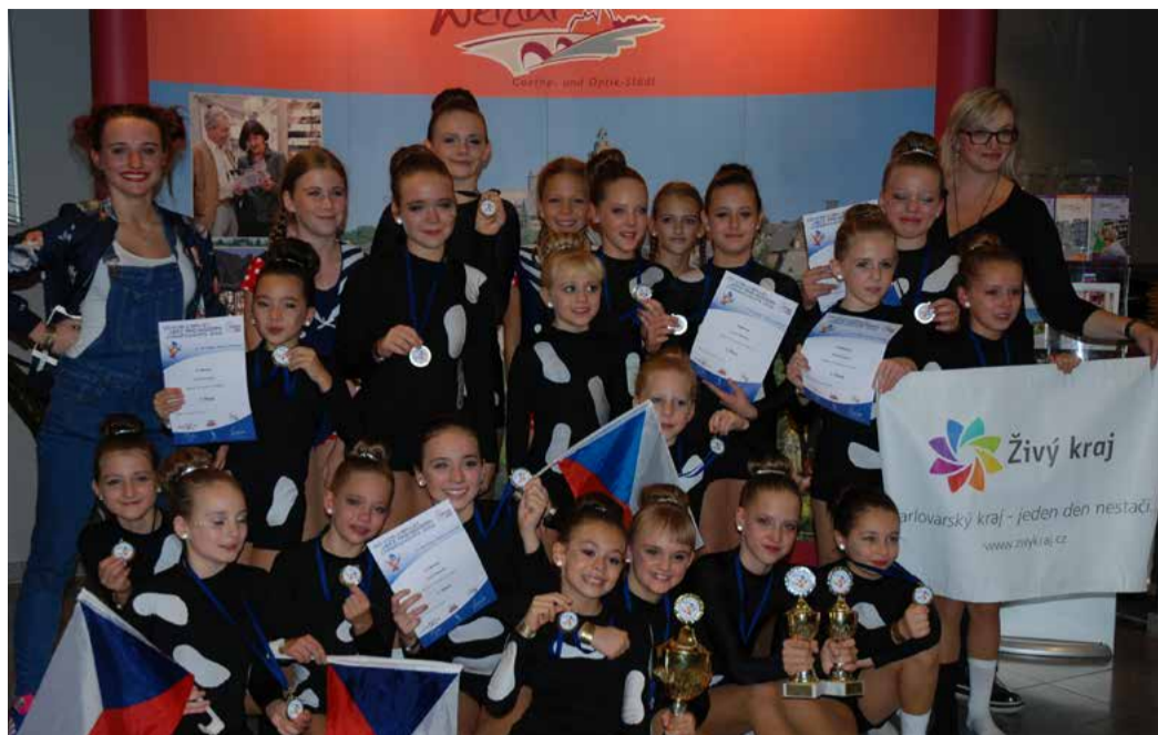
Mirákl uspěl na světovém šampionátu s vystoupením „Nohy“

Mistrovství světa v moderním a jazzovém tanci (letos v německém Wetzlaru) se tradičně neobešlo bez tanečnické skupiny Mirákl. Ta si v soutěži České taneční organizace vytyčila 15 nominací v dětské, juniorské i dospělé kategorii. Dětským tanečnickům se nakonec podařilo obhájit příčku nejvyšší. „Navázat na úspěch