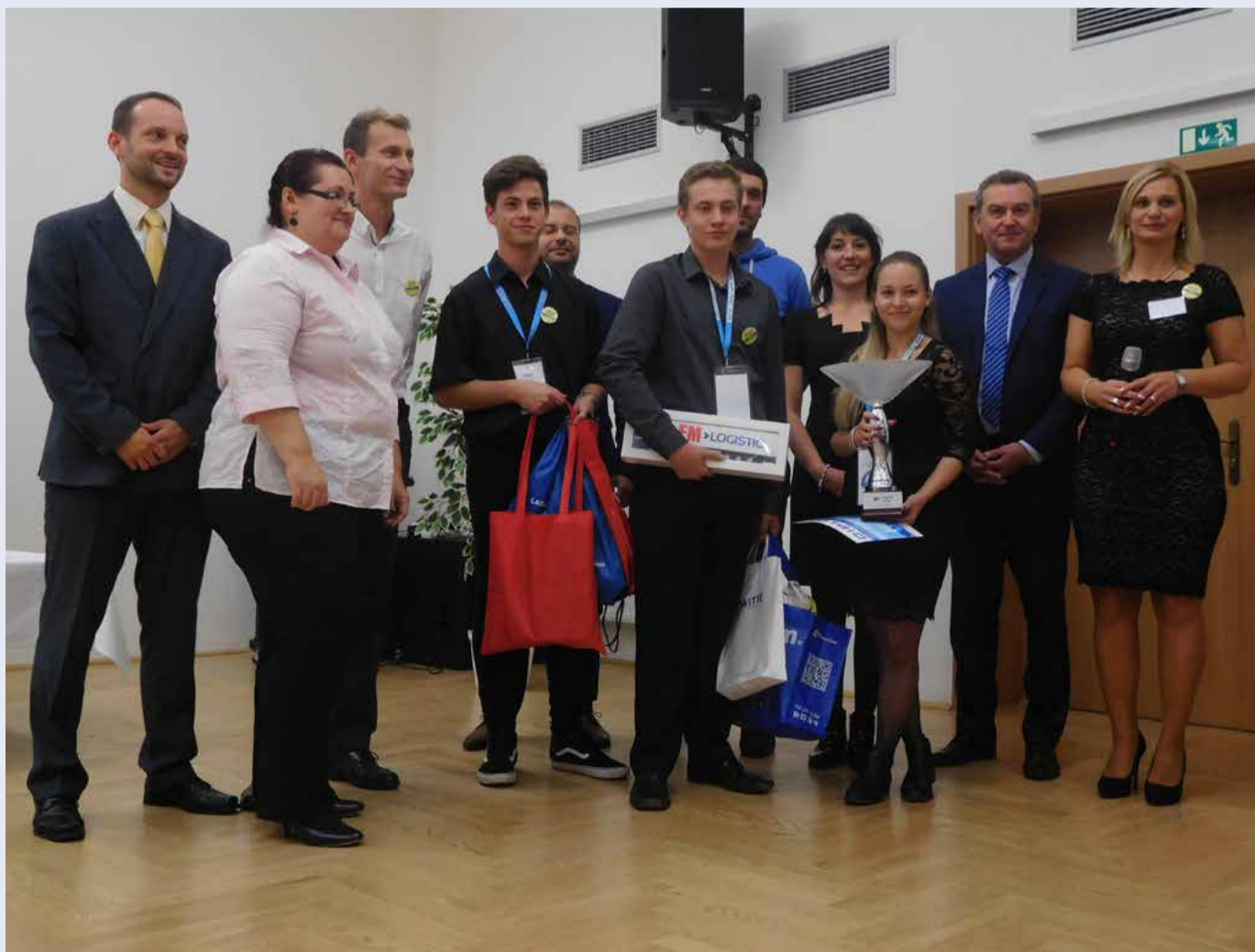
Vítězné družstvo dalovické logistické školy s cenou

Putovní pohár za vítězství v soutěži „Logistik Junior SS“ získala v polovině října krajská Střední škola logistická v Dalovicích. Svůj úspěch vybojovali dalovičtí studenti v konkurenci jedenadvaceti družstev ze čtrnácti škol například z Olomou-