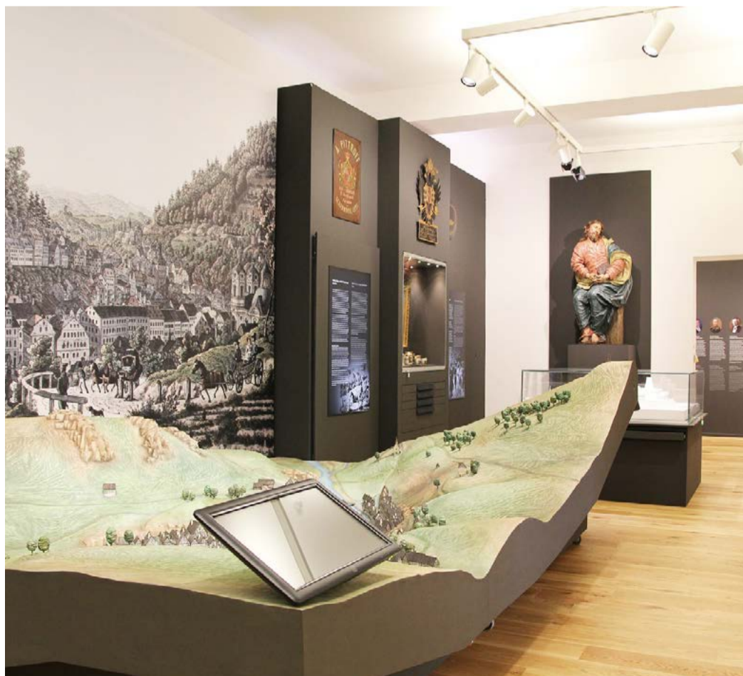
Stálá expozice U příležitosti 150 let své existence získala expozice v Muzeu Karlovy Vary na Nové louce zcela novou podobu.

kteří ještě nikdy nebyly veřejnosti prezentovány, či exponáty, které byly vytvořeny speciálně pro novou expozici. Mezi nimi například faksimile zakládací listiny Karlových Varů - privilegium Karla IV. ze 14. srpna 1370, respektive její tereziánský opis z roku 1747, protože originál se nedochoval. Vedle množství interaktivních prvků doplňuje expozici i Haptická nebo-li dotyková stezka s heslem „exponátů dotýkat se povoleno“ a Dětská stezka, kterou si musí malí návštěvníci v každém sále najít. Muzeum se změnilo stavebně - vstupní vestibul je mnohem přívětivější než býval, návštěvníkům s omezenou pohyblivostí je k dispozici výťah, projekt pamatoval i na konferenční místnost, samoobslužnou šatnu a odpočinkovou zónu. Součástí sálů pro krátkodobé výstavy v přízemí bude i přilehlé nádvoří, které zejména v létě bude sloužit pro vystavení uměleckých solitérů. Nádvoří bude rovněž sloužit jako oddechová zóna pro veřejnost. Celou akci financoval Karlovarský kraj. (KÚ)