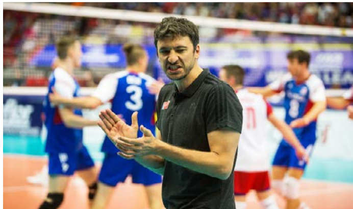
MIGUEL FALASCA Španělský kouč českého národního týmu chce na turnaji v Karlových Varech zajistit pro svůj tým účast na světovém šampionátu v roce 2018.