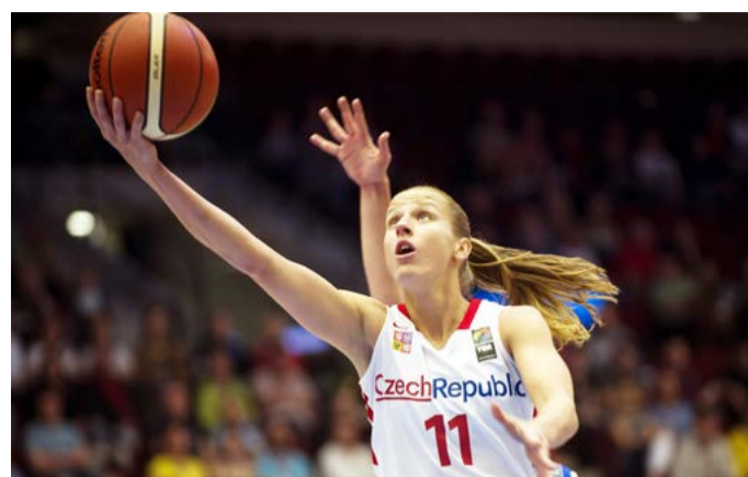
MEZINÁRODNÍ TURNAJ ŽEN V KARLOVÝCH VARECH Evropský šampionát budou od 16. do 25. června hostit Praha a Hradec Králové. Na turnaji na západě Čech si české basketbalistky poprvé vyzkouší svou aktuální formu po dvou týdnech regenerace, kondiční a basketbalové přípravy.