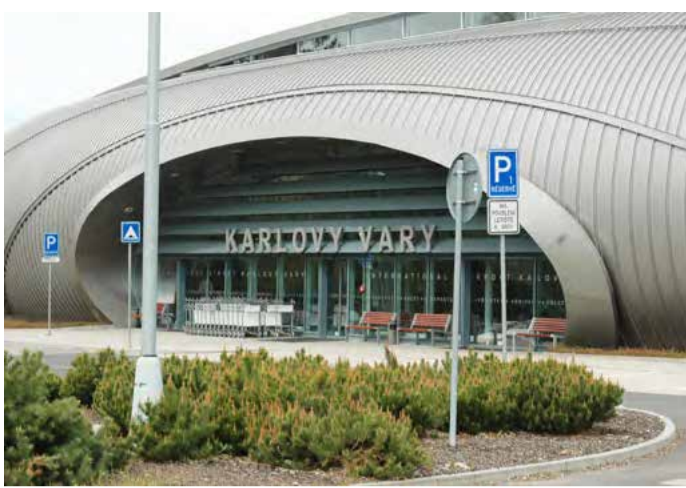
F AIR v Karlových Varech. Budoucí piloti civilních letadel by měli k výcviku využívat místní mezinárodní letiště.

„Je to pro nás jedinečná příležitost, jak do našeho regionu přivést mezinárodní školu, vytvořit nová pracovní místa a zároveň oživit provoz na letišti v Karlových Varech, pro které to bude mít nezanedbatelný finanční přínos. Díky tomu na sebe karlovarský region také přitáhne pozornost leteckých společností. Projekt se samozřejmě neobejde bez drobných investic do vybudování potřebného zázemí, jako jsou například hangáry pro