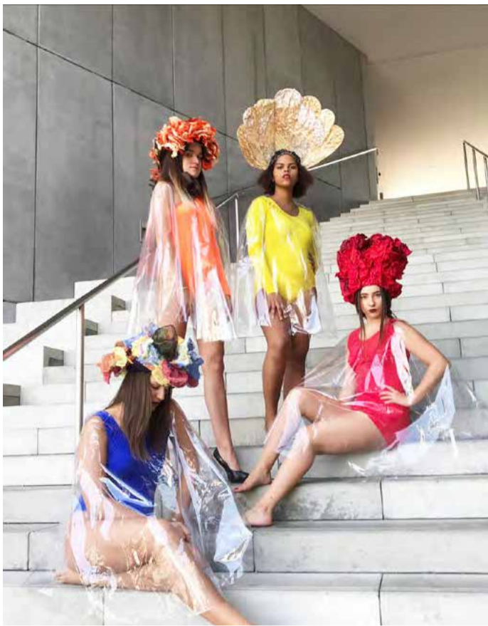
Oděv a textil, Liberec 2018 První místo a speciální ocenění si ze soutěže odvezli studenti oboru Oděvní design ze Střední uměleckoprůmyslové školy Karlovy Vary.

Soutěž „Oděv a textil, Liberec“ je pořádána od roku 2014. Ačkoliv má poměrně krátkou historii, je pojata velmi velkoryse a odehrává se v krásných prostorách moderního komplexu Technické univerzity. Pravidelně se jí zúčastňují střední školy textilního i oděvního zaměření z celé České republiky i ze Slovenska. Výjimkou nejsou ani základní školy, pro něž je rovněž připravena vlastní soutěžní kategorie. (KÚ)