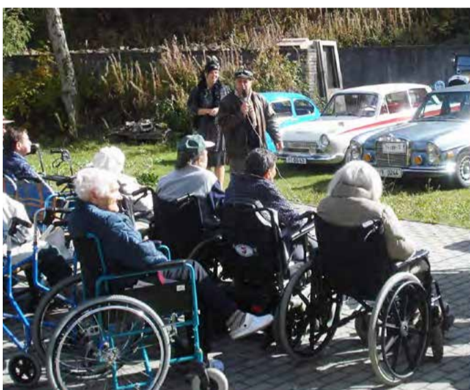
Setkání s veterány. Mezi osmnácti automobilovými veterány a dvěma motocykly se vyznamenaly výjimečné kousky značek Chrysler, Citroen, Ford, Praga, Fiat, Lada, Warburg, Mercedes, Triumph Royal i Škoda.