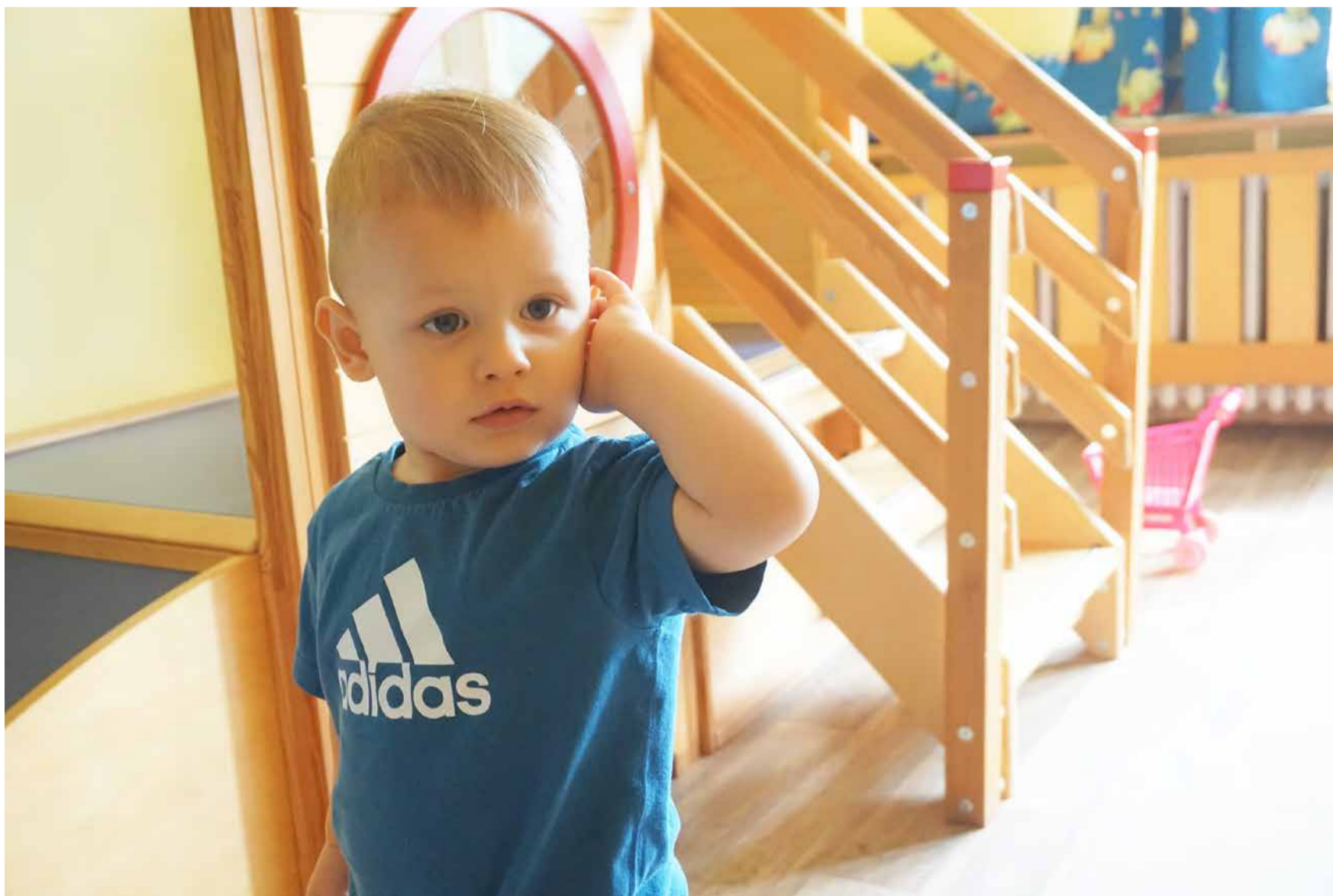
Krajské jesle V současnosti je přihlášeno 10 dětí, pro dalších 5 se ještě nabízí volné místo.