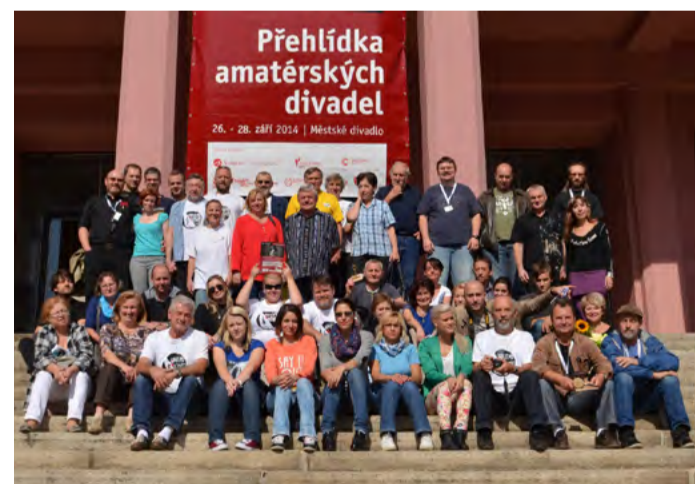
Sokolovská čurda 2018 Ochotnické soubory sehraji letos v Sokolově v rámci divadelní přehlídky osm divadelních představení.