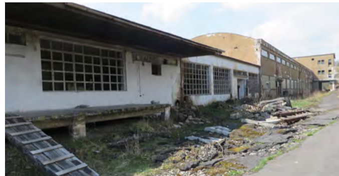
Brownfield - bývalému areálu továrny Jitona může pomoci i program RE:START

V současné době je v řešení s vládou aktualizace RE:STARTu, ve které je 27 opatření. Jako příklad je možné zmínit investice do regionálního zdravotnictví, obnovu kulturních památek, modernizaci podnikatelských nemovitostí, modernizaci středních škol a jejich zázemí včetně dílen, opravu silnic, rozvoj čisté mobility obnovou vozového parku ve veřejné dopravě ve městech a dalších.