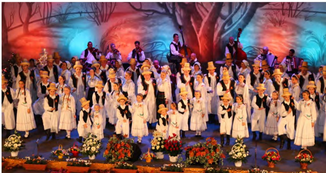
Večerní gala Tradičnímu programu na jevišti velkého sálu lázeňského hotelu Thermal bude v Karlových Varech předcházet krojovaný průvod centrem města.