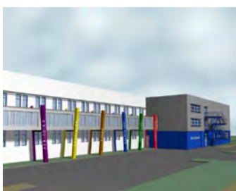
Studie Nový depozitář krajské knihovny.

Krajská knihovna se již od počátku své existence potýká s nedostatečnou kapacitou skladovacích prostor. Karlovarský kraj proto připravil projekt na výstavbu nového depozitáře a v únoru letošního roku předložil žádost o poskytnutí dotace do Integrovaného re-