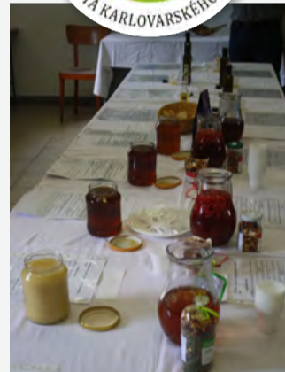
Dobrota Karlovarského kraje 2018 V pěti soutěžních kategoriích posuzovala hodnotitelská komise výrobky od celkem 17 producentů z regionu.