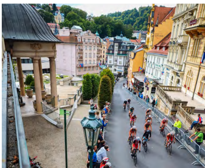
Změna na trase. Pořadatelé přesunuli druhé depo a cíl na Divadelní náměstí, odkud je to jen kousek k divácky atraktivnímu stoupání na Zámecký vrch.