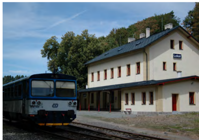
Nádraží už září novotou V Kynšperku nad Ohří i Lokti teď naleznou cestující vlakem moderní prostředí.