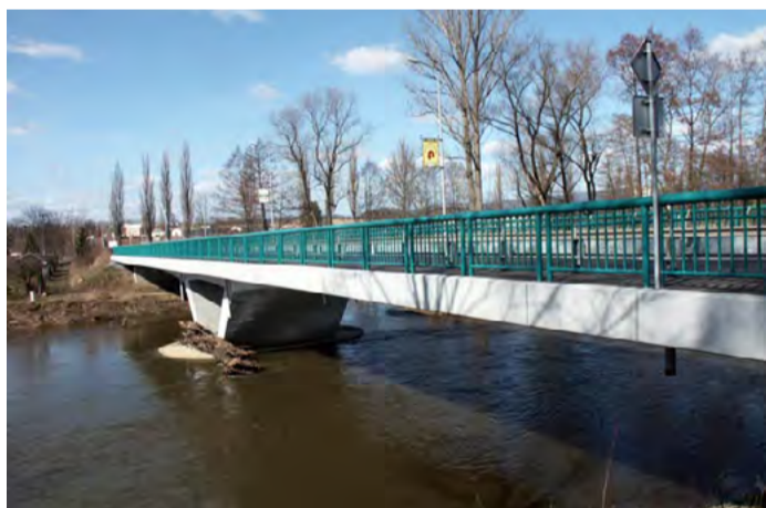
Most v Doubí Diagnostický průzkum z listopadu 2015 ukázal na potřebu sanace nosné konstrukce, na karlovarském mostě se však provádějí i další opravy.

První zastávkou se staly mosty v Žalmanově na silnici I/6, kde se kromě rekonstrukce obou mostů opravovala i objízdná komunikace. „Původní termín dokončení stavby je 17. listopadu letošního roku. Se zástupci společnosti Eurovia jsme se dohodli, že by bylo možné zkrátit termín na 15. října. Podobně jsem požádal stavebníky i na mostě v karlovarském Doubí. Velmi bychom ocenili, kdyby stavba namísto v polovině listopadu byla hotova do 30. října, protože jde o velmi důležitou spojnicí pro celé město Karlovy Vary. Samozřejmě je pro nás ale záro-