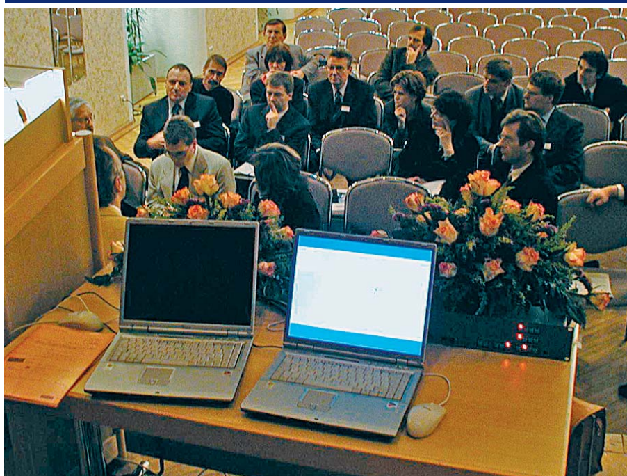
Problémy společného evropského regionu budou řešit společné pracovní skupiny z Karlovarského kraje, Bavorska a Saska. Jejich členové začali pracovat již na zahajovací konferenci.

Zlepšení spolupráce při odstraňování následků živelních katastrof, užší kooperaci v oblasti řešení krizových situací, turistického ruchu, spolupráce měst a obcí, dopravy a životního prostředí má přinést Karlovarskému kraji i vládním regionům Horní Franky a Chemnitz nový projekt CLARA@eu. Jeho zahajovací konference proběhla 8. prosince ve Stadthalle v hornofrankenském Bayreuthu.