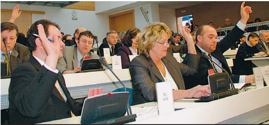
Dne 9. prosince 2004 se uskutečnili první jednání nově zvolených krajských zastupitelů. Ti převzali osvědčení a složili zastupitelský slib. Poté se hned pustili do práce. Na programu jednání měli 22 bodů.