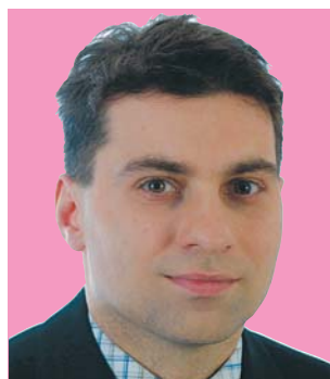
TOMÁŠ HYBNER (ČSSD) 13. června 1972 NÁMĚSTEK PRÍMÁTORA, KARLOVY VARY