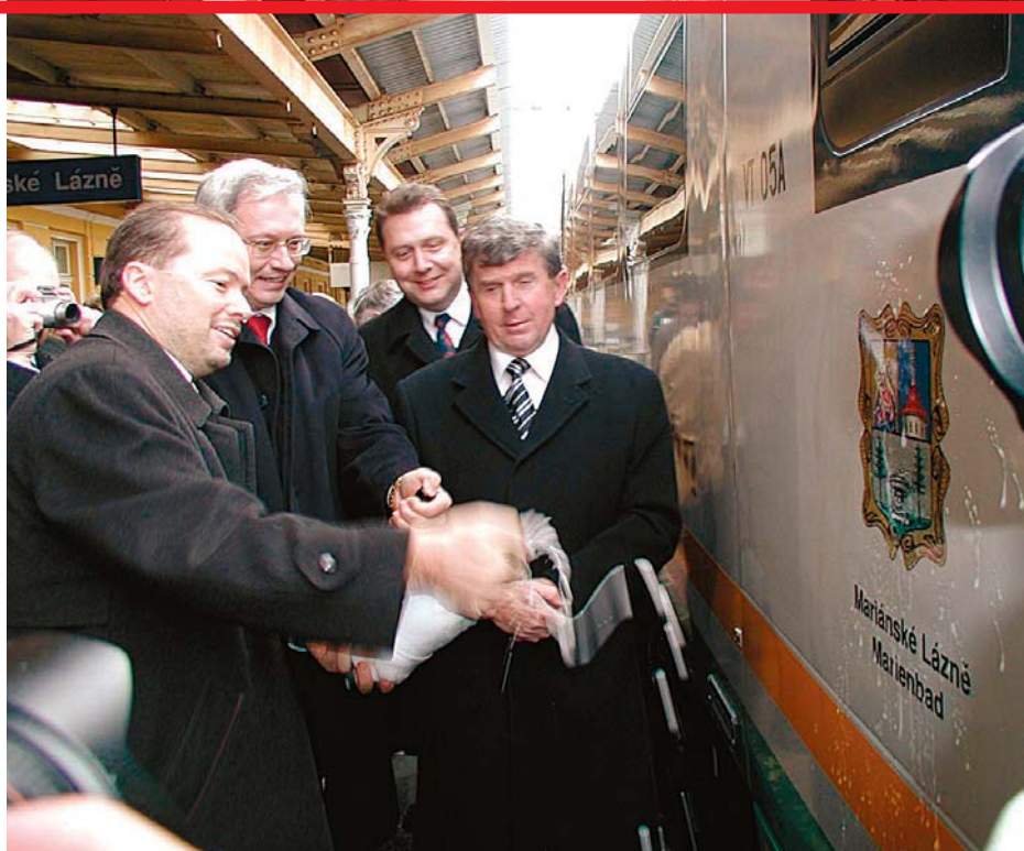
Vlak DESIRO nese jméno města Mariánské Lázně, do kterého dvakrát denně zajíždí.