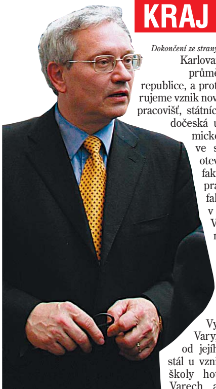
Dokončení ze strany 1

Systém by v této podobě mohl do pěti let fungovat naplno, bude ale muset být stále živý a přizpůsobovat se vývoji života v regionu.