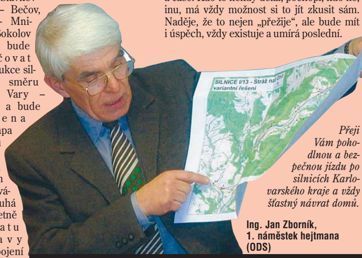
Přeji Vám pohodlnou a bezpečnou jízdu po silnicích Karlovarského kraje a vždy šťastný návrat domů.

Kraj vlastní „své“ silnice dva roky. Není vůbec jednoduché korektně zmapovat jejich stavební stav, navrhnout a prosadit nezbytná opatření, zajistit jejich stavební přípravu a navíc zajistit financování v potřebné výši a čase. Kdo to někdy dělal, pochopí, kdo ne, inu, má vždy možnost si to jít zkusit sám. Naděje, že to nejen „přežije“, ale bude mít i úspěch, vždy existuje a umírá poslední.