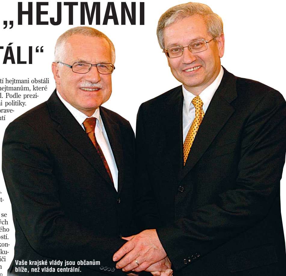
Vaše krajské vlády jsou občanům blíže, než vláda centrální.

První a zároveň zatím i poslední krajské volby před čtyřmi roky skončily úspěchem ODS. V čele osmi ze 13 krajů, kde se v listopadu uskutečnila volba, stojí právě členové této strany. Celkem budou voliči v Česku vybírat při listopadových volbách v celé zemi 675 krajských zastupitelů, jejichž funkční období bude opět čtyřleté.