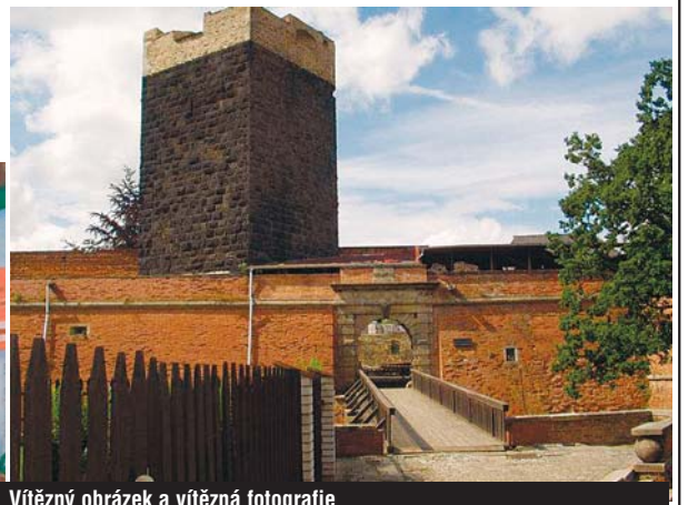
Vítězný obrázek a vítězná fotografie