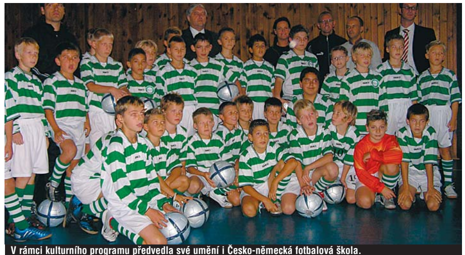
V rámci kulturního programu předvedla své umění i Česko-německá fotbalová škola.