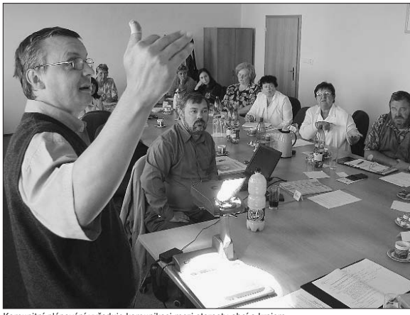
Komunitní plánování vyžaduje komunikaci mezi starosty obcí a krajem

V prvním vydání se objeví kolem jednoho sta zařízení poskytujících sociální služby ze