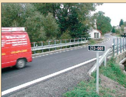
Souvislá oprava silnice u Hrzína včetně obnovení původních propustků a prohloubení příkopů stála Karlovarský kraj zhruba 4,5 milionu korun.