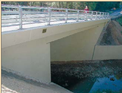
Most nedaleko Kojšovic na Toužimsku po opravě, která trvala dva měsíce a stála více než 4 miliony korun, opět slouží motoristům.