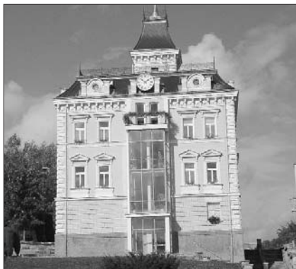
Zrekonstruovaná budova městského úřadu je jedním ze tří míst, kde najdete městské úředníky. Na přestěhování úřadu do jedné budovy vznikne peníze.

Na tomto místě Vás budeme pravidelně seznamovat s jednotlivými obcemi a městy v Karlovarském kraji. Tentokrát se podíváme do Aše.