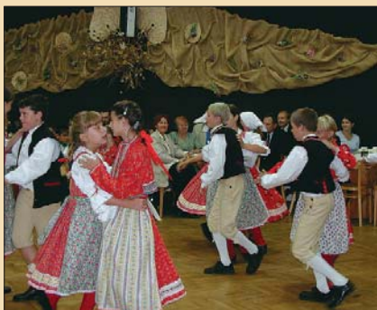
Na karlovarském folklórním festivalu vystoupil také dětský soubor Dyleň.