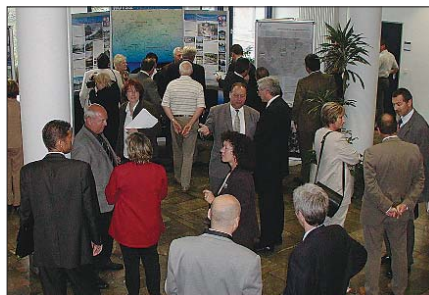
Informační panely Karlovarského a Ústeckého kraje si prohlíželi účastníci setkání Chemnitz.

„Představil jsem například naše průmyslové zóny v Aši, Chodově, Chebu nebo Ostrově. To zajímalo německé podnikatele, kteří jsou zvědaví, co jim v této oblasti můžeme nabídnout. Někteří chtěli znát investiční možnosti, které se jim