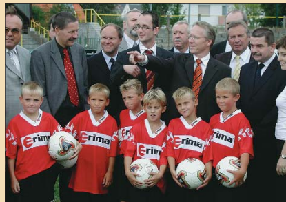
Bavorský ministr životního prostředí a zdraví Werner Schnappauf (s nataženou pravici) a náměstek hejtmana pro školství a sport Petr Horký (vpravo) zahájili 2. ročník česko-německé fotbalové školy pro děti od 8 do 10 let. Škola střídavě trénuje děti v německém Hofu a Františkových Lázních. Součástí je i výuka německého a českého jazyka.