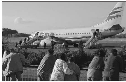
Vláda souhlasí s převodem letiště na Karlovarský kraj