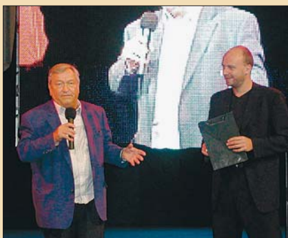
Při zahájení 36. ročníku festivalu Tourfilm v Karlových Varech se návštěvníkům představil světoznámý publicista Erich von Däniken (vlevo)