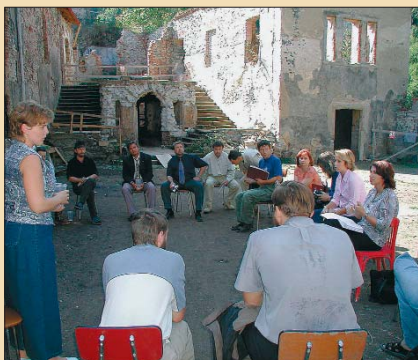
Majitelé hradů a zámků se sešli se zástupci krajského úřadu na Horním hradech poblíž Ostrova. Karlovarský kraj jim finančně pomáhá při opravách památkových objektů.