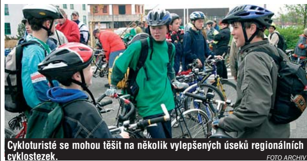
Cykloturisté se mohou těšit na několik vylepšených úseků regionálních cyklostezek.