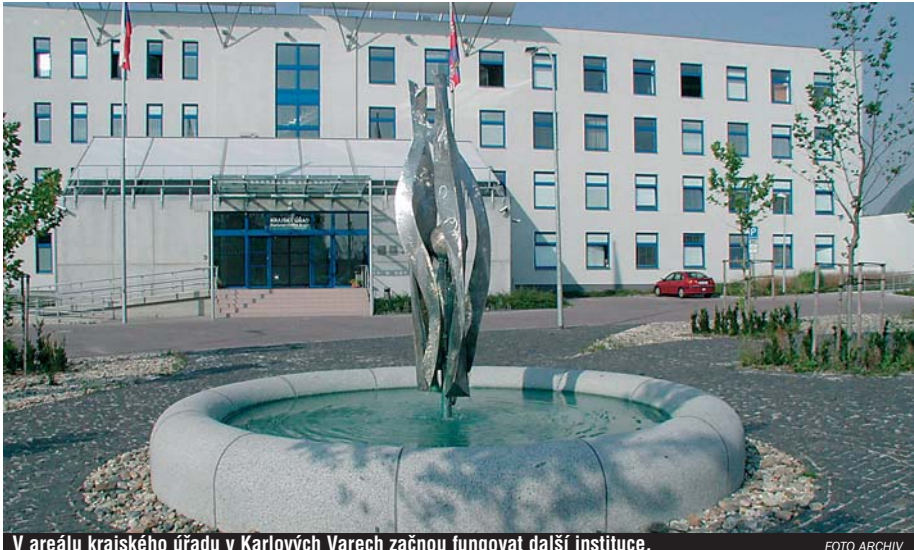
V areálu krajského úřadu v Karlových Varech začnou fungovat další instituce.