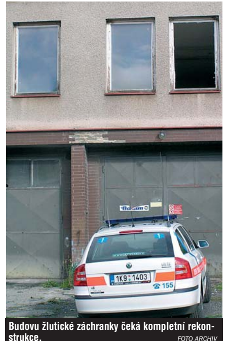
Budovu žlutické záchranky čeká kompletní rekonstrukce.

„V současné době probíhá zpracování projektové dokumentace a stavební řízení pro vydání stavebního povolení. Předpokládáme ukončení projektových prací a předání dokumentace pro provádění stavby je k 30. 9. 2006. Výběrové řízení na