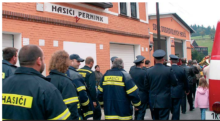
Po 140. letech existence místního sboru dobrovolných hasičů bylo v Perninku co slavit.