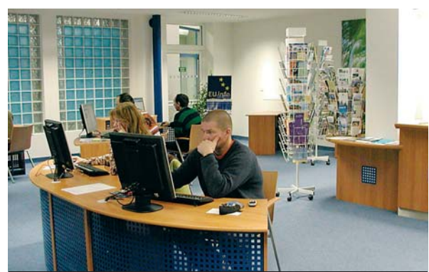
Moderní studovnu si oblíbili zejména mladí návštěvníci.

Krajská knihovna Karlovy Vary také umožnila uchazečům