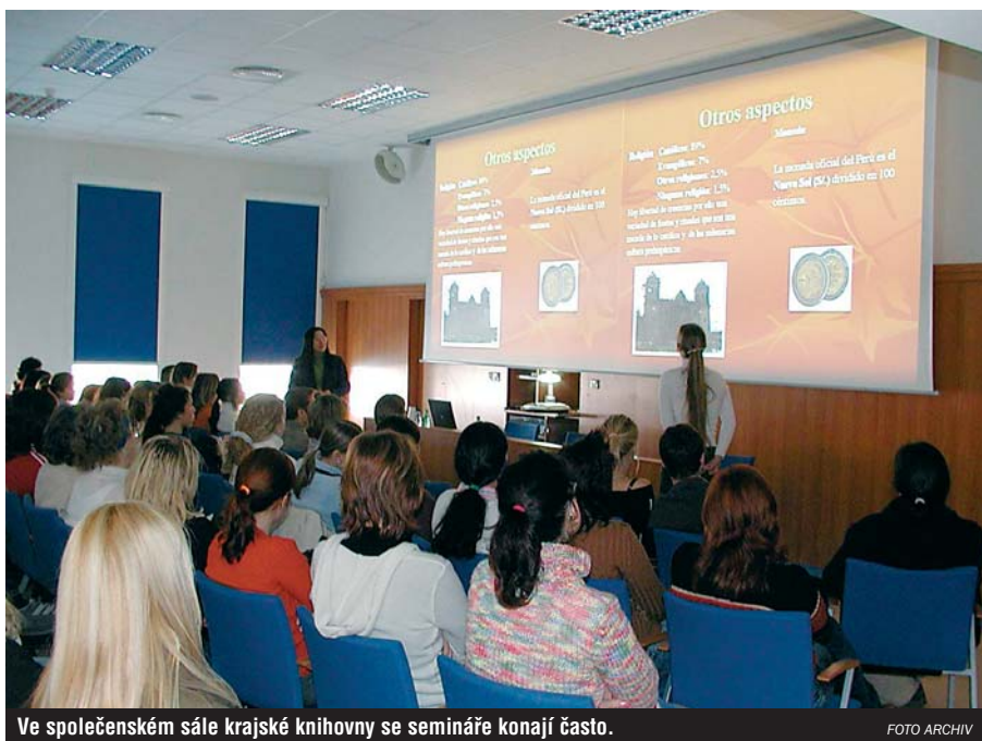
Ve společenském sále krajské knihovny se semináře konají často.

O CIZOJAZYČNÝCH KNIHÁCH MŮŽETE DISKUTOVAT NA ZVLÁŠTNÍCH SEMINÁŘÍCH