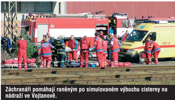
Záchranáři pomáhají raněným po simulovaném výbuchu cisterny na nádraží ve Vojtanově.

Cenou Karlovarského kraje je originální skleněný púlmíč s dvěma jehlami z dílny sklárny MOSER, a. s.