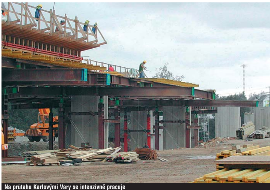
Na průtahu Karlovými Vary se intenzivně pracuje

Každý, kdo občas potřebuje projekt silniční trasou Cheb, Sokolov, Karlovy Vary směrem do Prahy, či jenom její dílčí částí mi dá jistě za pravdu, že se jedná o cestu velice nepřijemnou, pomalou a zejména pak nebezpečnou. Když bylo v roce 2002 přijímáno vládou usnesení, které hovořilo o zkrácení lhůty výstavby silnice R6 do roku 2010, všem velice svítila naděje. Zmíněná silnice totiž prochází územím Středočeského, Ústeckého a Karlovarského kraje. Ve Středočeském kraji představuje významnou dopravní komunikaci pro Rakovnícko, zvyšuje dopravní dostupnost hlavního města a výrazně snižuje zatížení životního prostředí mezi obcemi Pavlov a Hostivice.