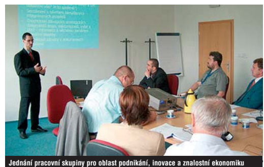
Jednání pracovní skupiny pro oblast podnikání, inovace a znalostní ekonomiku