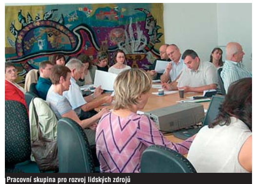
Pracovní skupina pro rozvoj lidských zdrojů

projektu realizována, je činnost krajských pracovních skupin, ve kterých probíhá příprava podkladů pro regionální programové dokumenty a sber konkrétních projektových záměrů. Do pracovních skupin byly nominovány subjekty, které reprezentují zájmy všech klíčových sektorů kraje tak, aby prioritní oblasti definované v regionálních strategických dokumentech korespondovaly se skutečnými potřebami celého území. Do těchto aktivit budou zapojeni také manažeré území, kteří se budou aktivně podílet na vzájemném přenosu klíčových informací mezi krajskými pracovními skupinami a územím. Bližší informace o činnosti pracovních skupin, možnosti zapojení do projektu a plánovaných aktivitách jsou také k dispozici na internetových stránkách kraje.