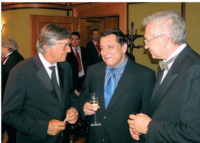
Při schůzce s premiérem České republiky Jiřím Paroubkem a s prezidentem festivalu Jiřím Barboškou jednali o další podpoře Karlovarského kraje filmovému festivalu i v příštích letech.