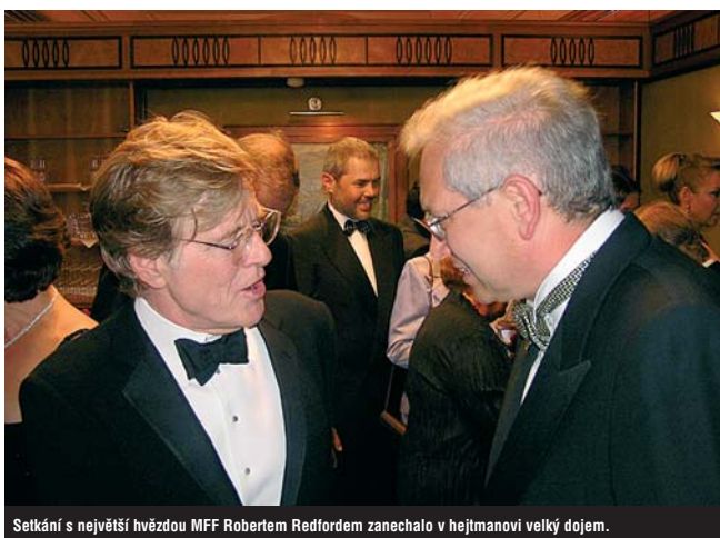
Setkání s největší hvězdou MFF Robertem Redfordem zanechalo v hejtmánovi velký dojem.